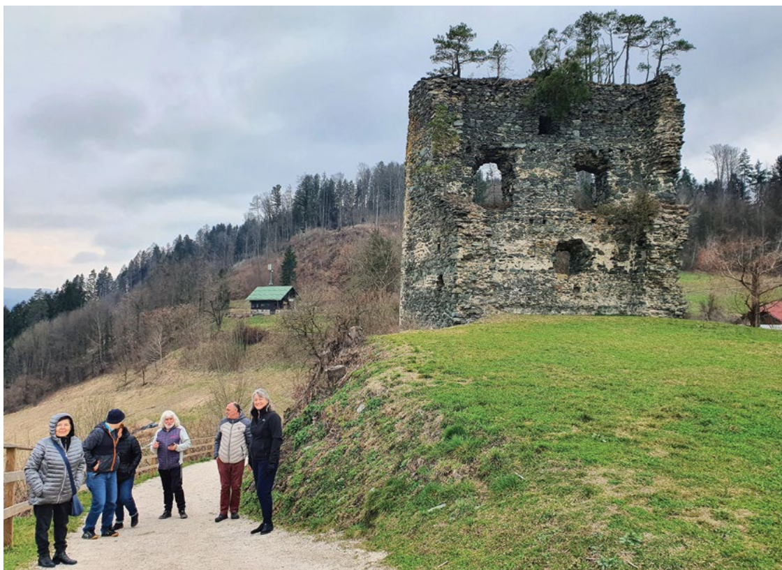
V ozadju razvaline gradu Dravograd

Danes je dan, ki vam, dragi fantje, je v dar poslan. Ker celo leto trpite in se znojite pod težko nalogo, da ženske zadovoljite. Bi kavico? Pivce? Morda masažo ali dve? Vam ženkice danes žvrgole. Nežen dotik po glavi, poljubček na nos in dobre volje zvrhan koš. S prijatelji skupaj staknite glave, o mukah vsakdanjih naj jezik pove. Za šankom poznanim naj Vam bo lepo, s kozarcem v roki si nazdravite glasno.