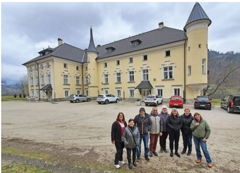
Člani in članice DGN Koroške pred gradom Bukovje

Po ogledu smo se odpravili na razvalino gradu Dravograd, kjer nas je pričakal lep razgled na športni center Traberkerk, reko Dravo, Črneče in Črneški zaliv ter v ozadju še pogled na Uršljo goro.