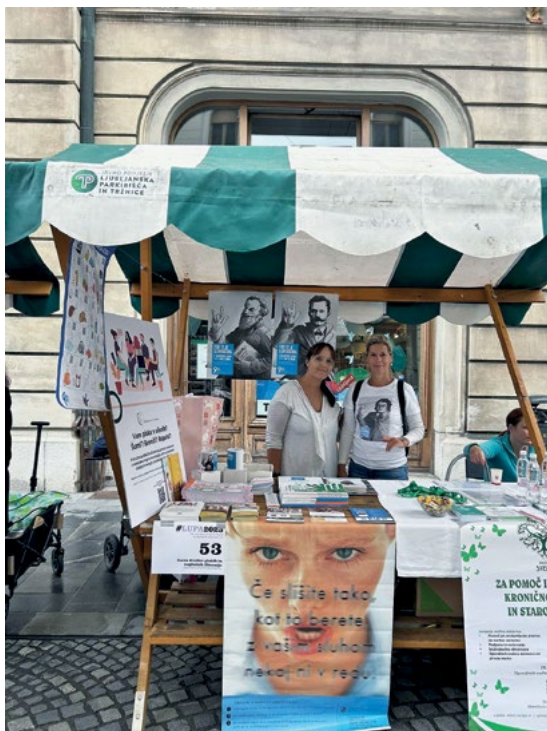
Ozaveščanje o pomoči oseb s tinitusom na dogodku LUPA

bilo dostopno tako na spletu kot v tiskani obliki in je pripomoglo k boljšemu razumevanju tega stanja v širši javnosti.