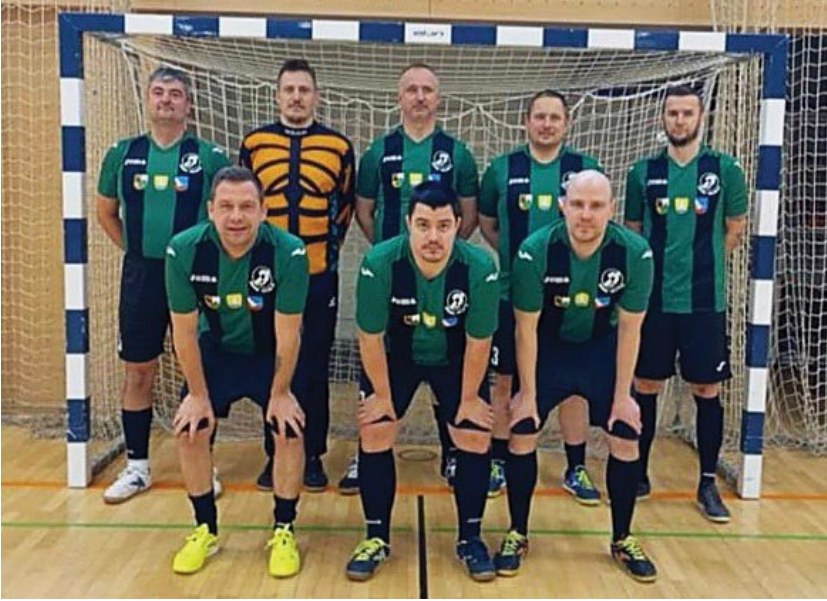
MDGN Velenje – 4. mesto

Kot koordinator futsal lige gluhih sem vesel, da smo s ŠZGS in kapetani oziroma vodji ekip kljub vsem začetnim oviram in težavam znali najti rešitve za uspešno izpeljavo lige. Liga je tudi bila priložnost za vsakega igralca, da se je s pomočjo svoje ekipe dokazal, da je dvoranski nogomet gluhih športna panoga, ki si znova zasluži mesto za uvrstitev na evropsko prvenstvo gluhih v dvoranskem nogometu, ki bo leta 2026 v Poreču. Še prej pa se je treba preiti skozi kvalifikacije, ki bodo leta 2025 (lokacija bo znana pozneje).