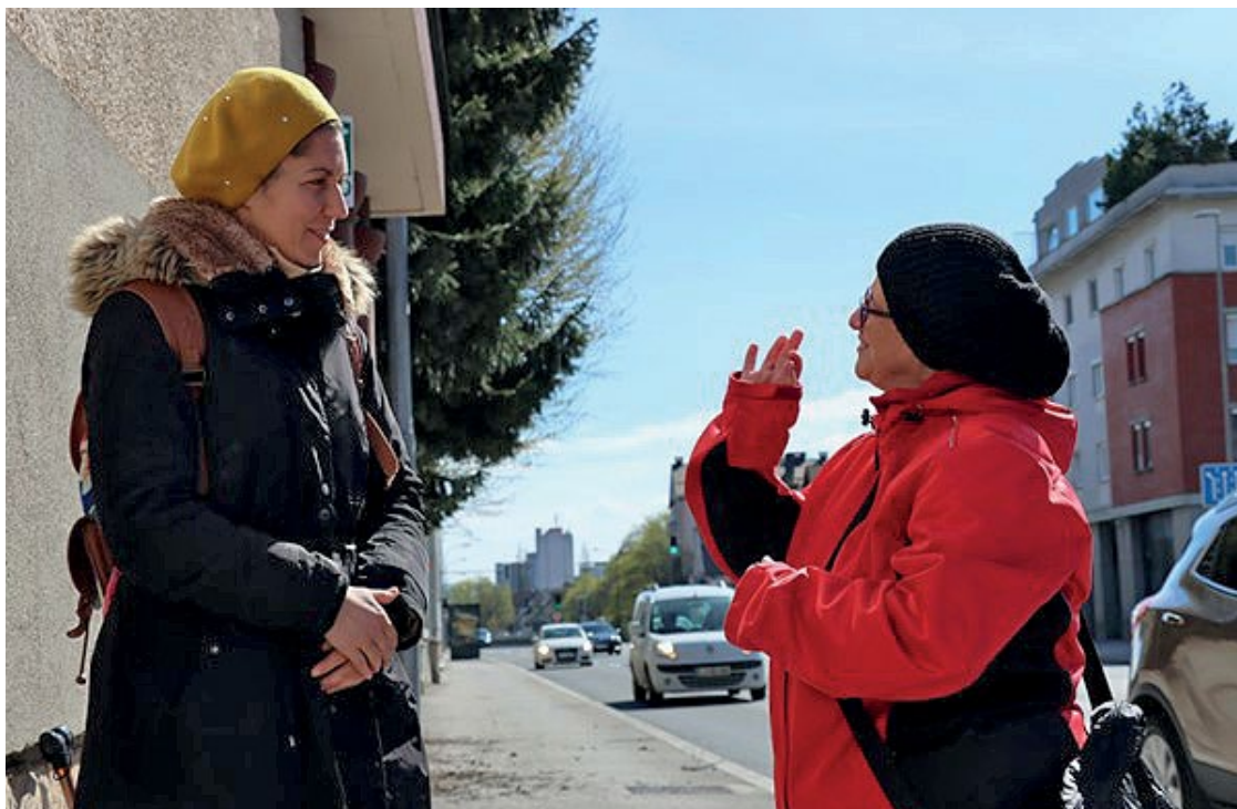
Pomoč pri projektu Multimodalna mobilnost