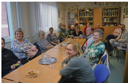
Člani MDGN Velenje so z zanimanjem prisluhnili predavanju.

Žal zdravilo za to bolezen še ni razvito. Lahko pa veliko naredimo sami s preventivo. Pomembno je, da že v srednjih letih poskrbimo za miselne dejavnosti, druženje, zdravo prehrano, dovolj gibanja in dober spanec, ki nam zagotavlja, da se zjutraj zbudimo naspani in