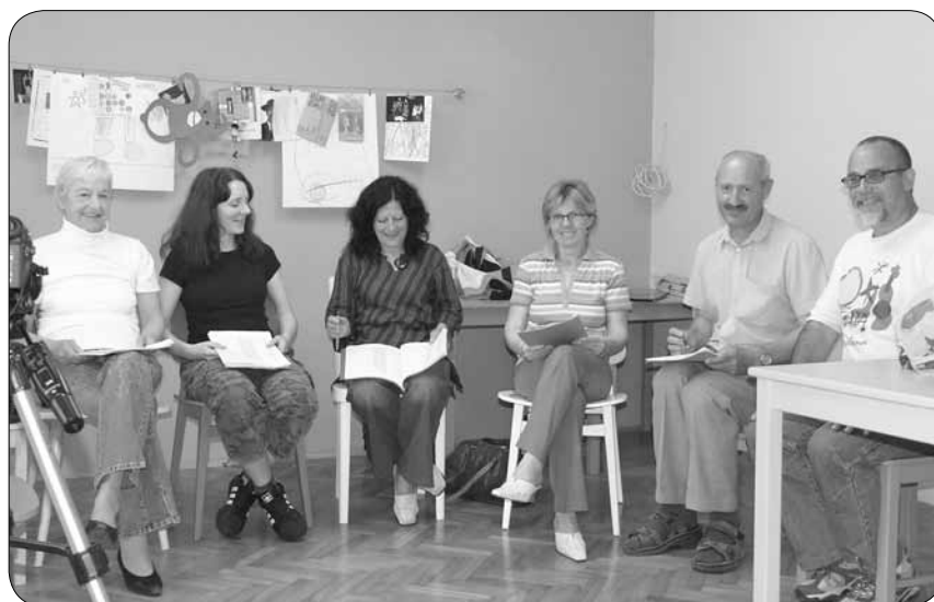
V prostorih otroške gledališke skupine Taka Tuka