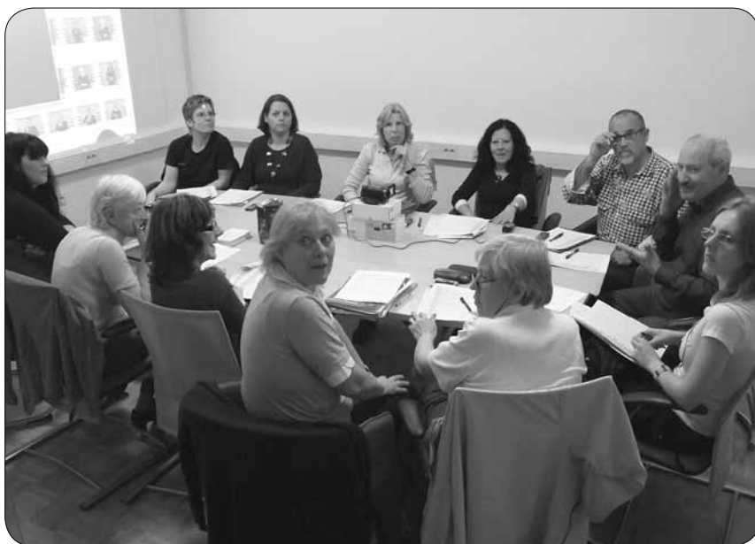
Skupina za razvoj slovenskega znakovnega jezika