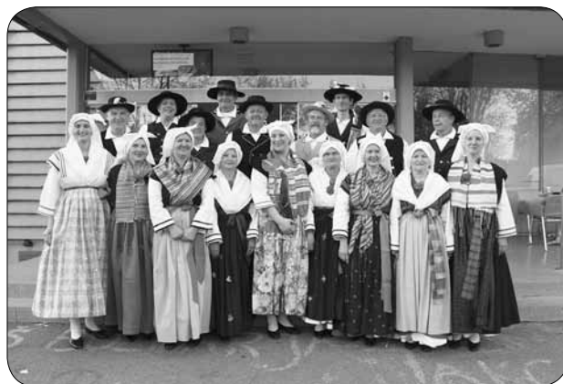
Folklorna skupina Veselje