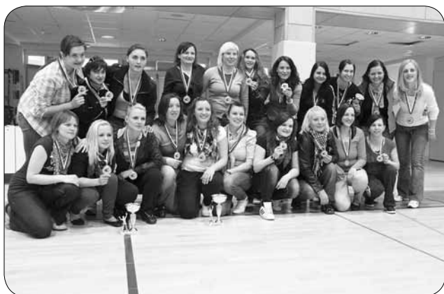
Dobitnice medalj in pokalov