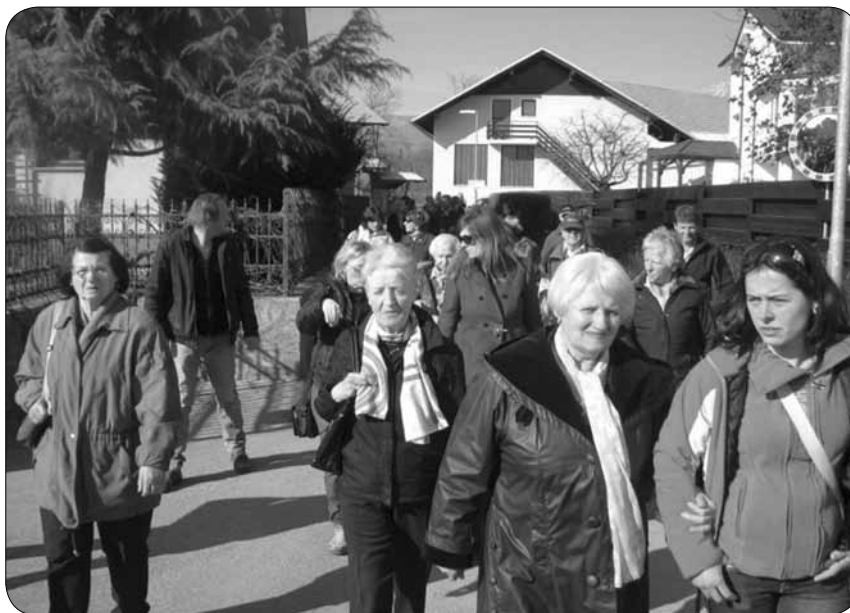
Članice MDG Severne Primorske

Letošnje praznovanje dneva žena v Kranju smo za razliko od prejšnjih let organizirali malo drugače. Ker so se v preteklosti vztrajno ponavljale pripombe, da so moški zastavljeni, smo se tokrat odločili, da dogodek organiziramo na dan mučenikov in tako ustrežemo obojim. Za popestritev druženja smo povabili tudi kolegice in kolege iz Medobčinskega društva gluhih in naglušnih Severne Primorske iz Nove Gorice.