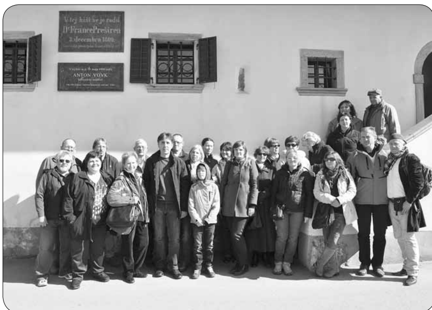
Pred rojstno hišo Franceta Prešerna