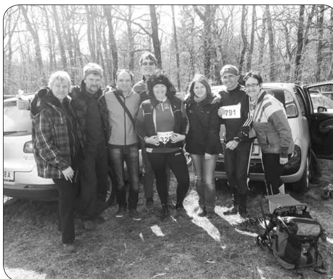
Gluhi iz Slovenije in Avstrije na Lipica Open