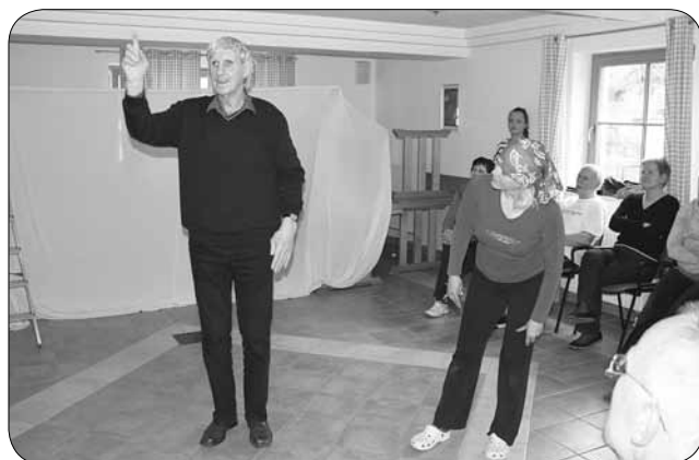
Gluhoslepi udeleženec delavnice