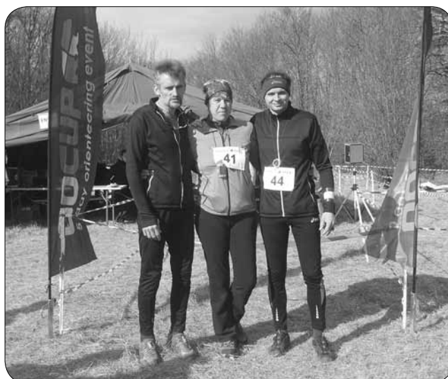
Člani OK Azimut