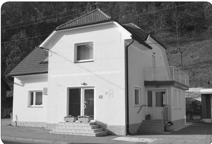
Društvo gluhih in naglušnih Posavja Krško