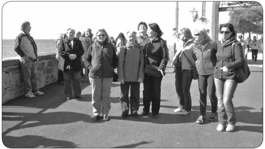
Sonce in beli Miramar