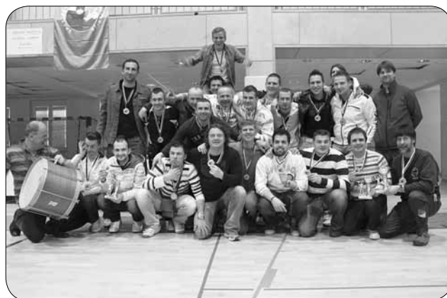
Dobitniki medalj in pokalov