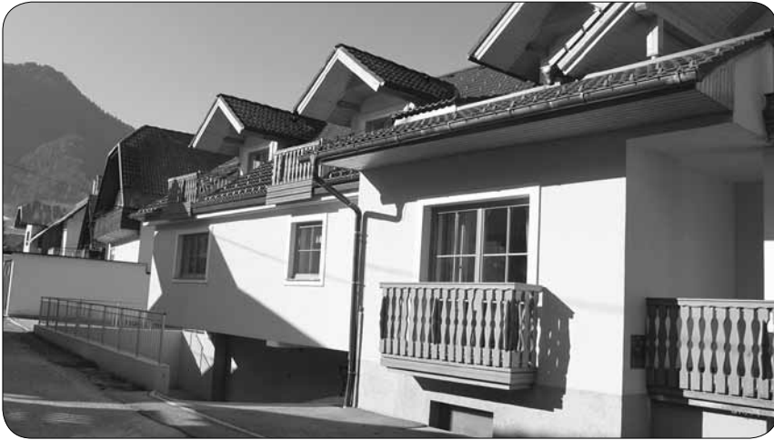
Počitniški dom v Kranjski Gori

Dom se nahaja v Naselju Slavka Černeteta blizu ceste Kranjska Gora – Vršič, v mirnem predelu, kjer so stanovanjske hiše in manjši penzioni. V bližini