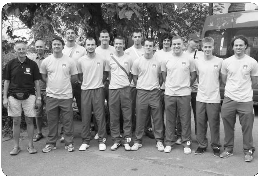
Košarkarska reprezentanca gluhih