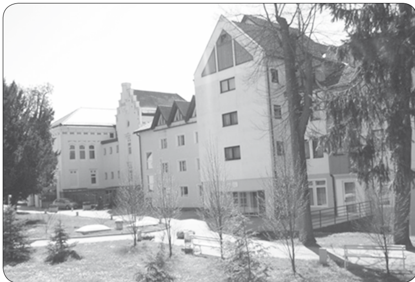
Dom upokojencev Loka pri Zidanem mostu