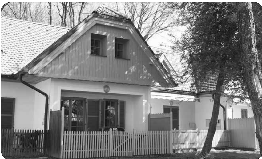
Apartma v Moravskih Toplicah

Zveza je lastnik štirih apartmajev v apartmajskem naselju Prekmurska vas, ki je v sklopu Naravnega parka Terme 3000. Apartmajsko naselje sestavljajo hišice z različnimi tipi apartmajev. Naselje je od hotelov Term 3000 oddaljeno približno 300 metrov in ima urejeno parkirišče.