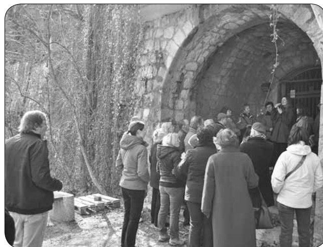
Rovi pod Kranjem