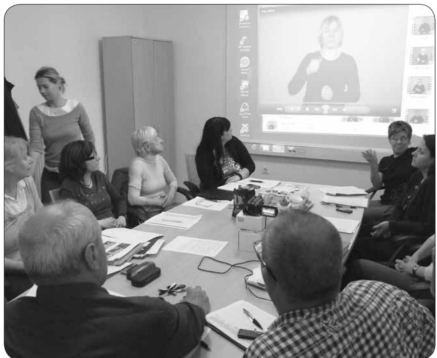
Skupina za razvoj slovenskega znakovnega jezika

Na podlagi izbranega besedišča naredijo analizo po regijah in določijo najpogosteje uporabljeno kretnjo, ki se jo standardizira. Poleg tega zapisujejo zgodovino kretenj in njihov izvor. Končni izdelek so kretnje, predstavljene s pomočjo različnih elektronskih medijev, ter priročniki. Skupina delo opravlja v lastnem studiu, kjer s tehnološko opremo