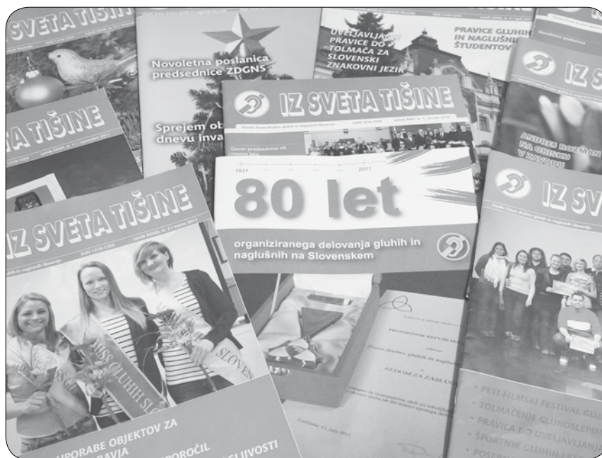
Glasiło Iz sveta tišine

Ne glede na to, ali so včlanjeni v društva, lahko v društvih ali na Zvezi publikacije dobijo brezplačno, pošljamo pa jih tudi javnim in strokovnim institucijam, ki delujejo na področju gluhotе.