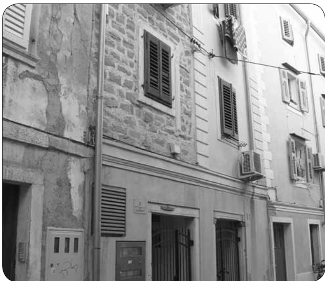
Počitniški dom v Piranu