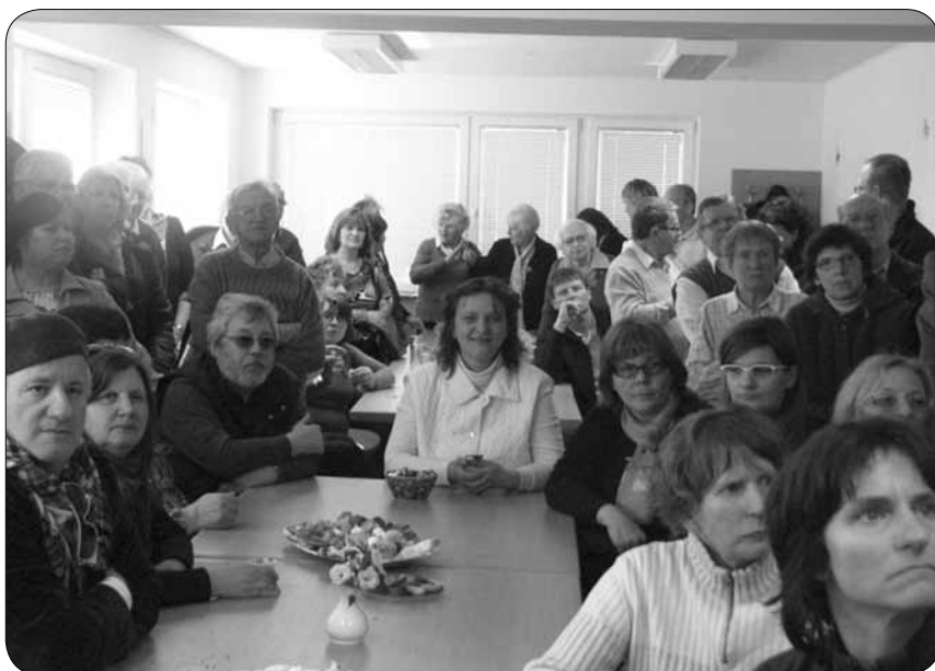
Gostje s Primorske

Marsikdo od njih se je spomnil stare lokacije društva v središču mesta in kar verjeti niso mogli, da smo v tako kratkem času pridobili lastne prostore, na katere smo zelo ponosni.