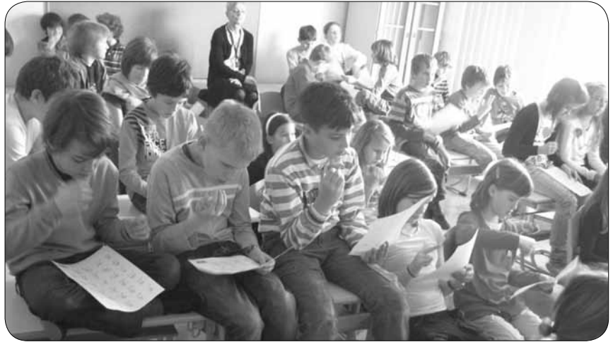
Učimo se enoročno abecedo

Ozaveščanje javnosti o gluhoti in naglušnosti postaja redna in prepoznavna dejavnost Medobčinskega društva gluhih in naglušnih za Gorenjsko AURIS Kranj. Tokrat so nas povabili na Osnovno šolo Valentina Vodnika v Ljubljani. Predstavniki uigrane ekipe, ki smo si izkušnje nabirali na predstavitevah po osnovnih šolah in vrtcih na Gorenjskem ter v Ljubljani, smo obiskali četrtošolce. Sprejeli so nas odprtih rok in z veliko pozitivne energije. Med otroci in učiteljicami smo zaznali posebno sproščenost, ki temelji na spoštovanju, kar vzpodbudno deluje na učni proces.