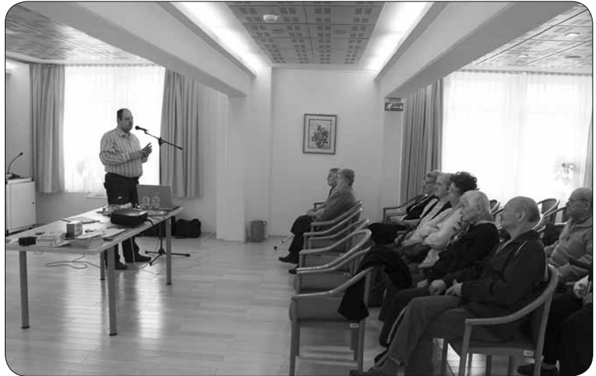
Predstavitel tehničnih pripomočkov

Posebej sem poudaril pomen rednega čiščenja in vzdrževanja aparata, predvsem vsakoletno čiščenje in vzdrževanje pri dobavitelju. Če slušnega aparata enkrat letno ne prinesete ali pošljete prodajalcu, se ima to za nevestno ravnanje. S tem izgubite pravico do garancije in morebitnega brezplačnega popravila v šestih letih dobe trajanja aparata. Ob tej priložnosti bi društva rad pozval, naj nam sporočijo datume, ko omenjeno predavanje lahko pripravimo pri njih ali v kateri občinskih ustanov. Bralce pa pozivam, naj v društvih povprašajo, kdaj bo organizirano v njihovi bližini.