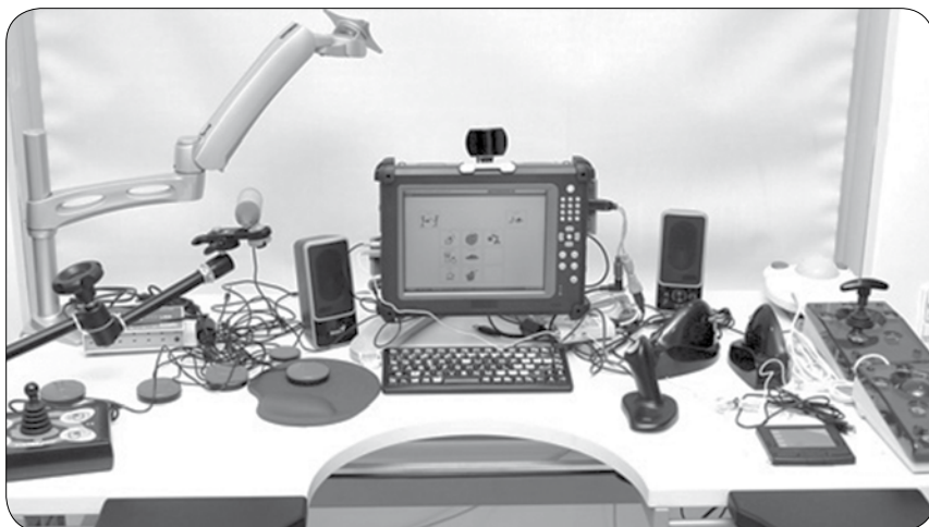
Tehnični pripomočki v pametnem stanovanju Iris