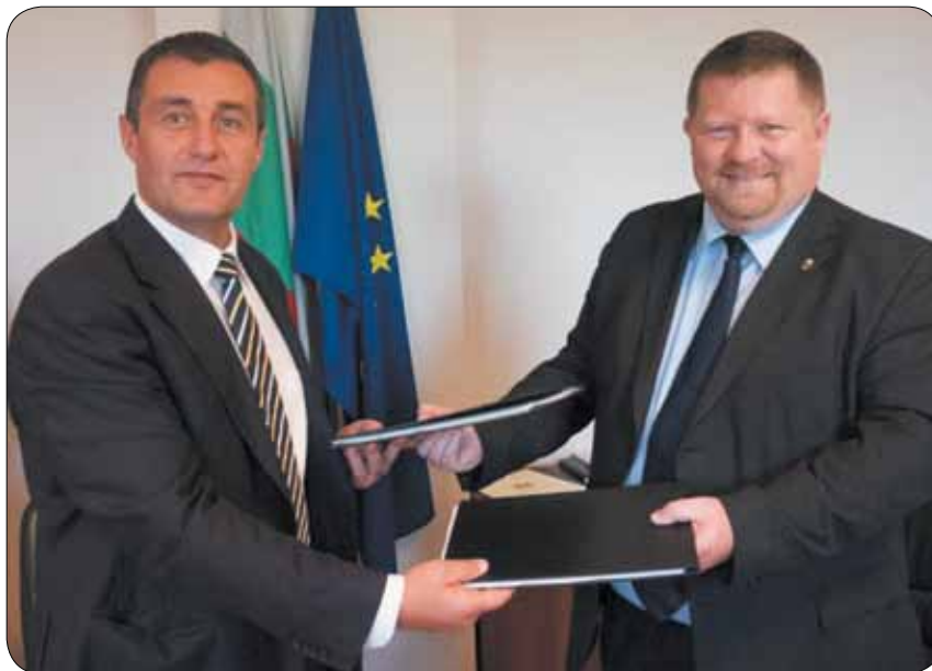
Podpis pogodbe med bolgarsko vlado in mednarodnim komitejem