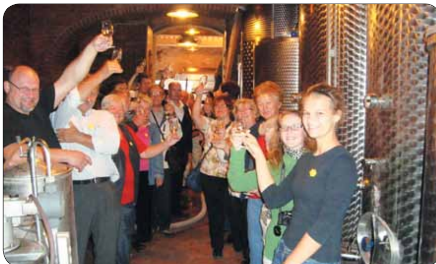
Vinska klet Resnik