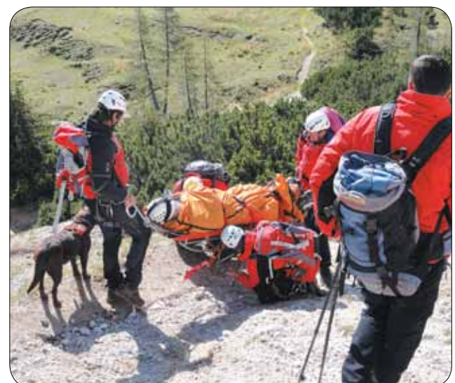
Reševalci poškodovanca nesejo v dolino