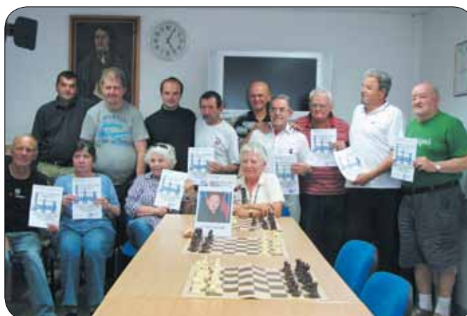
Tekmovalci na simultanki