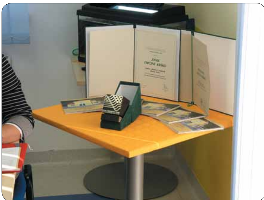
Znak občine Krško

Predstavili so tudi zbornik, ki so ga izdali ob 50-letnici delovanja društva, ter poudarili, da bo dvorana Kulturnega doma Krško, kjer bo potekala slavnostna akademija, posebej za to priložnost opremljena z indukcijsko zanko, ki naglušnim osebam s slušnim aparatom omogoča kakovostnejše poslušanje.