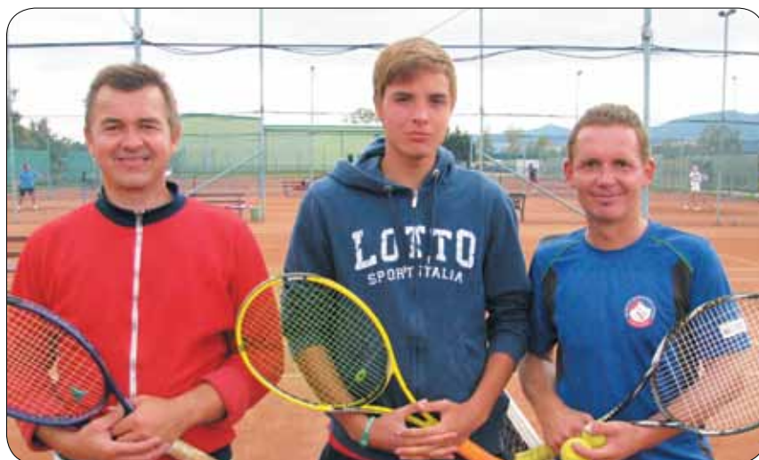
Trije najboljši na turnirju