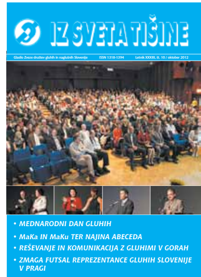
Fotografija na naslovnici: Mednarodni dan gluhih