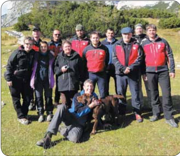
Reševalci, televizijska ekipa in pohodniki

pohode odpravimo v skupini in se držimo označenih poti, ter sami nikdar ne hodimo po brezpotjih. O poti in predvidenemu času vrnitve vedno obvestimo najbližje. Dandanes na spletu lahko dobimo večino informacij o dolžini in težavnosti predvidene poti, prav tako je priporočljivo s seboj vzeti planinsko karto, ki v veliki meri olajša orientacijo.