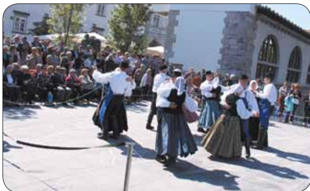
Folklorna skupina Veselje