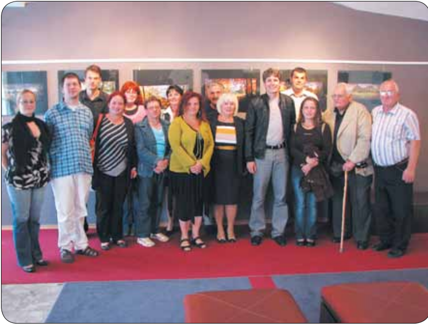
V galeriji atrija