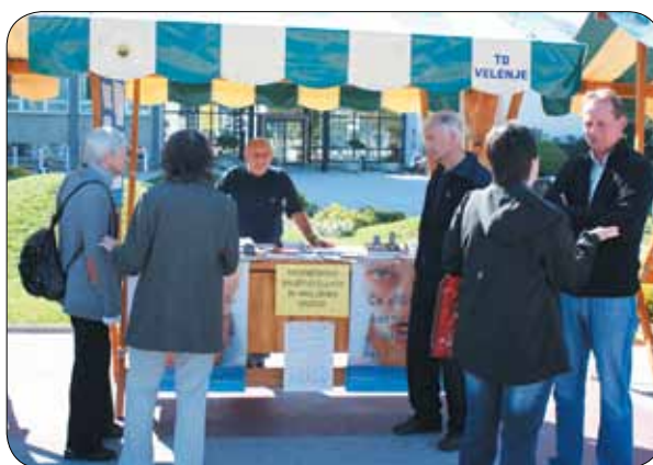
Predstavitev, tolmačena v SZJ

Na naši stojnici smo razstavili zloženko, revije in knjige ter obiskovalcem ponudili različne informacije o delovanju društva, njegovi lokaciji, možnostih za pridobitev slušnih pripomočkov, uporabi slovenskega znakovnega jezika ter o težavah, s katerimi se dnevno srečujejo ljudje z okvaro sluha. Informacije smo prilagodili potrebam in željam vsakega posameznika. Na ogled smo postavili tudi različne slušne aparate in dva tehnična pripomočka – telefon z ojačenim zvokom v slušalki in FM sistem za individualno uporabo.