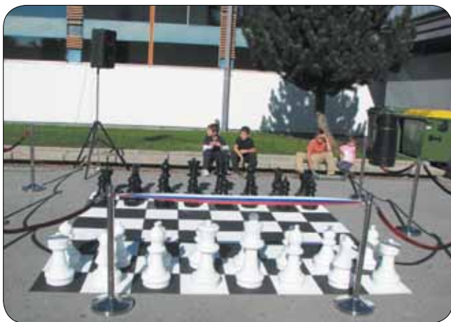
Prva šahovnica na prostem