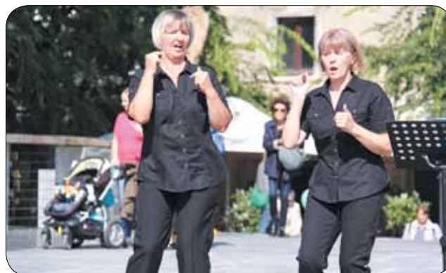
Pevska skupina Solze