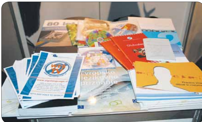
Razstavni prostor Zveze

s projektom Slovar mednarodne kretnje in slovenskega znakovnega jezika na spletu predstavljali Zvezo društev gluhih in naglušnih Slovenije. Predstavili smo celotno področje razvoja znakovnega jezika ter pripravili gradivo in lično oblikovan plakat.