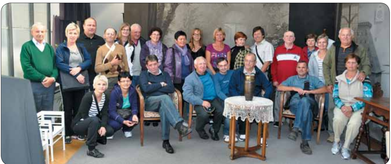
V Pelikanovem ateljeju