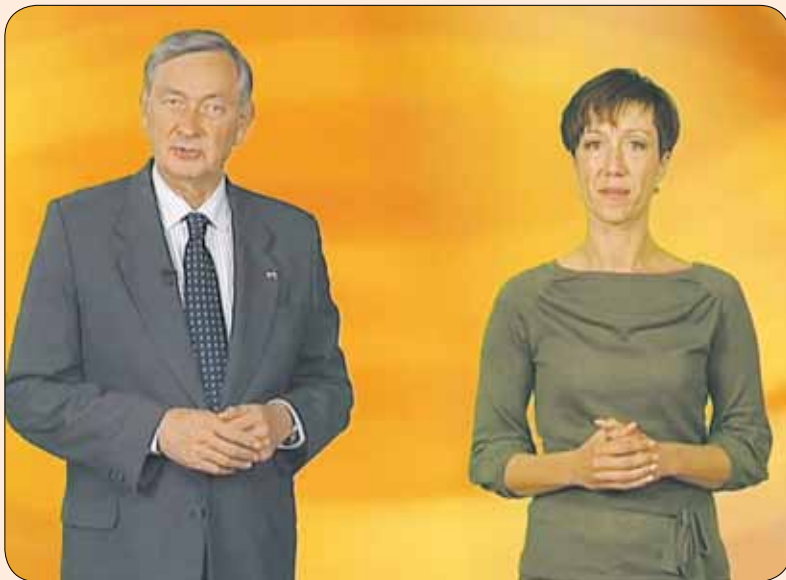
Dr. Danilo Türk

Svetovna federacija gluhih je že pred več kot šestdesetimi leti, ko je razglasila mednarodni dan gluhih, opozorila na pomen socialne integracije in možnosti za popolno informiranje gluhih kot osnovnih pogojev za aktivno vključevanje gluhih in naglušnih v življenje in delo. Ta izhodišča so bila kasneje večkrat zapisana v različnih dokumentih Organizacije združenih narodov in še posebej v Konvenciji o pravicah invalidov. Ponovljena so bila tudi v našem Zakonu o izenačevanju možnosti invalidov.