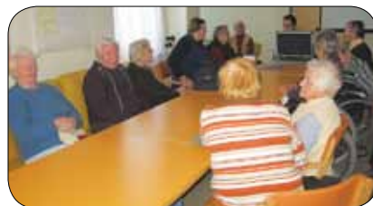
Zanimanje je bilo veliko

Sredi decembra so predstavniki Medobčinskega društva gluhih in naglušnih Slovenske Konjice, Vitanje in Zreče obiskali naglušne člane v Lambrechtovem domu in zanje organizirali servis slušnih aparatov. Obiska so bili zelo veseli, saj do omenjenih storitev težje dostopajo, aparat pa je potrebno servisirati vsaj enkrat letno. Slušni akustik je aparate pregledal in popravil. Servis je bil brezplačen, društvo pa je vsem uporabnikom podarilo zavitek baterij in skromno darilce.