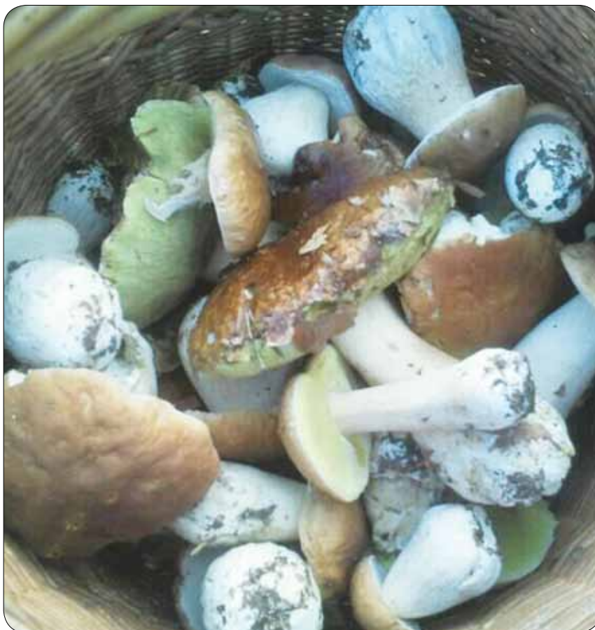
Veliko se jih je nabralo