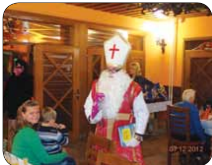
Otroke je obiskal Miklavž