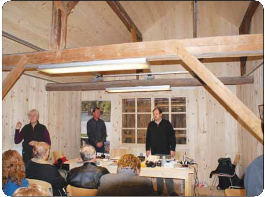
Predstavniki MDGN Velenje in ZDGNS

Junija lani so se predstavniki odbora naglušnih in Zveze društev gluhih in naglušnih Slovenije udeležili 9. svetovnega kongresa Mednarodne