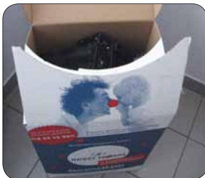
Škatla je bila polna

S preprostim in prijaznim pristopom, socialnim čutom in osebno močjo jim prinašajo upanje in življenjski pogum, ki sta največkrat bistvenega pomena pri soočanju s posledicami bolezni. V žalostni in tragični realnosti bolezni ter trpljenja lahko Rdeči noski stojijo bolniku ob strani kot namišljena figura, ki jih popelje v otroško domišljijo ter najde dostop do čustvenega sveta otrok in starostnikov. Na ta način odločilno prispevajo k izbolšanju klime in poteka bolnišničnega zdravljenja.