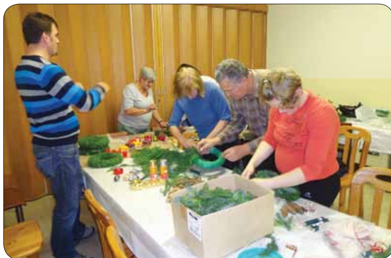
Pridno smo se lotili dela