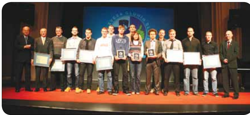
Dobitniki priznanj za najboljšega športnika, športnico in ekipo

Lanskega decembra smo s svečano prireditvijo v Kulturnem domu Franca Bernika v Domžalah obeležili 20 let organiziranega delovanja športa gluhih in Športne zveze gluhih Slovenije. Na prireditvi smo povabili vse reprezentante in trenerje, ki so v dvajset letih pod slovensko zastavo nastopili na velikih tekmovanjih – evropskih in svetovnih prvenstvih ter olimpijskih igrah gluhih. Vabilu