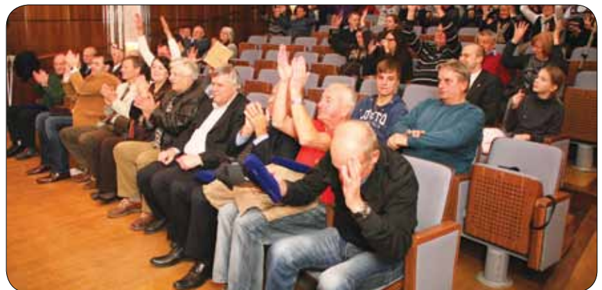
20. obletnica Športne zveze gluhih Slovenije

Evropskega invalidskega parlamenta, kjer smo po dveh dneh sprejeli posebno deklaracijo. Tema letošnjega parlamenta je bilo odstranjevanje ovir za dostopno in vključujočo družbo za vse. Na sprejemu pri omenjenih poslancih smo podrobno pojasnili dogajanje v Sloveniji in se dogovorili za okrepljeno sodelovanje.