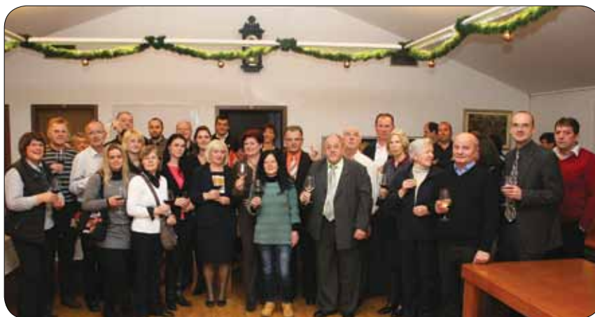
Novoletni sprejem strokovnih sodelavcev in predsednikov društev

Decembra smo speljali še zadnja uradna srečanja, kot sta upravni odbor Zveze in novoletni sprejem strokovnih sodelavcev ter predsednikov društev. Z namenom potrditve novega statuta in poslovnika Zveze smo sklicali tudi nekaj skupščin. Leto smo uspešno zaključili in se pred novim letom še enkrat prijetno podružili.