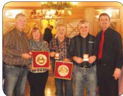
Prejemniki športnih priznanj