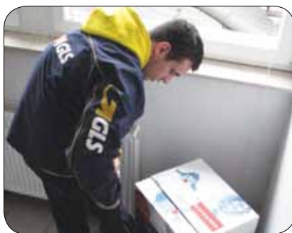
Tudi mi darujemo in pomagamo