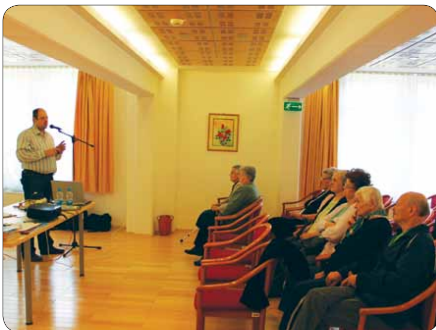
Predstavitve tehničnih pripomočkov

V Centru možnosti imamo tehnične pripomočke, ki osebam z okvaro sluha z ali brez slušnega aparata in uporabnikom polževega vsadka pomagajo razumeti in razločevati glasovni govor. V njem lahko uporabniki pred nakupom preizkusijo tehnične pripomočke, svetujemo in pomagamo pa jim tudi pri njihovi izbiri.