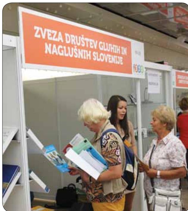
Gneča pred našim razstavnim prostorom

V preteklem letu smo skupaj s člani odbora naglušnih in zunanjimi sodelavci izvedli štiri predavanja po Sloveniji, kamor so nas povabili predstavniki društev in lokalne skupnosti. Potekala so v knjižnicah, domovih za ostarele, dnevnih centrih in občinskih prostorih. Predstavili smo tehnične pripomočke, ki so na ogled v tehnično-informacijski pisarni, ker pa mnogi v času uradnih ur ne morejo priti v Ljubljano, smo predstavitve pripravili v njihovem okolju. Na predavanjih je bilo v povprečju prisotnih deset slušateljev – gluhih, naglušnih in njihovih svojcev.