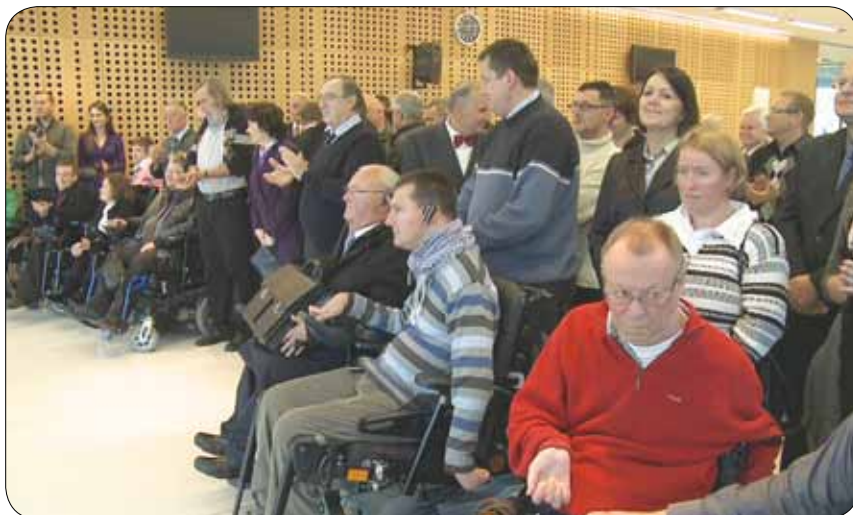
Sprejem pri nekdanjem predsedniku RS ob mednarodnem dnevu invalidov