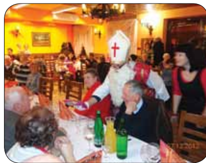
Miklavž je obdaril tudi starejše