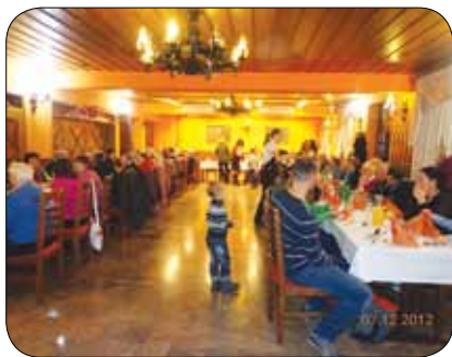
Leto so zaključili z druženjem