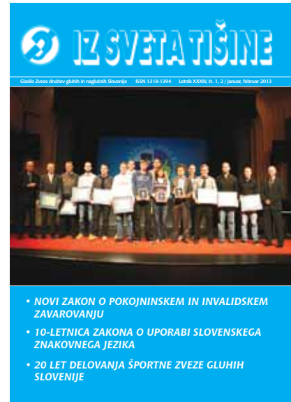
Fotografija na naslovnici: 20-letnica Športne zveze gluhih Slovenije

IZDAJATELJ: Zveza društev gluhih in naglušnih Slovenije, Drenikova 24, Ljubljana, telefon: 01/500 15 00, telefaks: 01/500 15 22 SPLETNA STRAN: www.zveza-gns.si UREDNIK: Adem Jahjefendić, urednistvo.ist@zveza-gns.si UREDNIŠKI ODBOR: Zdenko Tomc, Franci Mulej, Boris Horvat, Nina Janžekovič, Aleksandra Rijavec Škerl, Nataša Kordiš LEKTORICA: Barbara Perc OBLIKOVANJE: Franc Planinc TISK: Farba, grafične storitve d. o. o. Uredništvo si pridržuje pravico do objave, neobjave, krajšanja ali delnega objavljanja nenaročenih prispevkov v skladu s poslanstvom in prostorskimi možnostmi glasila. V posameznih primerih mnenja posameznikov ne izražajo obvezno tudi mnenja ZDGNS. Nenaročenih besedil in fotografij ne vračamo. Ponatis celote ali posameznih delov je dovoljen le s pisnim privoljenjem. Anonimnih prispevkov oziroma prispevkov, ki žalijo čast drugih, ne objavljamo. Glasilo je brezplačno in v javnem interesu, zaradi česar na podlagi 8. točke 26. člena Zakona o davku na dodano vrednost (UL RS št. 89/98) ni zavezano k plačilu DDV-ja. Izhaja v nakladi 3.700 izvodov.