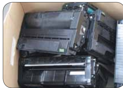
Pridno smo zbirali

Da bi bilo Rdečim noskom olajšano njihovo plemenito poslanstvo in da bi bolnikom vsaj malo olajšali bolnišnično zdravljenje, smo v našem društvu začeli akcijo zbiranja odpadnih kartuš. Zbrani material so ob koncu leta odpeljali, akcija v društvu pa se nadaljuje. Naj bo obenem to tudi poziv vsem, ki ne veste, kam z odpadnimi kartušami – podarite jih Rdečim noskom! Zagotovo boste s tem plemenitim dejanjem naredili dobro delo.