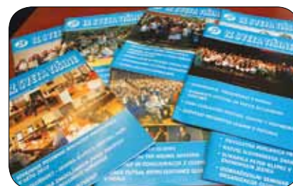
Glasilo Iz sveta tišine

Upravičeni uporabniki programa so osebe z okvaro sluha, vključene v društva gluhih in naglušnih, njihovi sorodniki, strokovni delavci, ki delajo z uporabniki, ter vse ostale strokovne organizacije (šolski centri, centri za socialno delo, domovi starejših občanov ...), ki vključujejo osebe z okvaro sluha. Glasilo pokriva celotno območje Slovenije, je brezplačno in ga osebe z okvaro sluha s pisanjem prispevkov aktivno