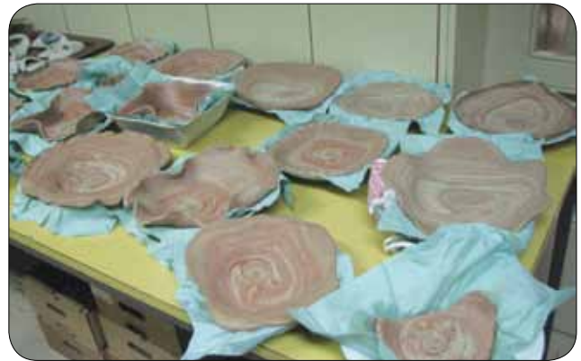
Izdelki čakajo na pečenje

Plodno sodelovanje med Medobčinskim društvom gluhih in naglušnih za Gorenjsko Auris Kranj ter osnovno šolo Valentina Vodnika v Ljubljani je botrovalo posebnemu povabilu na njihovo učno delavnico, začetni tečaj oblikovanja gline. Nemalo zaslug za povabilo ima tudi Nia Cimperšek, učenka 5. c razreda, ki pridno sodeluje pri zunajšolskih dejavnostih, in pridobljena znanja spretno prenaša med naše gluhe in naglušne uporabnike.