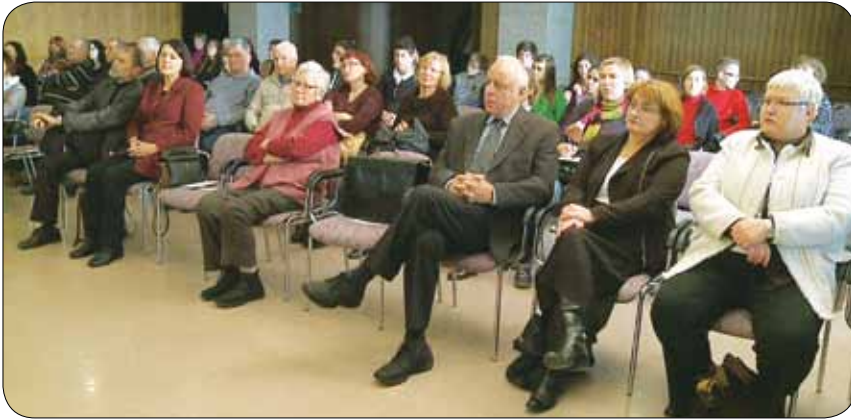
Posvet ob 10-letnici sprejetja ZUSZJ