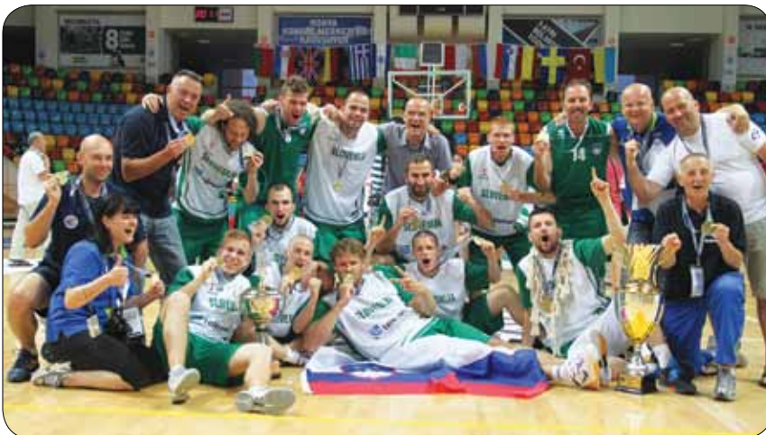
Evropski košarkarski prvaki