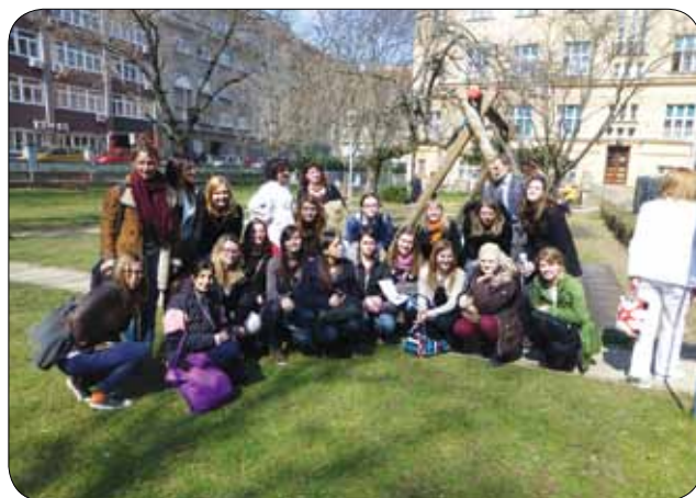
S skupino študentk

Prvič sem imela možnost spoznati, kako poteka obravnava oseb z okvaro sluha in govora v zgodnjem otroštvu, saj so nam med ogledom predstavili različna področja dela.