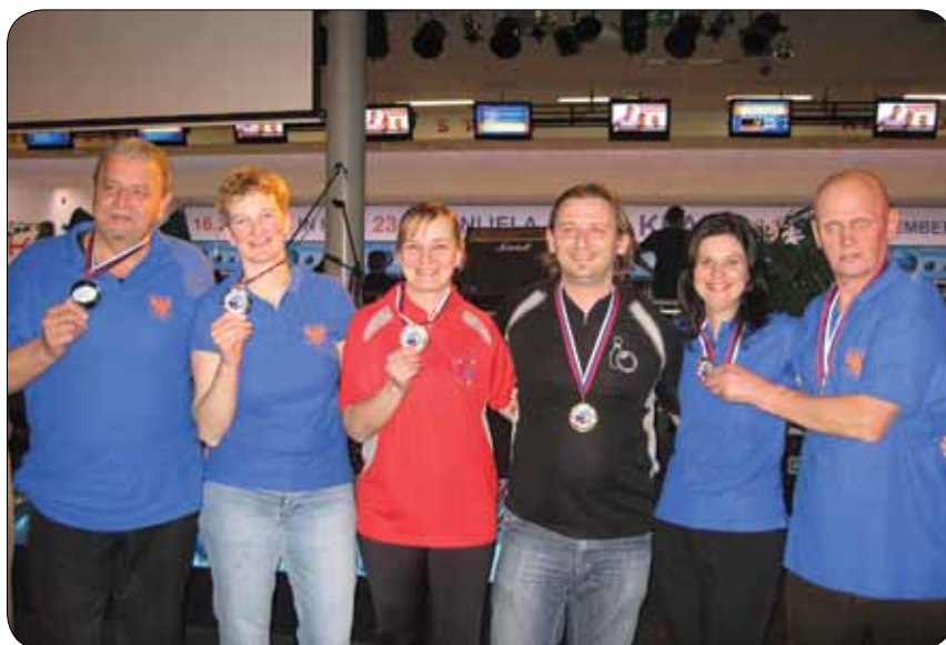
Dobitniki medalj v kategoriji mešanih dvojic