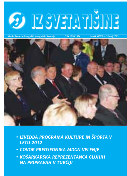
Fotografija na naslovnici: Svečana proslava ob 50-letnici MDGN Velenje