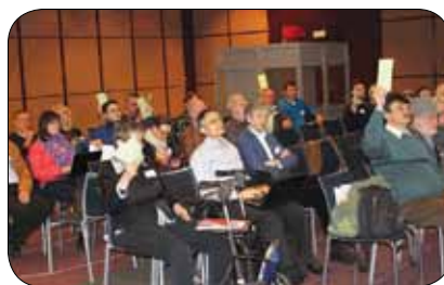
Skupščina Evropske zveze naglušnih

Predsednik in sekretar Športne zveze gluhih Slovenije sta obiskala društva in jim predstavila delovanje v okviru športa gluhih in naglušnih. Odgovorila sta na zastavljena vprašanja in jih spodbudila k nadaljnjemu sodelovanju. Šport je še vedno najbolj priljubljen poseben socialni program, ki poleg rekreacije omogoča tudi medsebojno druženje.