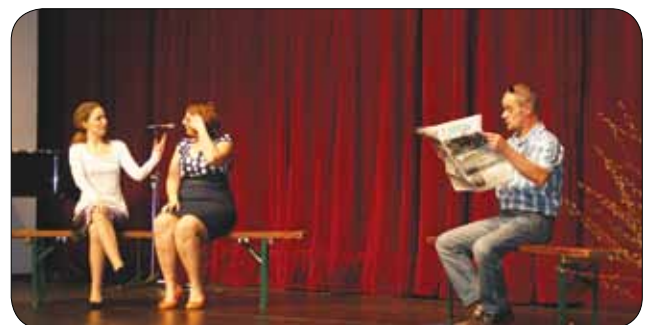
Nastop članov MDGN Velenje