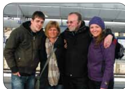
Na železniški postaji na Dunaju

Obravnavali smo različne teme s področja kulture, kot so gledališče, fotografija, vizualna umetnost, glasba in poezija. Učili smo se medna-