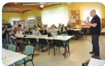
Okrogla miza Športne zveze gluhih

Na povabilo Zveze Sožitje – zveze društev za pomoč osebam z motnjami v duševnem razvoju Slovenije, ki je ob 50-letnici organizirala posvet o lahkem branju, smo skupaj s predstavniki Zavoda za gluhe in naglušne Ljubljana sodelovali pri pripravi smernic za pravo tiskanih besedil, ki so lažje razumljiva različnim populacijam, med drugim tudi gluhih in naglušnih. Ekipe Zavoda Risa – centra za splošno, funkcionalno in kul-