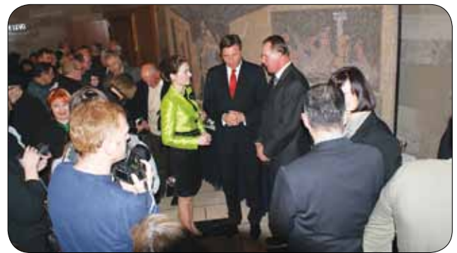
Predsednik republike Borut Pahor