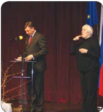
Predsednik RS Borut Pahor

Na začetku marca sem se udeležila posebne slovesnosti ob 50-letnici delovanja Medobčinskega društva gluhih in naglušnih Velenje. Prireditvev je bila bogato kulturno obarvana z zanimivim programom, ki je navdušil vse navzoče.