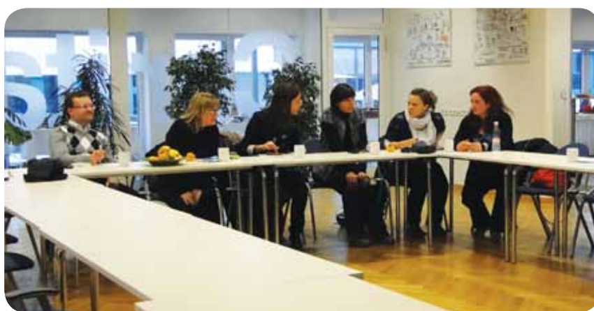
Udeleženci študijske poti

Projekt Prehod je glede na naraščanje brezposlenosti mladih zelo aktualen, saj odgovarja na perečo problematiko, ki se iz dneva v dan poslabšuje.