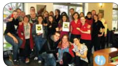
V kavarni, kjer delajo gluhi

Od 25. marca do 5. aprila so se v Pragi odvijale kulturne delavnice z nazivom Break the Silence (slovensko: zlomimo tišino ), ki jih je v okviru projekta Grundtvig izvedel praški Humanitas-Profes .