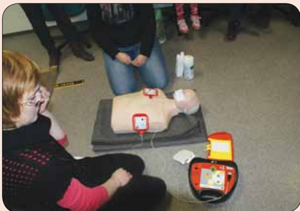
Avtomatski električni defibrilator (srčni spodbujevalnik)