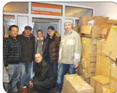
Donacija podjetja Top Shop International