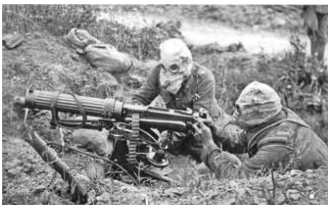
Uporaba kemičnega orožja

Razvoj novega orožja, kot so tanki, vojaška letala, bojne ladje, podmornice in topi, je dal nove možnosti ubijanja, pohabljanja, uničevanje in zastraševanja. V prvi svetovni vojni je bilo tudi prvič v zgodovini človeštva uporabljeno kemično orožje.