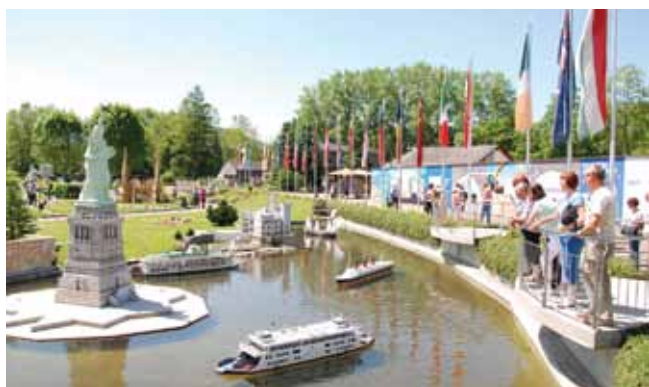
Pogled na pomanjšane skulpture

Srce Minimundusa so tako modeli, ki so jih v Minimundusovi modelarski delavnici zvesto izdelovali kot