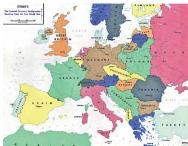
Evropa leta 1919

Prva svetovna vojna je odnesla štiri velika cesarstva: Rusko, Nemško, Avstro-Ogrsko in Otomansko ter za vedno spremenila obliko Evrope. Na Balkanu je nastala nova država – Kraljevina Srbov, Hrvatov in Slovencev. Vplivala je tudi na svet, oznanila je zaton mogočnega Britanskega imperija ter vzpon ZDA kot nove svetovne velesile. Z razpadom Ruskega cesarstva so leta 1917 na oblast prišli komunisti.