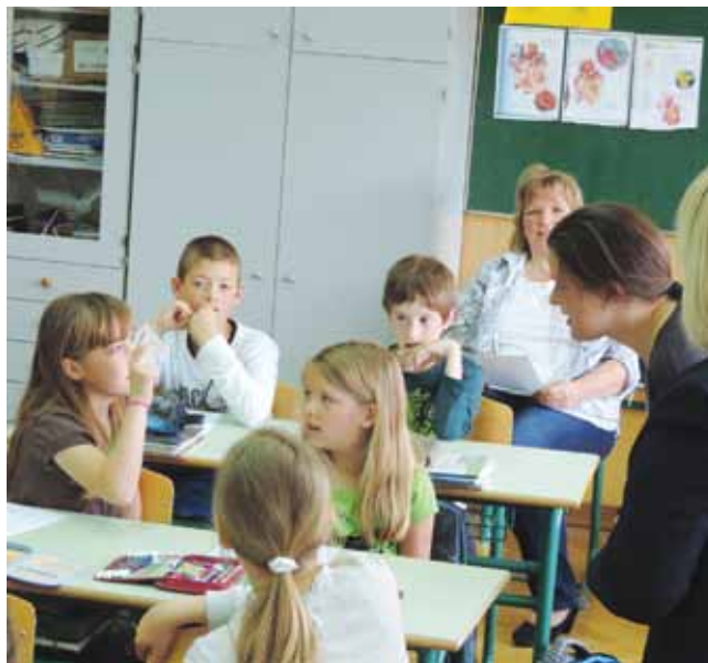
Vsi so pridno sodelovali

Vsi učenci so z zanimanjem spremljali razlage, kaj pomeni gluhotata in kaj naglušnost, kakšni so bili slušni aparati nekoč in kakšni so danes, kaj je to slovenski znakovni jezik in kako pomemben je za gluho popu-