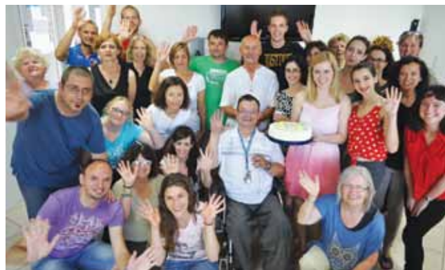
Veselite ob zaključku tečaja