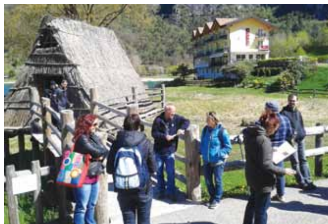
Strokovna ekskurzija v Italiji

V aprilu 2014 smo se odpravili tudi na strokovno ekskurzijo arheoloških parkov, muzejskih postavitvev, delavnic in primerov dobrih praks v Italiji. V sklopu eksperimentalnih delavnic in v organizaciji ter pod mentorstvom Zavoda za podvodno arheologijo smo si ogledali kolišča na jezeru Ledro, Villo Rustico v Desenzanu na jezeru Garda in mesto Verona.