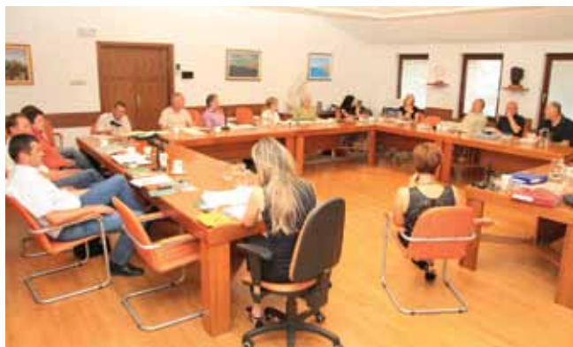
Seja upravnega odbora

Pred poletjem smo sklicali sejo Upravnega odbora Zveze društev gluhih in naglušnih Slovenije, na kateri smo podrobneje obravnavali aktualno zakonodajo in številne donacije. Največji poudarek pa je bil konstituiranju obeh odborov za gluhe in naglušne. Odprli smo tudi druge aktualne teme, ki še kako vplivajo na naše delovanje. Ponovno smo ugotovili, da bo treba na področju zakonodaje sistematično delovati, še posebej sedaj, ko se socialne pravice vedno bolj krčijo.