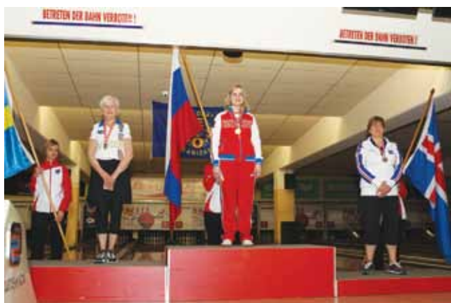
Dobitnice medalj posamično