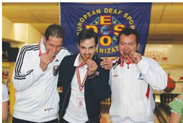
Dobitniki medalj posamično