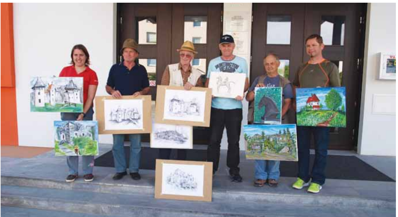
Udeleženci kolonije s svojimi deli