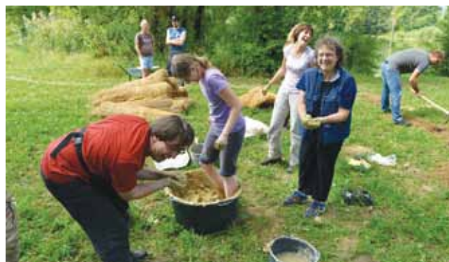
Utrinki z delavnice na ribnikih na Verdu

V času projekta so potekale tudi eksperimentalne delavnice na terenu, in sicer na ribnikih opuščenih glinokopov na Verdu pri Vrhniki. Glavni vsebinski poudarek so bila prazgodovinska kolišča na Ljubljanskem barju, udeleženci usposabljanj pa so se seznanili z naravnimi materiali, njihovo obdelavo in tehnologijami izdelave različnih predmetov in dejavnosti iz obdobja prazgodovine.