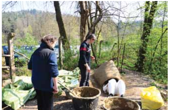
Utrinki z delavnice na Pržanu

brati ustrezne ponudnike za izvajanje teoretičnega in praktičnega usposabljanja. V prvi fazi projekta smo najprej organizirali predstavitveno delavnico, na katero smo povabili brezposelne gluhe in naglušne osebe, ki bi bile primerne za vključitev v program usposabljanja. Vključilo se je 11 oseb. Najprej smo izvedli animacijsko delavnico za gluhe in naglušne, in sicer 15. 7. 2013. Povabljenih je bilo 12 oseb. Na delavnici smo predstavili cilje projekta in časovni plan izvedbe ter opravili intervjuje s posamezniki. Po delavnici se je 11 udeležencev odločilo za vključitev v usposabljanje.