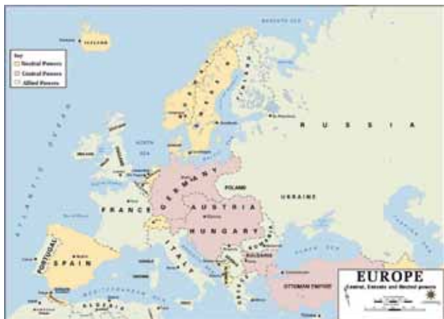
Evropa leta 1914

Konec 19. in v začetku 20. stoletja so Balkan pretresale vojne, nemiri, politična nestabilnost in tuja okupacija. Vzpon Srbije kot nove balkanske velesile je povzročil močna trenja med Srbijo in Avstro-Ogrsko, ki je imela Balkan za svoje interesno območje.