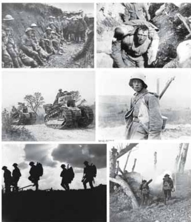
S prvih bojnih linij

Na frontah prve svetovne vojne se je bojevalo okoli 60 milijonov vojakov. V celotnem obdobju prve svetovne vojne jih je umrlo 9 milijonov, kar pomeni neverjetnih 6 tisoč mrtvih vojakov na dan. Tudi ko govorimo o civilnih žrtvah, je številka zastrašujoče visoka. Umrlo je 6 milijonov civilistov, največ zaradi lakote in bolezni.