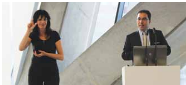
Predavanje, foto: Adem Jahjefendić