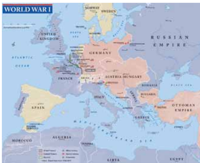
Prva svetovna vojna

Tako je sprva majhen konflikt na Balkanu prerasel v vojno svetovnih razsežnosti. Že leta pred vojno sta se v Evropi oblikovali dve nasprotujoči si skupini držav, tako imenovani Antanta in Centralne sile, ki sta tekmovali za gospodarsko, politično, vojaško in kolonialno prevlado v Evropi in po svetu.