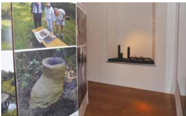
Utrinek z avtorske razstave