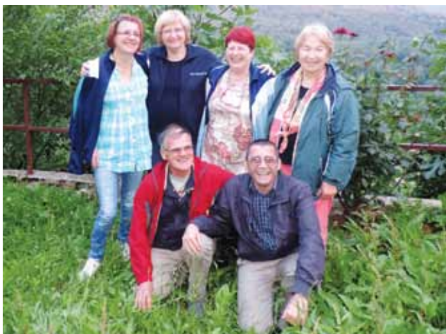
Skupina za samopomoč Rudolfovo

Z gluhihmi se težko sporazumevamo, ker ne obvladamo znakovnega jezika. V svetu slišičih pa težko dohajamo vse informacije, ki jih za funkcioniranje potrebujemo, in težko opravljamo vsakodnevne opravke, ki so odvisni od medsebojne komunikacije. V očeh drugih lahko izpademo kot nerazgledani, neizobraženi ali celo smešni. V olajšanje