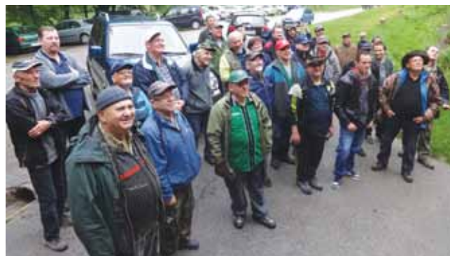
Zbor ribičev