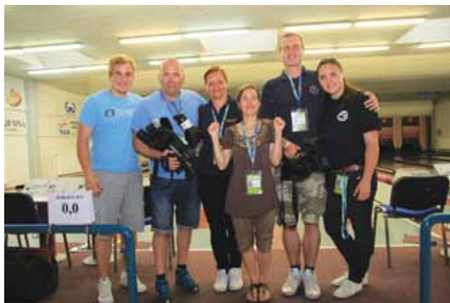
Ekipe Spletne TV

Evropsko prvenstvo gluhih v kegljanju je prineslo tudi nov mejnik v zgodovini Spletne TV, ki je bila medijski pokrovitelj prvenstva. Spletna TV je vsak dan neposredno prenašala tekmovanja s kegljišča v Celju in v enem samem dnevu, v torek, 24. junija, ko je potekalo ekipno tekmovanje, zabeležila 2383 obiskov spletne strani.