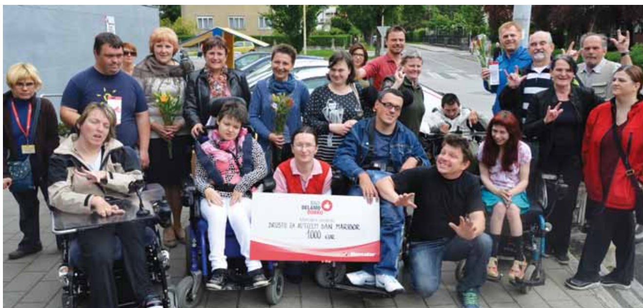
Skupinska slika vseh sodelujočih društev