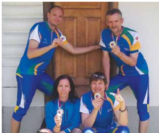
Trije prvaki in ena podprvakinja

Po zaključku tekmovanja smo se ponovno odpravili na kmetijo Domačija. To je zelo lepa kmetija, kjer so lepe hiške, veliko starega orodja in drugih stvari. Tam je bila tudi podelitev medalj. Mi smo bili zelo zadovoljni, saj smo osvojili kar tri zlate in eno srebrno.