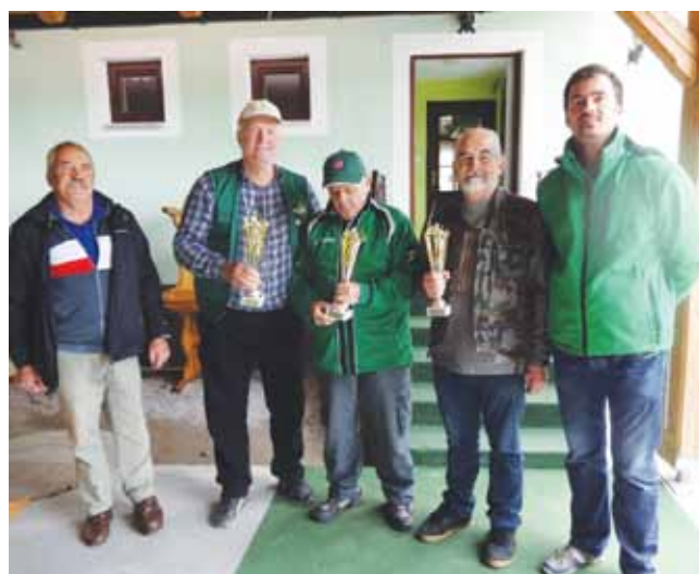
Predstavniki najboljših treh ekip