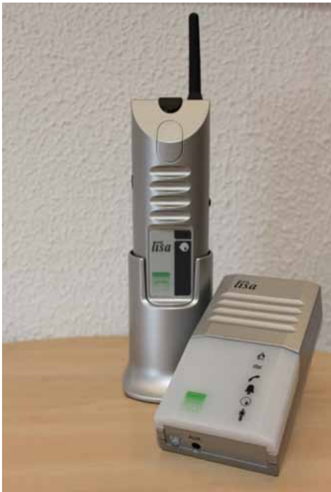
Elektronska varuška z bliskavico

Pri razgovorih s kandidati za v evropski parlament smo aktivno sodelovali. Razgovora so se na povabilo Nacionalnega sveta invalidskih organizacij Slovenije udeležili predstavniki vseh strank, med njimi tudi dva dosedanja poslanca Evropskega parlamenta. Po podatkih Evropske zveze gluhih je bilo