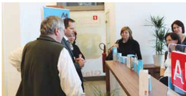
Otvoritev prostorov, foto: Adem Jahjefendić

Skratka, popoldne je obetalo polno novih izkušenj, kontaktov ter možnosti navezovanja stikov. In pa seveda opazovanja in ocenjevanja situacije, ali gre za resničen vpogled, razumevanje naglušnih oseb in prilagoditev prostora in dogodka le-tem. Lahko trdim, da sem bila kritična stranka, pozoren opazovalec in seveda tudi komentator doživetja. Sama lokacija poslovalnice je ustrezna, dostopnost je dobro urejena tako za voznike kot tudi za uporabnike mestnega prometa. Pa vendar me je ob vstopu v stavbo zmotila obilica steklenih in jeklenih površin v avli. Trdih površin, od katerih se zvok odbija ostro in moteče. Pogovor, vsaj zame, je bil v tem prostoru otežen. Direktor podjetja je prijazno razkazal ter predstavil poslovalnico ter posebej poudaril, da je del prostora opremljen tudi z indukcijsko zanko. Prostor je sicer zvokovno deloval topleje, zmotili pa so me prav tako visoki stropi ter veliko steklenih površin v sprejemnici.