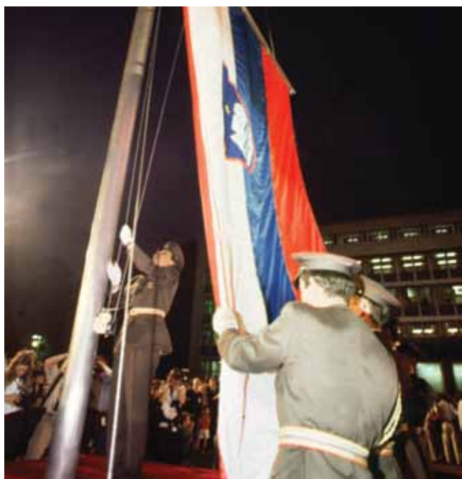
Prvič je zaplapolala slovenska zastava

Slovenski komunisti so januarja 1990 protestno zapustili 14. Kongres Zveze komunistov Jugoslavije. Marca 1990 je Slovenija razglasila gospodarsko samostojnost. Aprila 1990 so bile prve povojne demokratične volitve, na katerih je največ glasov dobila koalicija Demokratične opozicije Slovenije oz.