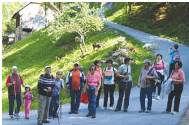
Počitek pred nadaljevanjem