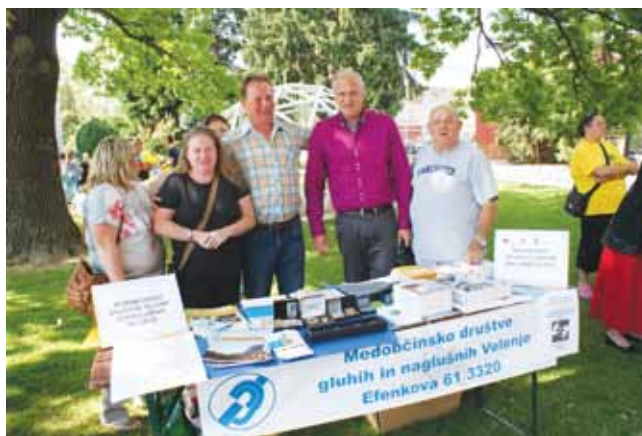
Skupinska slika z županom Bojanom Kontičem