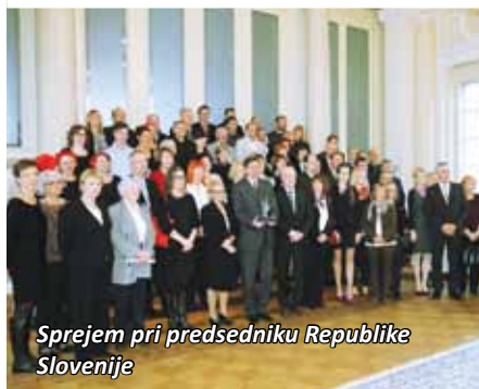
Sprejem pri predsedniku Republike Slovenije