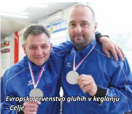
Evropsko prvenstvo gluhih v keglanju - Celje