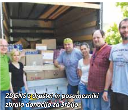
ZDGNS z društvi in posamezniki zbrala donacijo za Srbijo