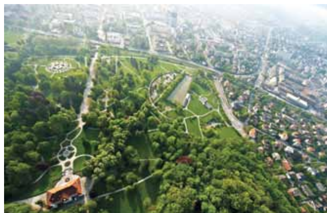
Park Tivoli iz zraka

V drugi polovici 19. stoletja se je Ljubljana postopoma uveljavila kot politično in kulturno središče Slovencev. Mesto se je širilo s priključevanjem delov sosednjih občin, in sicer Tivoli, okolica Koližeja, Vodmat, vse do dolenjske železniške proge. Priključila so se še druga območja. Ob prelomu stoletja so se množile nove pridobitve: vodovod (1890), elektrika in sodobno kanalizacijsko omrežje (1898), tramvaj (1901) ter prvi kino (1907). Veli-