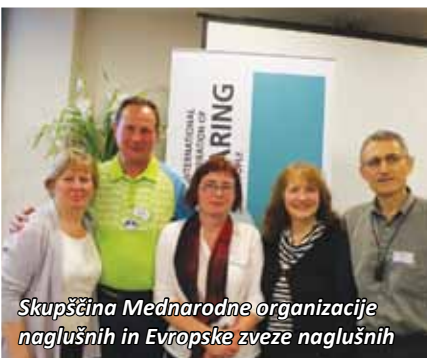
Skupščina Mednarodne organizacije naglušnih in Evropske zveze naglušnih