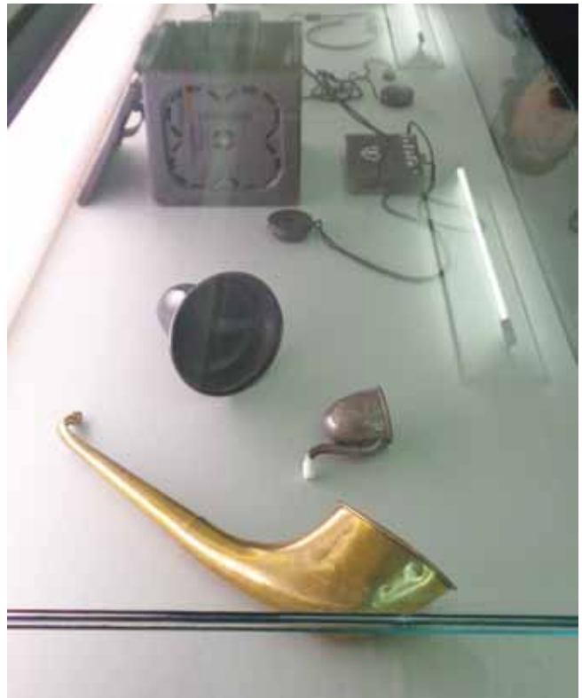
Prve oblike pripomočkov za poslušanje

Popoldan pa smo se odpeljali v mesto Gradec. Sprehodili smo se po praznično okrašenih ulicah, se povzpeli na Schloßberg ter si ogledali znamenite ledene jaslice. Pa tudi za obisk predbožičnega sejma je še ostalo nekaj časa. Podjetju Neuroth se