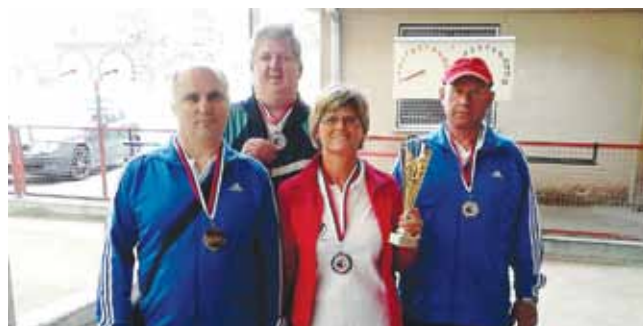
Z Brankotovo pomočjo do medalje