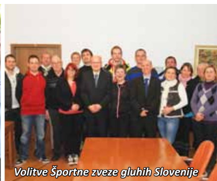
Volitve Športne zveze gluhih Slovenije