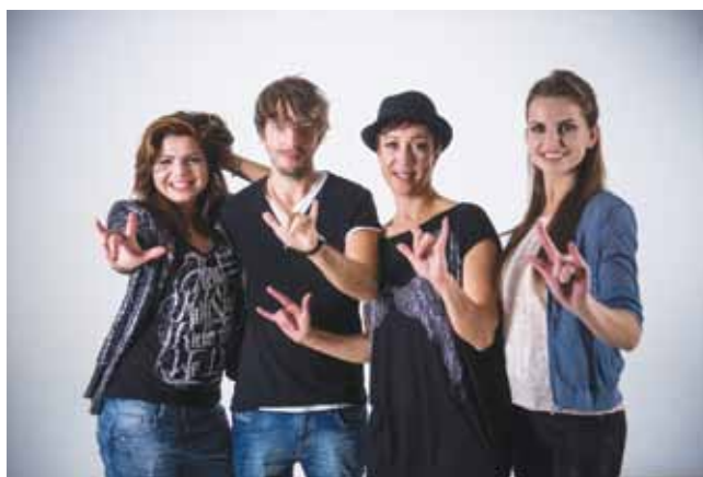
Snemanje videospota

Iz srca hvala vsem za sodelovanje in naj se pesem Visoko nad oblaki zasliši v srcih vseh, ki slišijo, in tistih, ki ne slišijo. Jezik združuje ljudi. Jezik povezuje. Naj znakovni jezik poveže vse ljudi sveta ter