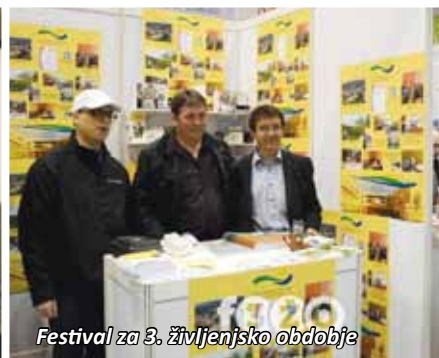
Festival za 3. življenjsko obdobje