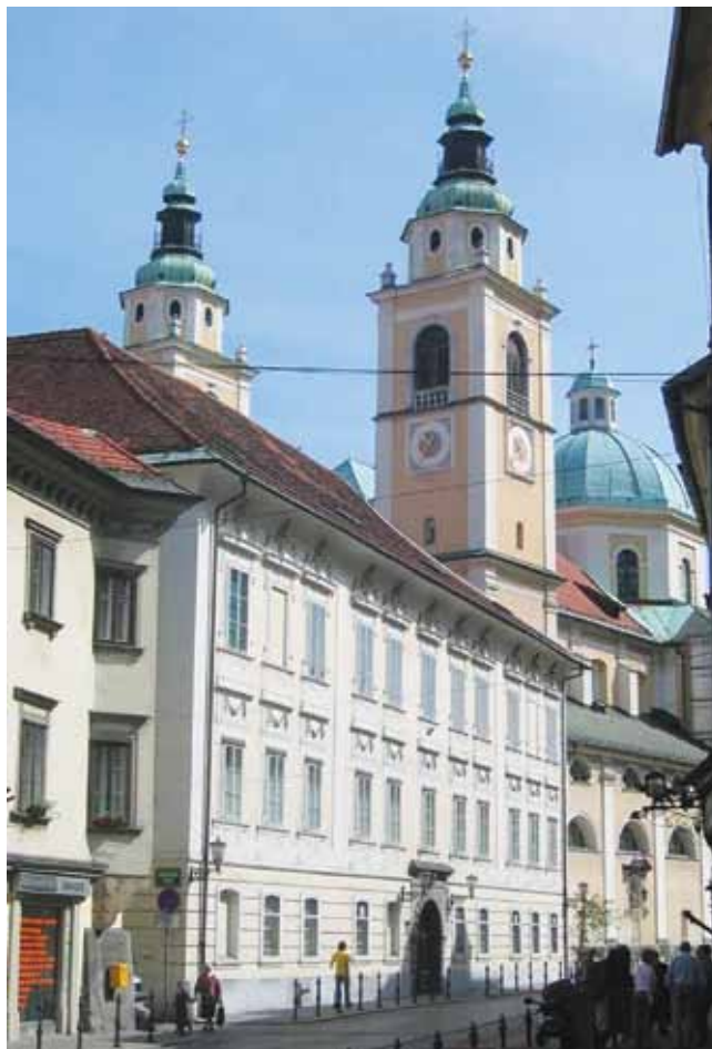
Ljubljanska stolnica in sedež ljubljanske nadškofije

Po potresu leta 1511 je bila Ljubljana prezidana. Znova so jo preurejali kasneje, zlasti v 18. stoletju v baročnem slogu, in po katastrofalnem potresu leta 1895, ki je močno poškodoval mesto. Mesto je bilo razširjeno in dozidano, tokrat z zgodovinskimi palačami. Mestna arhitektura je tako mešanica slogov.