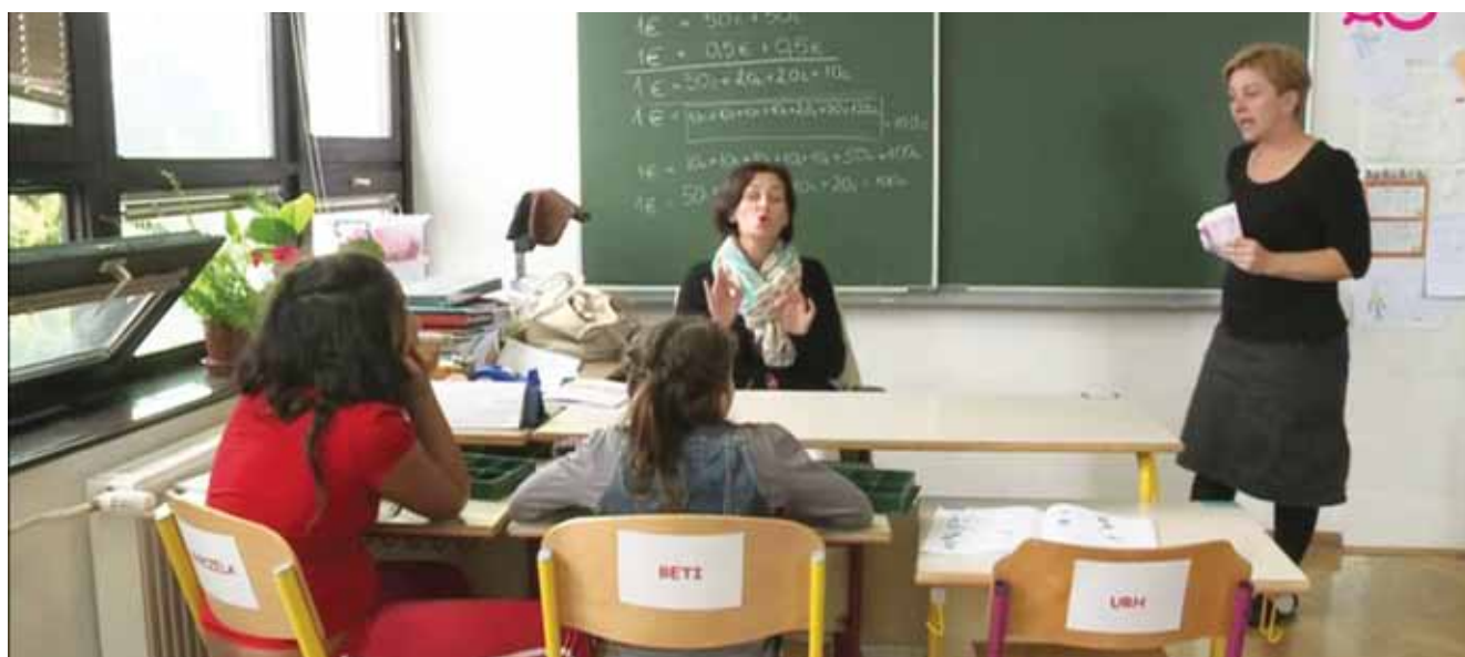
Tolmač v šolskih klopeh

Da bi delovno mesto tolmača uspeli opredeliti kot delovno mesto strokovnega delavca, je potrebna sprememba Zakona o organizaciji in financiranju