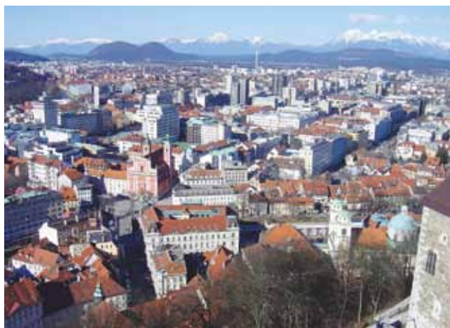
Ljubljana z gradu

V prvi polovici 19. stoletja so delno uredili nabrežja Ljubljanice ter postavili nove kamnite in železne mostove. V tistem času je v Ljubljani ustvarjal tudi pesnik France Prešeren. Leta 1849 je z Dunaja pri-