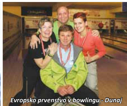
Evropsko prvenstvo v bowlingu - Dunaj

Glasilo Iz sveta tišine je tiskan medij, kjer smo v letu 2014 mesečno objavljali aktualne informacije in poročali o dogodkih s področja delovanja Zveze in društev gluhih in naglušnih po vsej Sloveniji. Objavljeni prispevki so se navezovali na življenje in delo gluhih, naglušnih, gluhoslepih in oseb s polževim vsadkom, intelektualnim sposobnostim gluhih bralcev pa smo prilagodili tudi informacije javnega značaja s področje zakonodaje, ki se nanašajo na življenje in delo oseb z okvaro sluha. V glasilu smo prav tako objavljali aktualne mednarodne dogodke iz sveta gluhih in naglušnih, kot so: skupščina Evropske in Mednarodne zveze naglušnih, ki je potekala v Izraelu, prvi mednarodni kongres oglušelih v odrasli dobi, ki je potekal na Nizozemskem, prevedli in prilagodili smo mednarodne informacije, ki so jih pripravile evropske in svetovne organizacije gluhih in naglušnih, poročali o kvalifikacijah za evropsko prvenstvo gluhih v futsalu, ki je potekalo na Madžarskem, objavili poročilo 17. kongresa Evropske športne zveze gluhih. Poročali smo tudi o uspehih naših perspektivnih gluhih in naglušnih športnikov na evropskih in