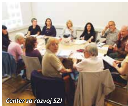
Center za razvoj SZJ