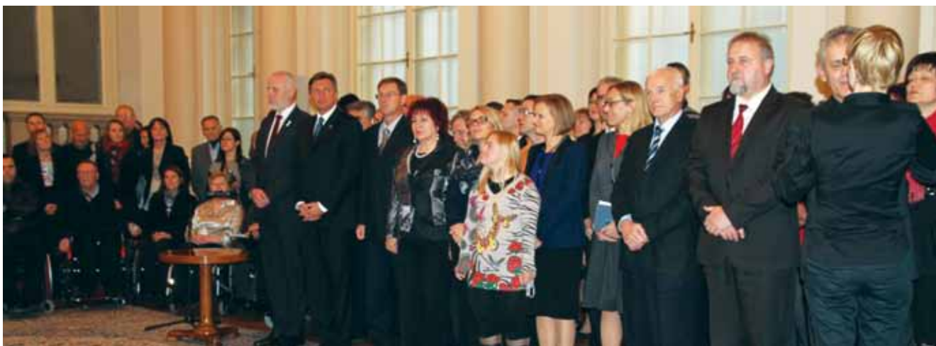
Državni vrh sprejel invalide

Udeležili smo se sprejema varuhinje človekovih pravic ob dnevu človekovih pravic in 20. obletnici varuha človekovih pravic Republike Slovenije. Tovrstni pogovori so pri reševanju skupnih zadev glede pravic invalidov ter gluhih in naglušnih neprecenljivi.