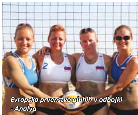
Evropsko prvenstvo gluhih v odbojki - Analya