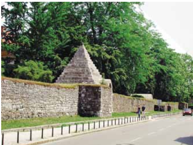
Rimsko obzidje v Ljubljani

stavljenih na kole in zabitih v dno močvirja ali jezera. Prevažali so se v čolnih, imenovanih drevaki, ki so bili izdelani iz posameznih debel. Izdelali so tudi prve vozove s kolesi. Preživljali so se z nabiranjem, lovom, ribolovom, živinorejo ter primitivnim poljedelstvom. Kasneje so med indoevropskimi ljudstvi območje današnje Ljubljane poselili Iliri, nato ilirsko-keltsko pleme Japodov. V 3. stoletju so ljubljansko kotlino poselili keltski Tavriski. Arheološke najdbe kulture žarnih grobišč na grajskem griču potrjujejo večjo naselbino na območju Ljubljane. Ljubljanska kotlina je bila pred 1. stoletjem pred našim štetjem, ko so jo zasedli Rimljani, del kraljestva Norik.