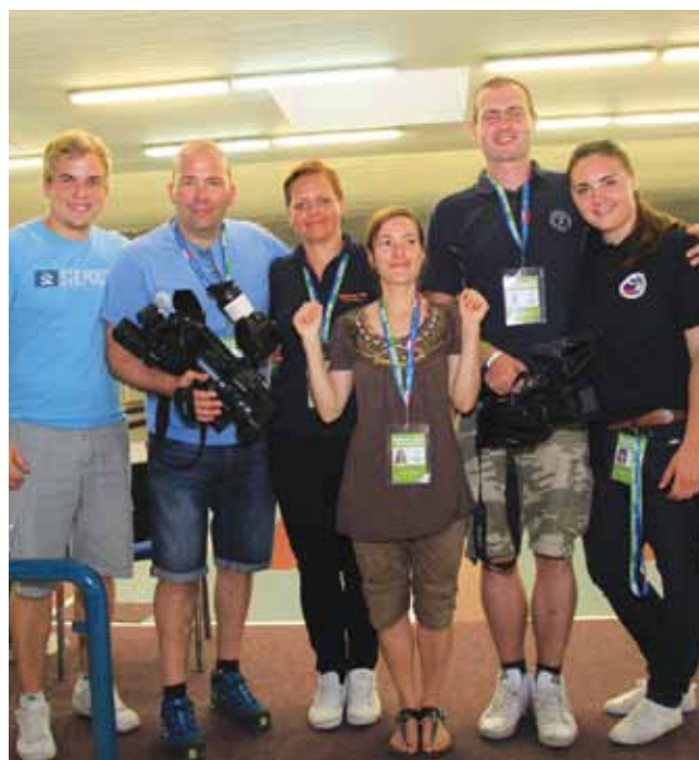
Ekipa Spletne TV