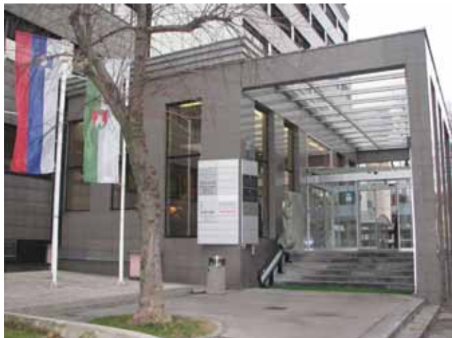
Ministrstvo za delo, družino, socialne zadeve in enake možnosti

V skladu z dogovorom s posveta o znakovnem jeziku v Državnem svetu Republike Slovenije 14. novembra 2014 smo se sestali s predstavniki ministrstva ter pregledali vse odprte probleme, ki jih imajo gluhi in naglušni otroci v procesu izobraževanja tako v posebnih kot rednih šolah. Dogovorili smo se za skupne zadeve ter se pogodili o rednih medsebojnih srečanjih. Ponovno smo poudarili, da imajo gluhi otroci pravico do izbire izobraževanja v znakovnem jeziku. Le-ta se mora odražati tako v rednih kot posebnih šolah za gluhe in naglušne. Izpostavili smo pomembno vlogo, ki jo imajo posebne šole za gluhe, ter jim posredovali izkušnje iz tujine, in sicer da je tam, kjer je močna posebna