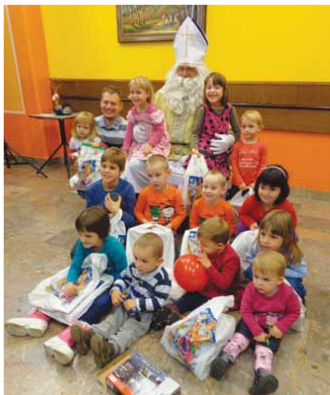
Miklavž je obdaril otroke