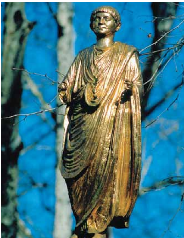
Kipec prebivalca Emone

Izvor imena Ljubljana ni pojasnjen, a obstaja več mnenj. Po eni razlagi izvira iz staroslovanskega vo-