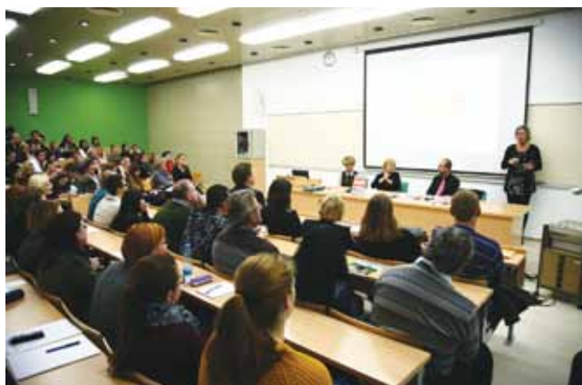
Prepolna predavalnica Pedagoške fakultete

Filozofska fakulteta v Mariboru in Center za razvoj slovenskega znakovnega jezika pri Zvezi društev gluhih in naglušnih Slovenije sta organizirala predstavitev najnovejše publikacije Zveze z gostujočim predavanjem na temo slovenski znakovni jezik. V nabito polni predavalnici Pedagoške fakultete v Mariboru je vsa strokovna javnost prisluhnila predstavitev in predavanju ter pokazala velik interes za spoznavanje znakovnega jezika. Prepričani smo, da tovrstno sodelovanje ni zadnje, ter si želimo novih projektov raziskovanja znakovnega jezika.