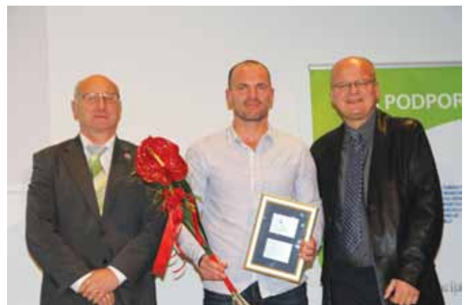
Slovo od športne kariere