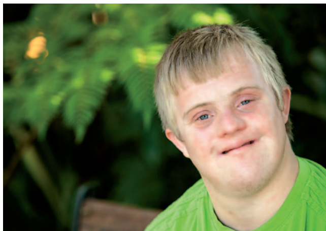
Katero čustvo se vam porodi, ko zagledate osebo z motnjo v duševnem razvoju?