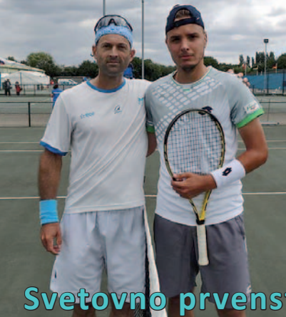
Svetovno prvenstvo gluhih v tenisu