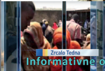
Zrcalo Tedna Informativne oddaje z znakovnim jezikom