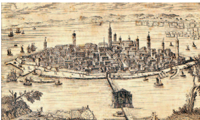
Otok Kopra 1781

Prva poselitev koprskega otoka sega v rimsko republikansko obdobje. Novejše arheološke najdbe iz 3.–1. stoletja pred našim štetjem segajo v čas, ko je bila v pisanih virih na širšem koprskem območju omenjena antična naselbina Aegida. Proti koncu rimskega cesarstva je bila na otoku večja naselbina, v poznoantičnem obdobju pa ena izmed postojank obrambnega sistema Claustra Alpium Iuliarum. V času preseljevanja narodov se je romansko in poromanjeno okoliško prebivalstvo zateklo v otoško naselje. Ko so severno Istro sredi 6. stoletja zasedli Bizantinci, so Capris dobro utrdili in ga preimenovali v Iustinopolis (po cesarju Justinu II.). Varna otoška lega ob poteh proti Gradežu, tedaj pomembnemu središču ob severni jadranski obali, je mestu omogočila nagel razcvet. V 8. stole-