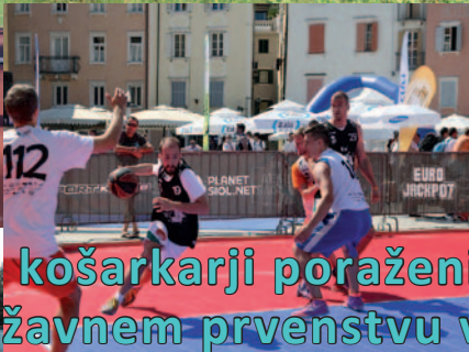
Gluhi košarkarji poraženi na državnem prvenstvu v ulični košarki