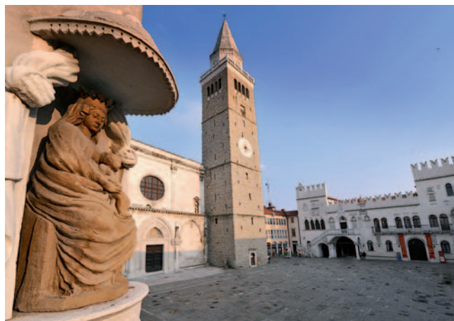
Staro mestno jedro

nitvijo prefektуре, finančne intendance, departmajskega in distriktnega sveta ter trgovskega in apelacijskega sodišča se je v mestu tudi bistveno zmanjšalo število administracije. Število mestnega prebivalstva je zdrsnilo pod 4000. Zaradi Napoleonove celinske zapore sta se drastično zmanjšala pomorski in trgovski promet. Upadla je tudi proizvodnja soli, saj so soline ostale v lasti italijanskega kraljestva.