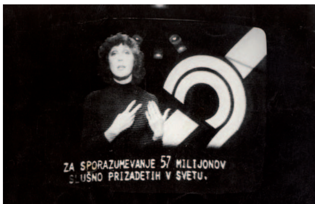
Prva oddaja Prislunimo tišini

V društvu imajo redna mesečna srečanja, ki potekajo ob sredo in soboto, strokovne ekskurzije z ogledom kulturnih in zgodovinskih spomenikov ter dediščine, novoletna srečanja, dobro so obiskane delavnice ročnih del in razna predavanja o različnih življenjskih temah. Izvajajo program usposabljanja staršev in svojcev o gluhoti in komunikaciji, pomembna pa je tudi informativna dejavnost, kjer posvečajo pomembno pozornost delu z računalniki, dostopu do interneta, Spletni TV, glasilu Iz sveta tišine in drugo. V te namene imajo urejeno računalniško sobo. Društvo je in zmeraj bo drugi dom gluhih in naglušnih in ima pomembno vlogo za svoje člane.