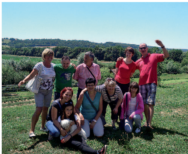
Udeleženci poučne ekskurzije

in predelavo sadja, zelenjave, žitaric in zelišč. Obdelujejo približno 16 hektarjev njivskih površin, dva hektarja sadovnjakov in dva hektarja travnikov. Vodila nas je po zeliščnem vrtu in nam predstavila znana in manj znana zelišča ter pojasnila njihov zdravilni pomen. Imajo tudi konje, saj prirejajo poletni tabor s konji, ter razne druge živali.