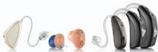
Različni slušni aparati