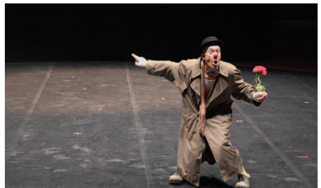
Prizor s festivala

Dve gluhi osebi sta se udeležili omenjenega festivala in aktivno sodelovali pri njenem programu. Poklicni gluhi umetniki so pokazali svoje izdelke, produkcije in kreativnosti ter si med sabo izmenjali številne dragocene izkušnje.