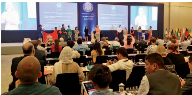
Izbor kandidata za organizacijo naslednje skupščine Svetovne zveze gluhih

nja omogočajo globlji vpogled in znanje. Skupnost gluhih je zelo heterogena in raznolika, zato je treba spoštovati raznolikost ne samo med gluhihimi in slišječimi, temveč tudi znotraj same skupnosti gluhih. Največja vrednota je vsekakor medsebojno spoštovanje in sobivanje.