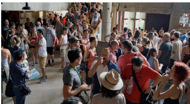
Bilo je veliko zanimanja in veliko obiskovalcev

Na festivalu se srečujejo gluhi z vsega sveta. Pomembno je ozaveščanje javnosti in spoznavanje raznolikosti znakovnih jezikov, ki jih govorijo v posameznih državah.