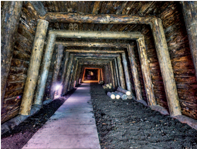
Rudniški rovi nekoč

predvsem zaradi tega, ker so delali brez vsake zaščite. Delali so že 14-letni mladi dečki, predvsem na transportu premoga. Od začetka rudarjenja se je prevoz premoga vršil s konji, poniji, male in potrpežljive živali so gnali do onemoglosti. V jami so imeli tudi žive signalne naprave za nevarnosti, to so bile miške in podgane, ki so zaznale strah pred nevarnostjo, prehranjevale pa so se z ostanki hrane rudarjev. Vodič nam je na simboličen način prikazal rudarsko nesrečo s tresenjem poda, na katerem smo stali, in nastalo je kar nekaj nelagodja, pa smo