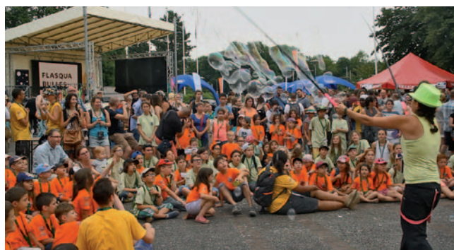
Program za otroke

Od leta 2005 naprej so na festivalu tudi razne delavnice oziroma tabori za gluhe in slišče otroke, ki obvladajo znakovni jezik (otroci gluhih staršev). Animatorji so vsi gluhi in zelo profesionalni, vsa komunikacija pa poteka v znakovnem jeziku. Delavnice so potekale res odlično, njihov namen pa je spodbujanje kulture gluhih pri mladih, spoznavanje različnih umetniških konceptov v gledališču, cirku, plesu.