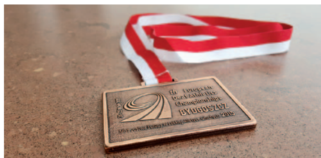
Bronasta medalja za Slovenijo

Na tem prvenstvu je osvojilo medalje 19 od 24 nastopajočih držav Evrope. Največ jih je odnesla Rusija, in sicer 48, na drugem mestu je Ukrajina z 22 medaljami in na tretjem Belorusija z osvojenimi 15 medaljami.