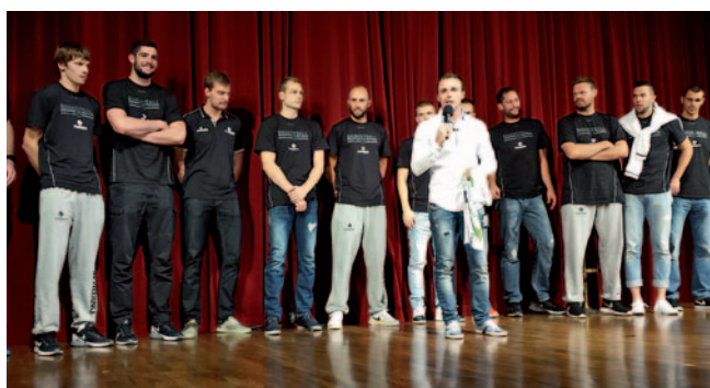
Dobrodelni ogled predstave Moška copata

Naši gluhi košarkarji so se letos udeležili dveh turnirjev državnega prvenstva v ulični košarki ter nabirali dragocene izkušnje ter utrjevali pripravljenost za tekmovanja na najvišji ravni. Želimo si, da igralci ohranjajo tekmovalno pripravljenost in da so lahko konkurenčni na najvišjih tekmovanjih. Uspeli so zabeležiti nekaj zmag, zagotovo pa se dobro sodelovanje med Športno zvezo gluhih in Košarkarsko zvezo Slovenije nadaljuje.