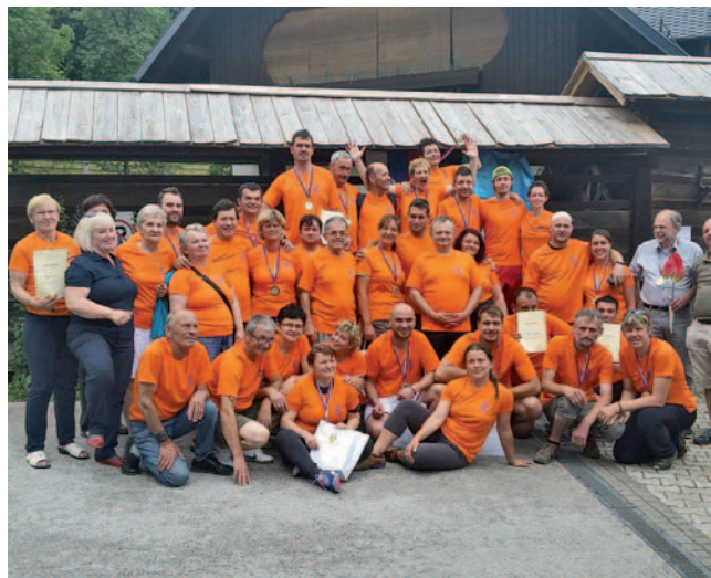
Udeleženci državnega prvenstva

lončki in napisom označili kažipot do Crngroba, saj poti do tja res ni lahko najti. Tovrstna srečanja so vedno vesela in dobrodošla in tako je bilo tudi slišati. »Prekmurci so se že pripeljali«, znani po tem, da s sabo pripeljemo še košarico dobrot.