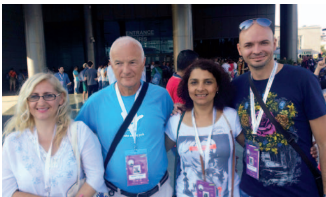
Naša delegata in predsednica Zveze gluhih in naglušnih Srbije (levo) ter delegatka s Kosova

Ob robu dogajanja okoli kongresa je bilo opravljenih kar nekaj pogovorov in sestanek na temo organizacije izobraževalne konference vseh zvez gluhih in naglušnih bivše skupne države Jugoslavije. Opravljeni so bili pogovori s predstavniki zvez Hrvaške, Srbije, Bosne in Hercegovine, Kosova,