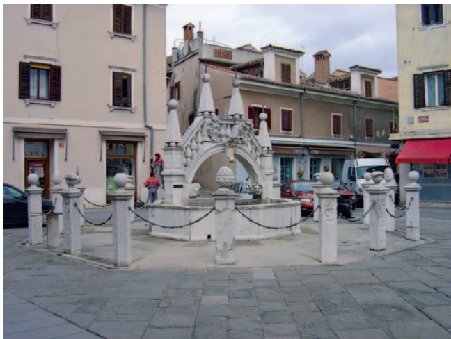
Da Pontejev vodnjak

1920 v gospodarsko življenje današnjega Koprškega primorja ni vnesla bistvenih sprememb. Koper je gospodarsko hiral, rasla je brezposelnost. Kot sedež občine in podprefektore v obdobju med obema vojnama je igral vlogo istrskega nacionalističnega središča. Po italijanski kapitulaciji ter osvoboditvi leta 1945 pa so nastali temelji za politično, družbeno in gospodarsko preobrazbo obalnega območja.