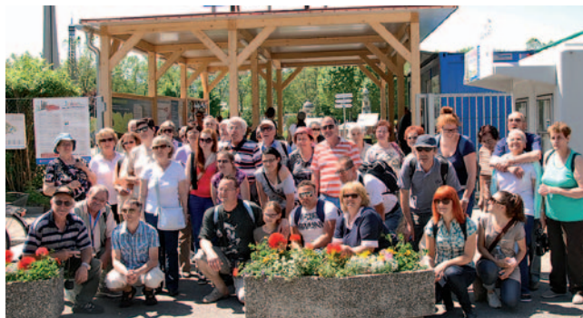
Člani društva na strokovni ekskurziji

Kulturne ustanove, ki preraščajo krajevni pomen, so bogata študijska knjižnica, Pokrajinski muzej (od leta 1911), radijska in televizijska postaja. Poleg slovenskih osnovnih in srednjih šol sta v mestu tudi italijanska osnovna šola in gimnazija. Obsežen luški kompleks, novo poslovno središče in nove primestne stanovanjske četrti (Semedela, Žuster-na, Šalara) so močno spremenili podobo mesta. Zgodovinsko mestno jedro z vrsto pomembnih kulturnih spomenikov pa je ohranilo osnovne značilnosti srednjega veka.