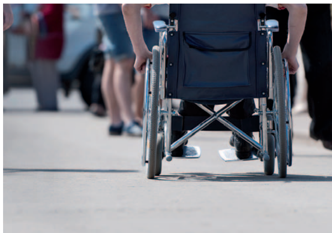
Katero čustvo se vam porodi, ko zagledate osebo na vozičku?