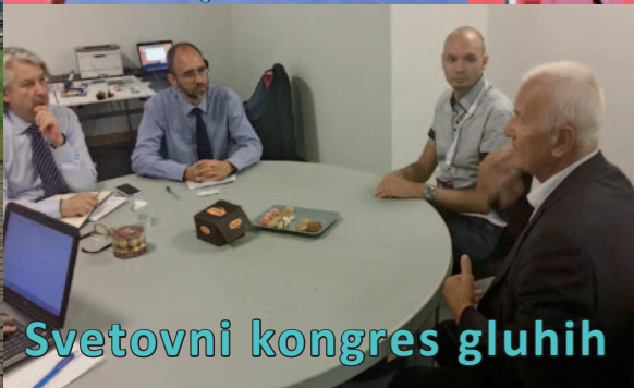
Svetovni kongres gluhih