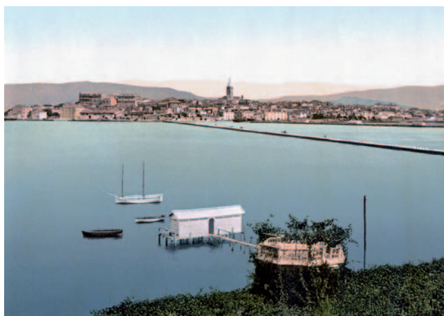
Koper okoli leta 1900

Niso pa le ugodni in slavni možje zapuščali Koper, mnogi so bili iz mesta tudi pregnani, predvsem v času, ko je inkvizicija začela preganjati pristaše luteranske doktrine. Med najbolj gorečimi reformatorji je bil koprski škof Peter Pavel Vergerij ml. (1498–1565), ki je hotel v svoji škofiji odpraviti pogoste zlorabe številnega klera in bratovščin, obenem pa zelo razširjeno vraževerje med prebivalstvom. Nakopal si je njihovo sovraštvo, zato so ga kot heterika ovadili inkviziciji; ta je proti Vergeriju sprožila proces. Vergerij se ni več čutil varnega, pa se je prek Švice umaknil v Nemčijo in se tam posvetil reformaciji. Tamkajšnjemu vojvodi Krištofu se je uдинjal za svetovalca in slovenskemu protestantu Primožu Trubarju pomagal pri tiskanju prvih slovenskih knjig, kajti že kot koprski škof je čutil potrebo po slovenskem bogoslužju v pridigah, ki so jih v Kopru opravljali frančiškani tretjeredniki v gregoritskem samostanu.