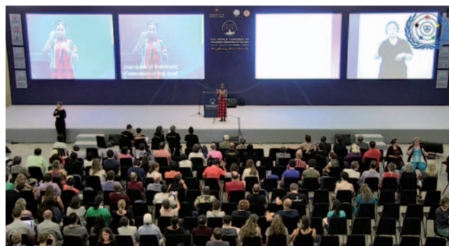
Kongres Svetovne zveze gluhih

Javni sklad RS za razvoj kadrov in štipendiranje za šolsko leto 2015/2016 je razpisal štipendije za de-