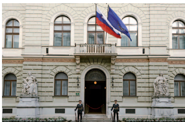
Urad predsednika Republike Slovenije