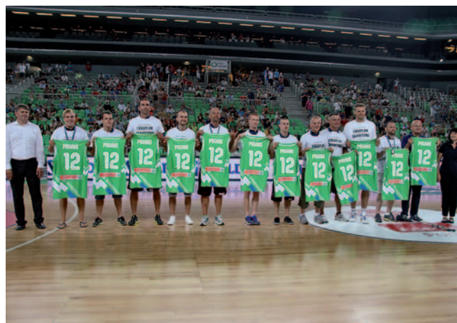
Predstavitve reprezentance v Stožicah

Košarkarska zveza Slovenije je avgusta 2012 javnosti predstavila slovensko košarkarsko reprezentanco, ki je na desetem evropskem prvenstvu gluhih