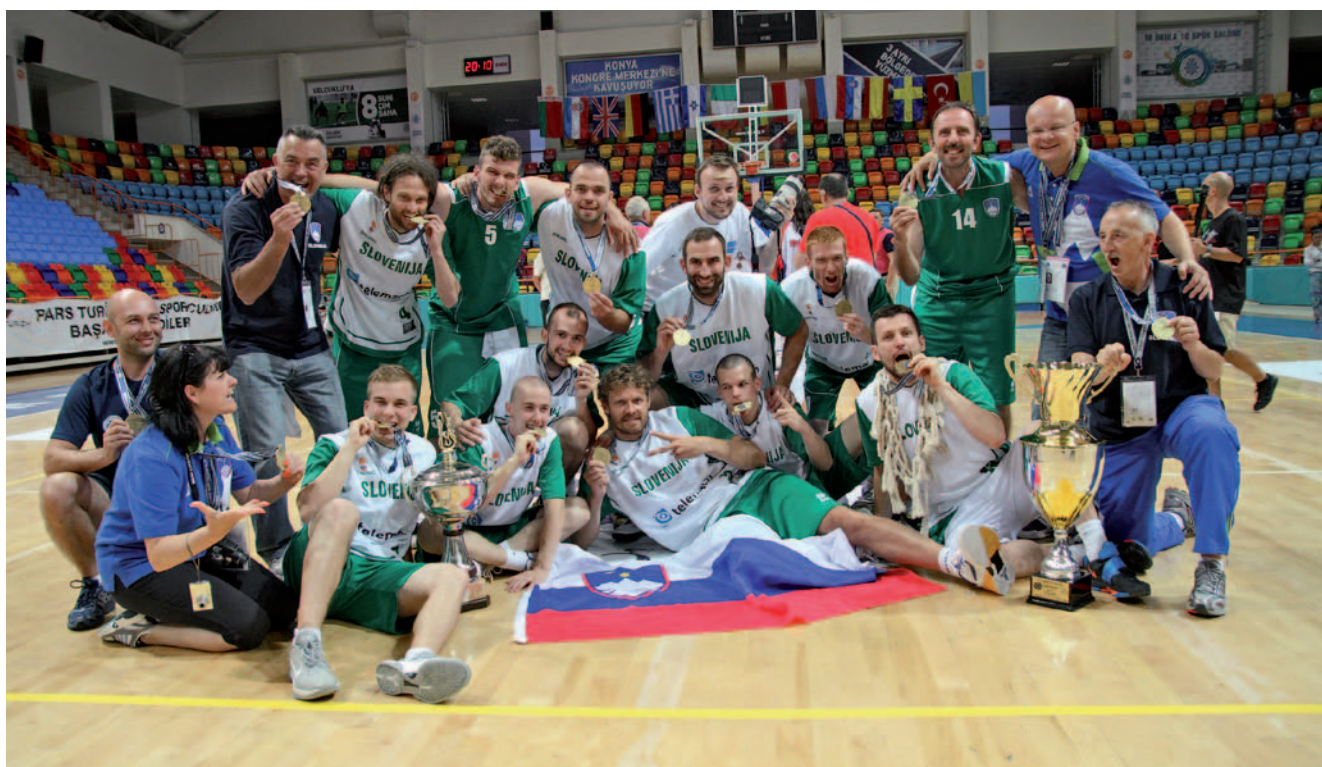
Slavje po osvojenem naslovu evropskega prvaka leta 2012