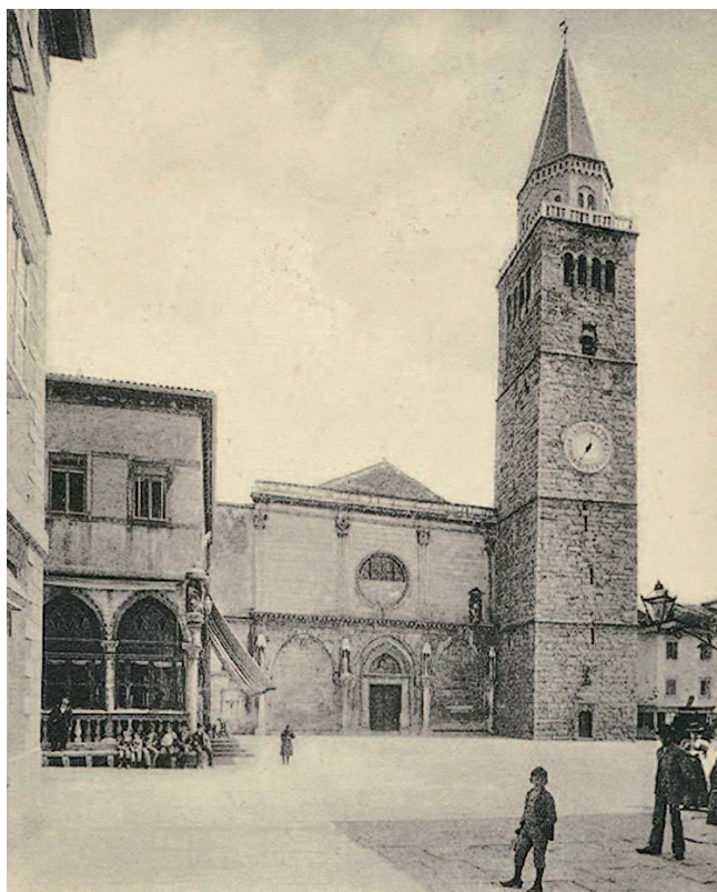
Koper leta 1902

S prenosom političnega in upravnega sedeža in z dograditvijo železnice Dunaj – Trst (1857) je postal Trst glavno trgovsko, pomorsko in postopno tudi industrijsko središče avstro-ogrske monarhije in Koper je dokončno izgubil vlogo političnega, gospodarskega in kulturnega središča Istre. Z uki-