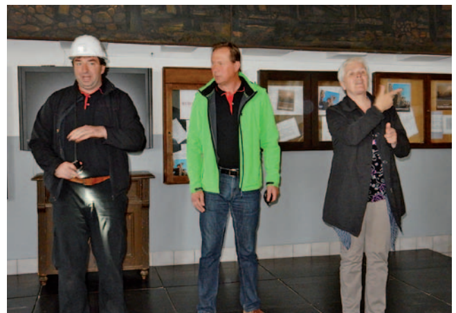
Predstavitve delovanja rudnika nekoč in danes

V nadaljevanju muzej prikazuje razmere in pogoje dela rudarjev na začetku rudarjenja. Za današnje razmere je bilo to kruto, izčrpavajoče in nevarno,