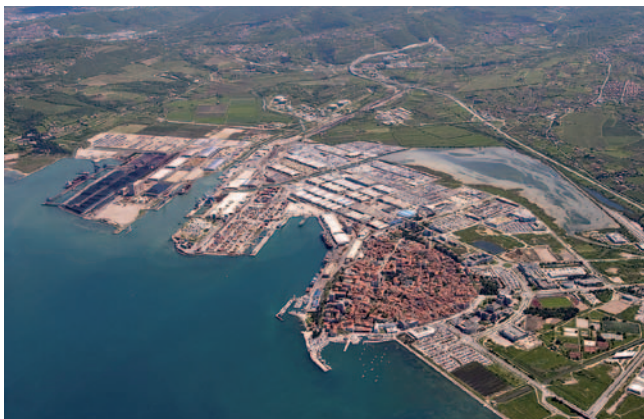
Koper iz zraka

Koper je šesto največje mesto v Sloveniji in s 23.726 prebivalci največje obalno mesto. Mesto ima dva uradna jezika, slovenščine in italijanščino. Ob njem je mednarodno pristanišče Luka Koper.