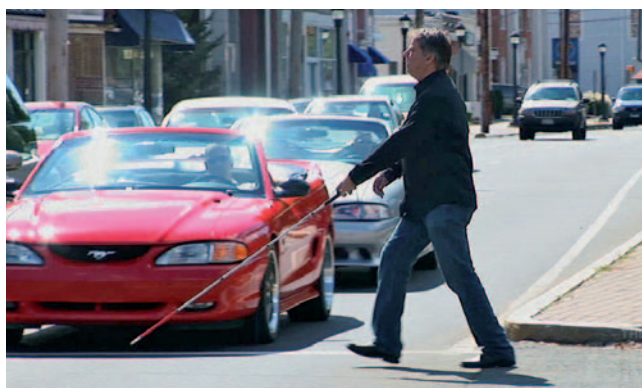
Se tudi vam porodijo takšni občutki?