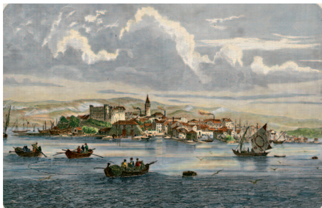
Koper leta 1867

Ekonomski razcvet in naraščanje prebivalstva v 16. stoletju je povzročila rast samega mesta prek naravnih meja otoka. Z intenzivnim nasipavanjem so bile morju iztrgane nove površine, kot nam to nazorno kažejo arheološka izkopavanja zadnjih let na območju nekdanjih obodnih trgov. Na obsežnih površinah je zrasel najmanjši urbani del srednjeveškega Kopra, ki je bil v celoti zavarovan z obzidnim pasom in obrambnimi stolpi.