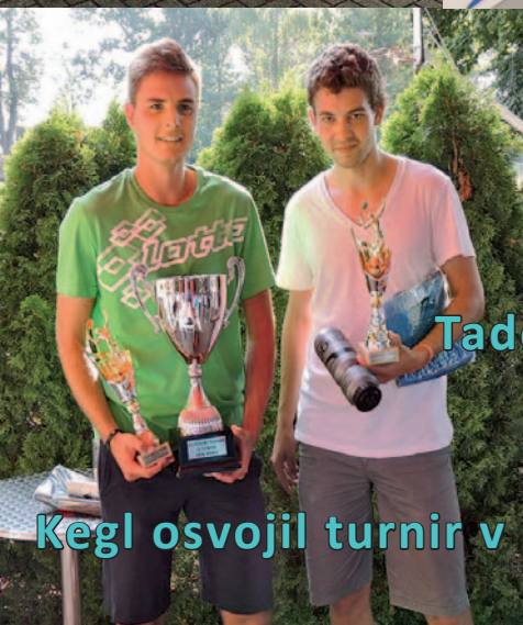
Kegl osvojil turnir v Brnu