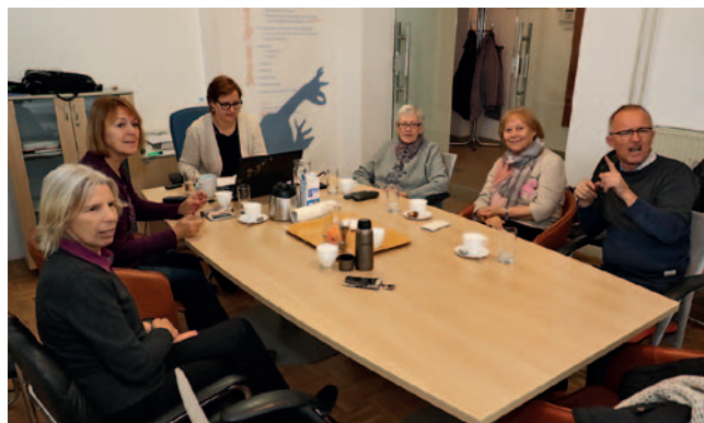
Delovna skupina za razvoj SZJ

V sodelovanju z vsemi relevantnimi partnerji v Republiki Sloveniji gradimo zgodbo umeščanja Slovenskega znakovnega jezika v skupni evropski jezikovni okvir (SEJO). Center za razvoj SZJ bo prvič postavil okvire preverjanja znanja in postavil standarde, ki bodo v dogovoru s pristojnimi državnimi institucijami tudi relevantni in primerljivi. S tem bomo dvignili raven izvajanja tečajev in posredno izboljšali kakovost vsebin in stroke.