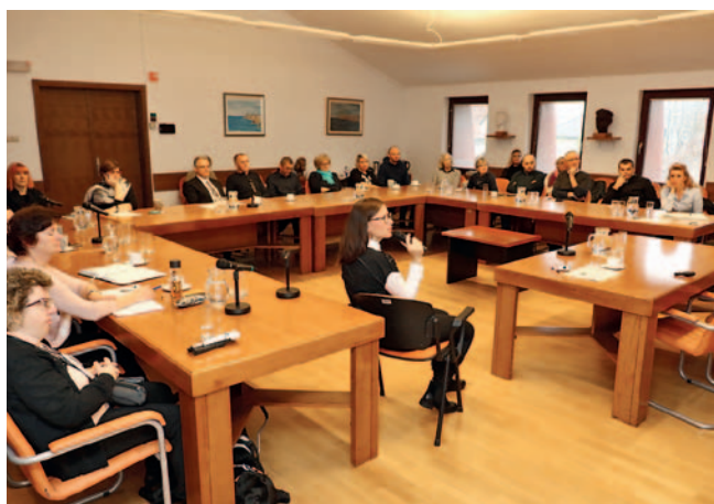
Udeleženci posveta o osebni asistenci

Na zvezi smo organizirali strokovni posvet, na katerem smo odprli temo osebne asistencije. Strokovnjakinja na tem področju nas je seznanila s tem, kako v drugih organizacijah izvajajo osebno asistenco, in se ob tem tudi pogovorili o odprtih vprašanjih s tega področja.