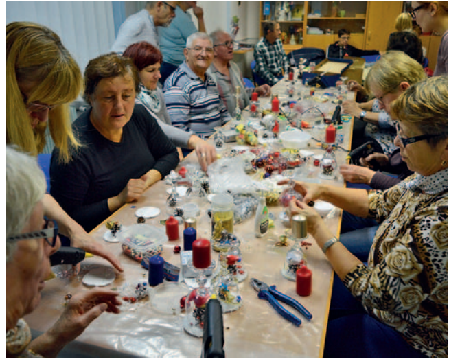
Člani med ustvarjanjem