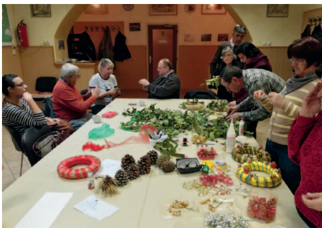
Ustvarjalnost na vrhuncu

Za izdelovanje adventnih venčkov smo nabrali kar nekaj materiala, vse od slamnatih venčkov, pozlačenih in posrebrenih trakov, perlic in bleščic do storžev in vejic bršljana ter lovorja. Sestavin za najlepše venčke res ni manjkalo!