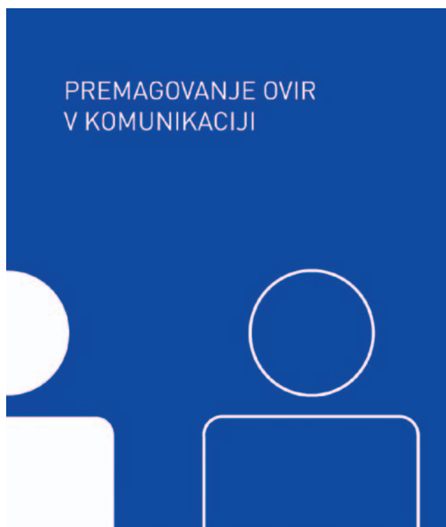
Brošura Premagovanje ovir v komunikaciji

Zveza društev gluhih in naglušnih Slovenije je aktivno sodelovala pri izdaji brošure, ki jo je izdala založba Beletrina ob mednarodnem dnevu invalidov. Brošura je dodaten mozaik pri ozaveščanju družbe o posebnostih pri komunikaciji z invalidi, med katerimi so tudi vsi naši uporabniki.