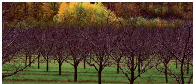
Sadno drevje v jesenskem času