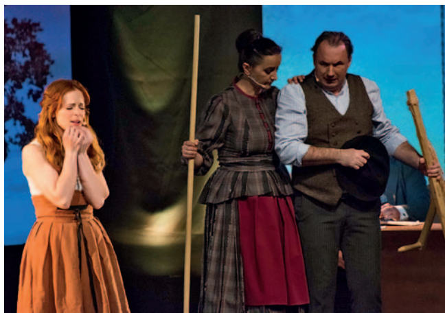
Muzikal Cvetje v jeseni

V Cankarjevem domu v Ljubljani so izvedli že 150. ponovitev muzikala Cvetje v jeseni. Producenti in izvajalci so se močno potrudili, da to slovensko zgodbo približajo čim večjemu številu čim bolj raznovrstnih gledalcev. Pripravili so posebno predstavo za gluhe in naglušne, saj so zagotovili tolmača in nadnapise.