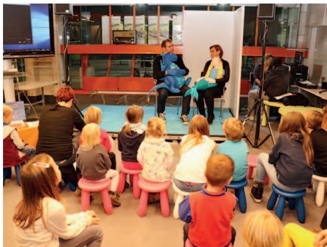
Predstava v znakovnem jeziku Zmajček in morska deklica

Zveza društev gluhih in naglušnih Slovenije vsako leto sodeluje na knjižnem sejmu, na katerem predstavimo izdajo pravljic v SZJ, tokrat pa smo sodelovali tudi s predstavo v znakovnem jeziku Zmajček in morska deklica ter s kratko predstavitvijo področja dela gluhih, naglušnih in gluhoslepih. Predstavili smo tudi videospot Dan ljubezni in za vse predstavitve prejeli številne čestitke ter pritegnili veliko pozornosti.