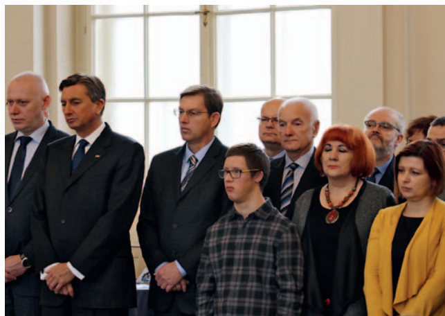
Sprejem v predsedniški palači ob mednarodnem dnevu invalidov

Ob mednarodnem dnevu invalidov so predsedniki sprejeli vse predstavnike invalidskih organizacij. Predsednik Nacionalnega sveta invalidskih organizacij Slovenije (NSIOS) je poudaril ključne izzive in nakazal ustrezne rešitve za dvig identitete invalidov.