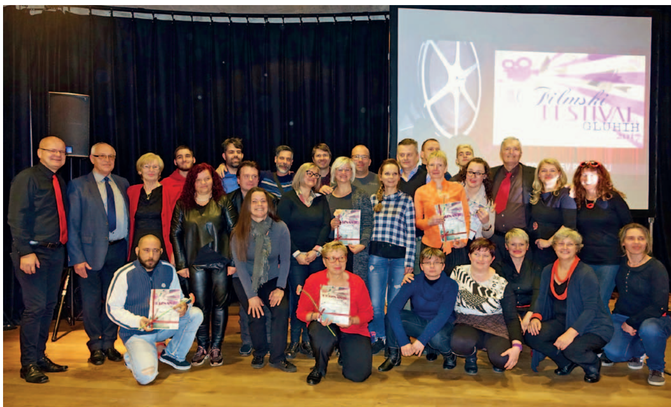
Ustvarjalci filmov in organizatorji festivala