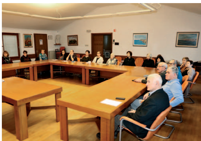
Prvi predpripravljalni sestanek delovne skupine projekta

Center za razvoj slovenskega znakovnega jezika pri Zvezi društev gluhih in naglušnih Slovenije (ZDGNS) nadaljuje uspešno delo in rezultati so vidni tudi že na ministrstvih. Ministrstvo za kulturo je izbralo projekt ZDGNS za raziskovanje in izdajo slovnice