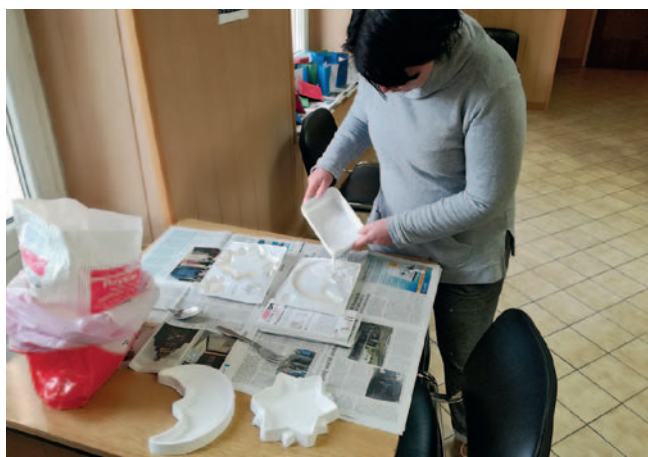
Izdelovanje keramičnih lunic in zvezdic

Keramiko najprej kupiš v prahu. Nato jo zelo dobro zmešaš z vodo in previdno zliješ v poseben plastičen kalup. Počakaš dan, dva in izdelek je suh in pripravljen za nadaljnjo obdelavo.