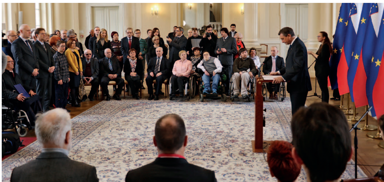
Govor predsednika Pahorja na tradicionalnem sprejemu za predstavnike invalidskih organizacij ob mednarodnem dnevu invalidov