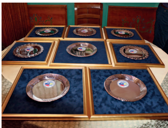
Priznanja za športnike in njihove trenerje

Anja se je odpravila na snežni trening v Italijo, v njenem imenu pa je veliko plaketo SZGS prevzela njena mati Sonja Drev, ki ves čas bdi nad hčerino tekmovalno kariero.