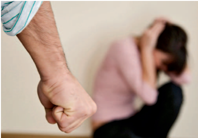
Nasilje ni le fizično, nasilna je lahko tudi komunikacija.

uporabnikov je zastavil zelo dobro vprašanje, in sicer: »Ali je vsaka jeza v pogovoru nasilje?« Seveda ne! Vedeti moramo, da konflikti niso nasilje. Spori se dogajajo med vsemi ljudmi in jih je vsak dan vse več. Dve osebi nimata skladne želje. To ni nič nevarnega, konflikt je soočanje različnih želja. O tem se pogovarjamo in konflikte rešujemo. Težava nastane, ko želimo, da spor rešimo tako, kot mi hočemo, in ne najdemo srednje poti. Problem nastane, če pride do vpitja in ne reševanja spora, temu pa sledi nasilje. Konflikt tako preraste v nasilje. Jeza pa je zelo koristno čustvo in pomeni mejo: NE DOVOLIM! Zelo pomembno je, da se znamo primerno izraziti. Za sproščanje jeze in pomiritev nam pomaga telesna aktivnost – otroci to spontano delajo. Jeza zahteva zelo veliko aktivnosti, zato ljudje tolčejo po mizah, razbijajo ipd., ker želijo pokazati, kako velika je njihova jeza. Moramo najti način, kako to jezo sprostiti, ne da bi potem koga poškodovali. Če tega načina ne najdemo, jezo samo poglobimo; pride do izbruha, zato je pomembno, da jezo telesno sprostimo in je ne poglobimo. In seveda je ključnega pomena, da se naučimo stopiti korak nazaj. Vedno je boljše imeti več tolerance, iskati kompromise, se znati prilagajati in ne prisiljevati ljudi – temveč sprejeti, kar govorijo drugi. Treba je znati kdaj tudi reči: »PA KAJ!« in čutiti, da kaj za nas ni pomembno, ter nečemu ne prepisovati velikega pomena. Učiti se moramo zmanjševati lastno intenziteto, samega sebe.