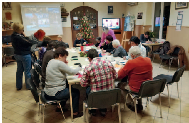
Delamo, delamo ...

ve smo najprej izrezali voščilnice zelene velikosti. Nato smo jih še prepognili in papir je bil pripravljen za risbo.