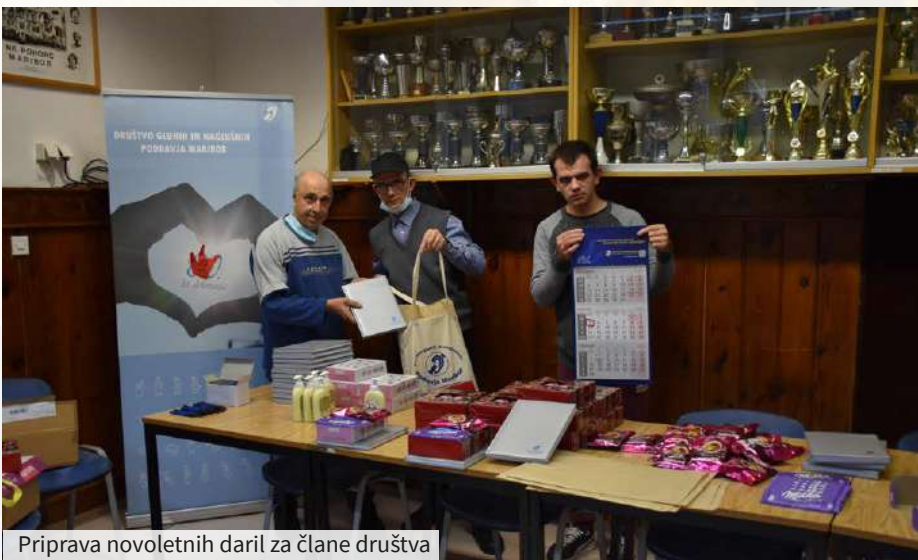
Priloga novoletnih daril za člane društva

Ob koncu leta smo s sodelavci in z vodstvom društva pripravili darila za otroke in za člane. Zahvaljujemo se predsednici, sekretarju in zaposlenim, da so poskrbeli zanje, saj smo z njimi razveselili otroke in člane, ki v težkem koronskem času pogrešajo osebni stik in družbo. ●