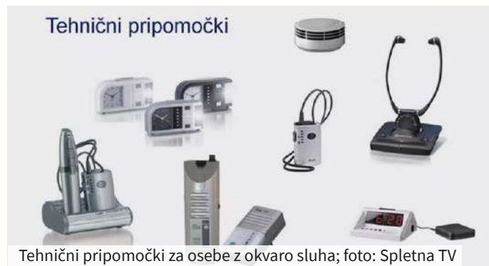
Tehnični pripomočki za osebe z okvaro sluha; foto: Spletna TV

Opozarjali smo, da če zaznamo poslabšanje sluha, moramo vzrok zanj nemudoma preveriti pri specialistu. Tako ostanemo na pravi poti za ohranitev kakovosti in načina življenja. Splošen nasvet je, da slušnih pripomočkov ne kupujemo na spletu, temveč izkoristimo zdravstveno zavarovanje. Tako bomo zagotovo dobili kakovosten slušni aparat. Naslednji korak je spoznavanje s tehničnimi pripomočki, ki so ključni za lažje življenje z izgubo sluha. Ministrstvo