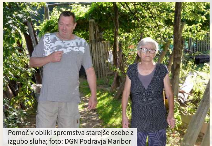
Pomoč v obliki spremljave starejše osebe z izgubo sluha; foto: DGN Podravja Maribor