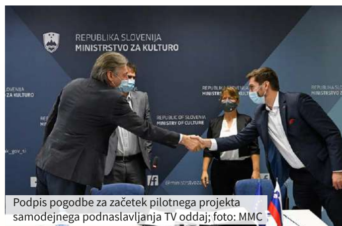
Podpis pogodbe za začetek pilotnega projekta samodejnega podnaslavljanja TV oddaj

Julija lani smo obeležili 90. obletnico organizirane delovanja gluhih in naglušnih na Slovenskem. Gluhi so se leta 1931 združili v takratni Dravski banovini, danes pa je Zveza društev gluhih in naglušnih Slovenije reprezentativna invalidska organizacija za gluhe, naglušne, osebe s polževim vsadkom ter gluhoslepe. Združuje trinajst društev in ima 5.550 članov. Med njenimi najpomembnejšimi dosežki so Inštitut za slovenski znakovni jezik, spletni slovar znakovnega jezika, videoslovnica znakovnega jezika, vpis znakovnega jezika v ustavo, Spletna TV, oddaja Prisluhnilimo tišini, komunikacijski dodatek, tehnični pripomočki, RehaCenter Sluh in Trgovina Sluh.