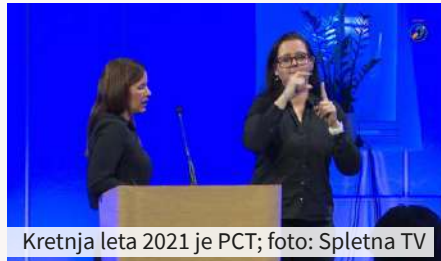
Kretnja leta 2021 je PCT

zive, s katerimi se soočajo osebe z izgubo sluha, ter delo društev gluhih in naglušnih na lokalnem nivoju za medsebojno sodelovanje in povezovanje. ●