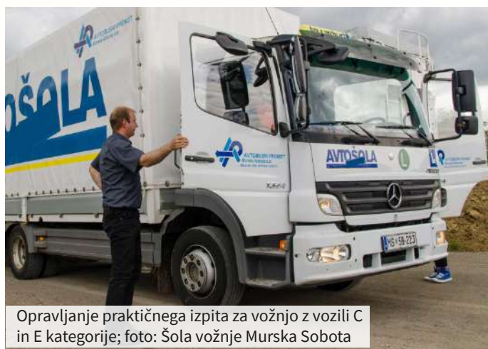
Opravljanje praktičnega izpita za vožnjo z vozili C in E kategorije

Glede na pregled ureditev v drugih državah ugotavljamo, da je to področje v Republiki Sloveniji za zdaj primerljivo urejeno. V primeru hujše okvare sluha je mogoča izdaja spričevala o zmožnosti za vožnjo motornih vozil druge skupine, če v konkretnem primeru specialist medicine dela, prometa in športa ter specialist otorinolaringolog ocenita, da je okvara ustrezno nadomeščena.