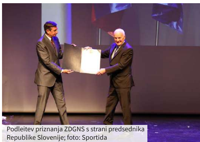
Podleitev priznanja ZDGNS s strani predsednika Republike Slovenije

V zgodovini oseb z izgubo sluha bo leto 2021 zapi- sano z zlatimi črkami, saj sta bila slovenski znakovni jezik in jezik gluhoslepih vpisana v ustavo. Zgodo- vinsko gledano je to verjetno eden največjih in naj- bolj pomembnih dosežkov Zveze društev gluhih in naglušnih Slovenije.