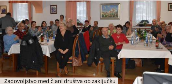
Zadovoljstvo med člani društva ob zaključku leta

Sredi decembra smo se člani Društva gluhih in naglušnih Podravja Maribor udeležili novoletnega srečanja na turistični kmetiji Černe v Razvanju, ki je bilo kljub epidemiji novega koronavirusa dobro obiskano. Udeležilo se ga je več kot osemdeset članov, gostov in otrok.