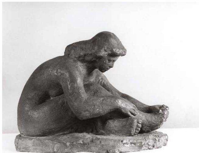
Ivan Štrekelj, Sedeča

Kipar Ivan Štrekelj (Glince pri Ljubljani, 23. september 1916 – Ljubljana, 10. junij 1975) je bil izrazit figuralik, predvsem je upodabljal dekliške, redkeje moške figure. Ustvarjal je v kamnu, žgani glini, mavcu in bronu.