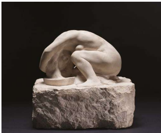
Ivan Štrekelj, Dekle pri toaleti (1957)