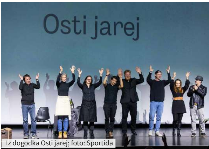
Iz dogodka Osti jarej

Vrhunec leta 2021 je bil zagotovo kulturni dogodek Osti jarej, ki po prepričanju nekaterih pomeni ostani mlad. Ogledali smo si igro Decibel-ga, v kateri so prvič združili moči slišči komiki in gluhi igralci. Nepredstavljivo je postalo možno, saj so se slišči naučili znakovnega jezika in z njim ustvarili predstavo, dostopno tako gluhim kot sliščim. Sedemdeset minut igre v znakovnem jeziku je svojevrsten pojav in vrhunski dosežek. Predstavo si bo v prihodnje še možno ogledati.