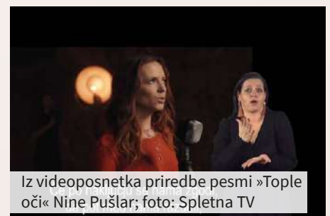
Iz videoposnetka priredbe pesmi »Tople oči« Nine Pušlar

Zveza društev gluhih in naglušnih Slovenije strokovno podpira Filmoteko, ki s podnapisi opremlja številne slovenske filme. ●