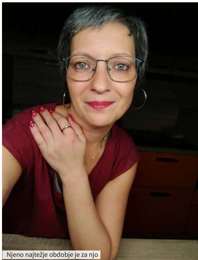
Njeno najtežje obdobje je za njo

menila, da sem vsem za zgled ter da me občudujejo, kako močna sem. Hvaležna sem, da sem spoznala, zakaj živim in kako živeti vsak trenutek. Hvaležnost izražam vsak dan.