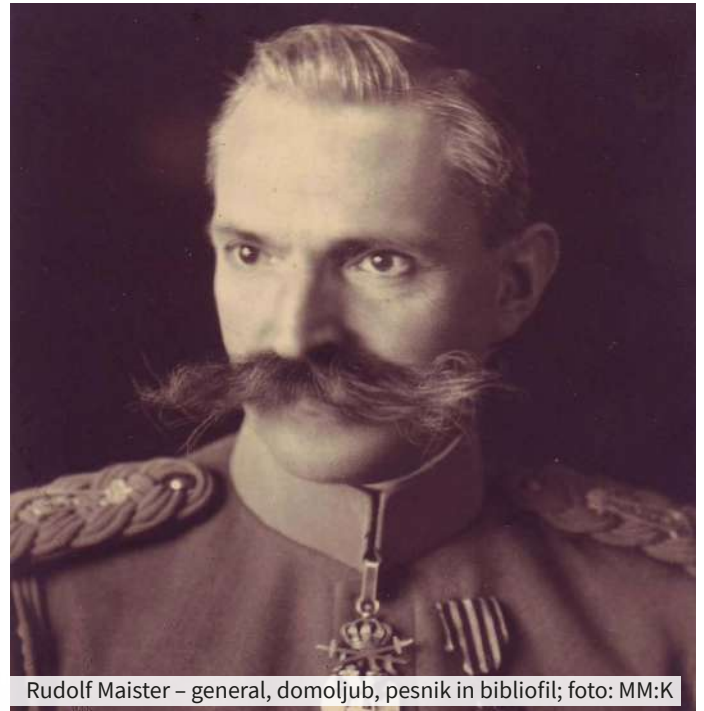
Rudolf Maister – general, domoljub, pesnik in bibliofil

Narodni svet mu je podelil naziv general, novembra 1918 pa so ustanovili mariborski pehotni polk. V nekaj tednih je Maister zbral prvo slovensko vojsko s