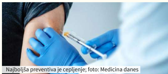
Najboljša preventiva je cepljenje

Cepiva, ki smo jih začeli uporabljati konec leta 2021, so učinkovita za osnovno verzijo novega koronavirusa. Ko se virusi prilagajajo in spreminjajo, pa učinkovitost proti posameznim različicam pada, zato za omikron potrebujemo tri odmerke cepiva.