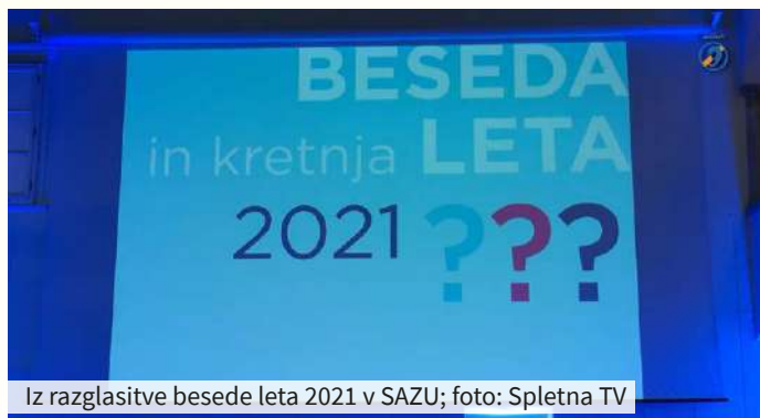
Iz razglasitve besede leta 2021 v SAZU

Leto 2021 bo v zgodovini zapisa- no kot leto, ko je svetovno popula- cijo prizadel novi koronavirus. Zato ne preseneča, da so ljudje pri glasov- vanju za kretnjo leta največ glasov namenili kraticam PCT, prebolel, cepljen in testiran, ki so bile najpogosteje uporabljene besede, pred- vsem pa je njihov pomen zaznamoval javno življenje.