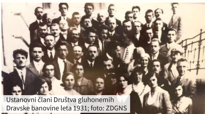
Ustanovni člani Društva gluhtonemih Dravske banovine leta 1931

Pripravili smo štirideset oddaj Prisluhnilimo tišini, ki so bile na sporedu vsako soboto na prvem programu Televizije Slovenija. Oddaje prinašajo nove zgodbe iz življenja oseb z izgubo sluha in drugih skupin invalidov ter so deležne vedno večje pozornosti gledalcev, ki si jih z zanimanjem ogledajo. To nas motivira za nadaljnje delo.