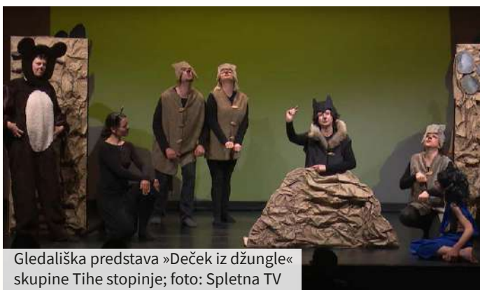
Gledališka predstava »Deček iz džungle« skupine Tihe stopinje; foto: Spletna TV

Ogledali smo si tudi gledališki predstavi režiserke Lade Orešnik, ki je v letu 2021 s skupino Tihe stopinje.