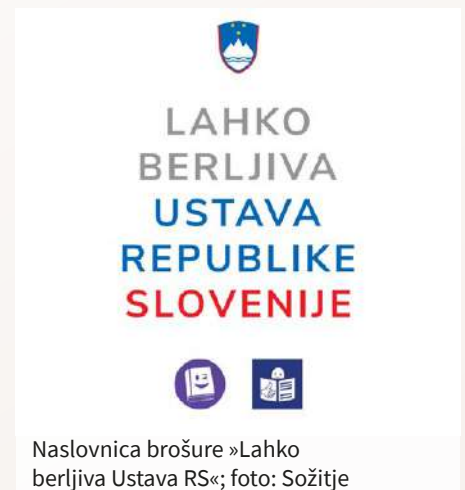
Naslovnica brošure »Lahko berljiva Ustava RS«

Zveza društev gluhih in naglušnih Slovenije je Ministrstvu za kulturo v roku in z ustreznimi dokazili poslala poročilo o realizaciji projektov. Hvala strokovnim sodelavcem za uspešno realizacijo. ●