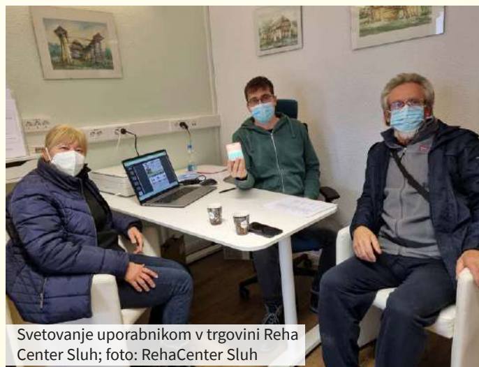
Svetovanje uporabnikom v trgovini Reha Center Sluh