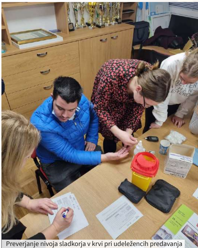
Preverjanje nivoja sladkorja v krvi pri udeležencih predavanja

Sladkorna bolezen, znana tudi kot diabetes, je skupina presnovnih motenj glukoze, za katero je