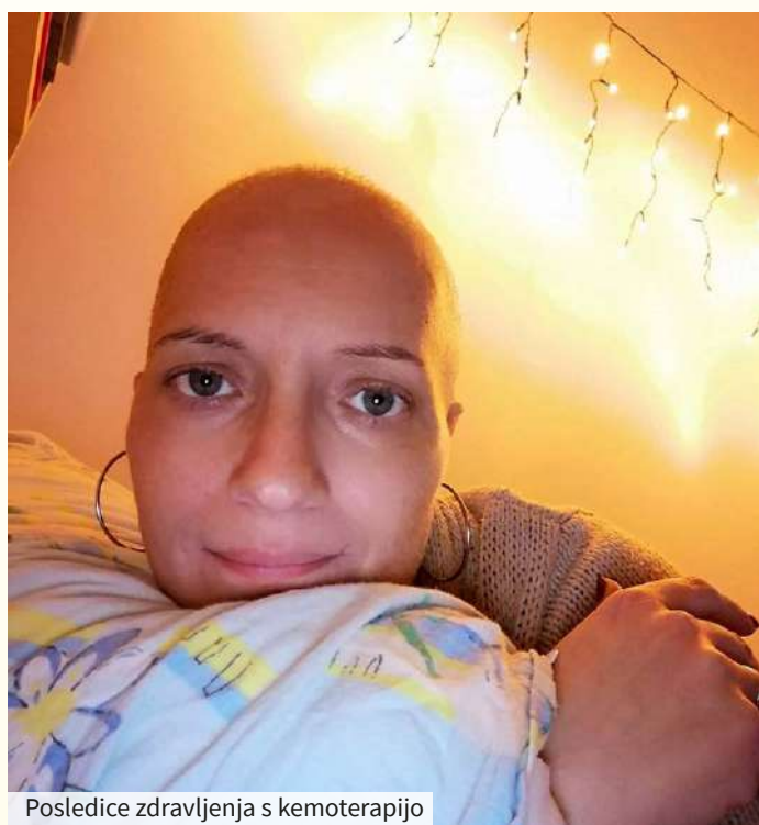
Posledice zdravljenja s kemoterapijo

”Zdi se mi, da so bili prvi trenutki najtežji, predvsem zaradi tega, ker sem v življenju že marsikaj preživela. Naglušna sem od rojstva in nosim obojestranski slušni pripomoček BAHA. Namesto levega ušesa