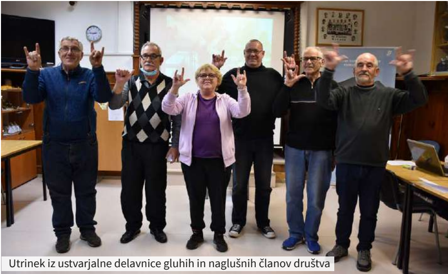
Utrinek iz ustvarjalne delavnice gluhih in naglušnih članov društva

V oktobru in v novembru smo organizirali sedem ustvarjalnih delavnic, na katerih smo izdelovali novoletne okraske in voščilnice. Sodelujočim se zahvaljujemo za pomoč pri izdelavi. ●