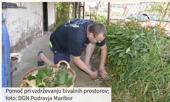
Pomoč pri vzdrževanju bivalnih prostorov

Uporabnik ima nadzor nad organizacijo in oblikovanjem storitev osebne asistencije glede na lastne