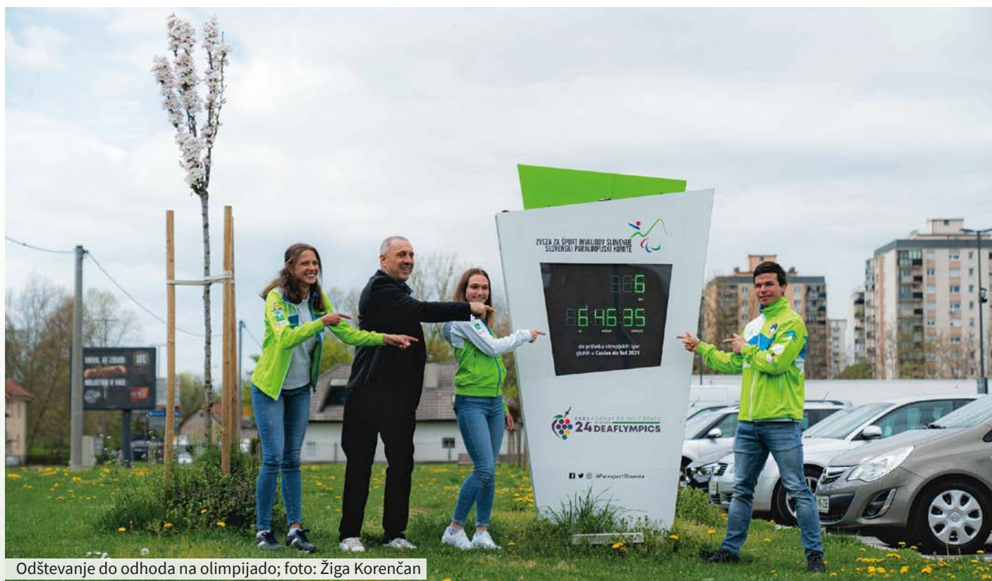
Odštevanje do odhoda na olimpijado

SLOVENSKA ČETVERICA JE DOBRO PRIPRAVLJENA