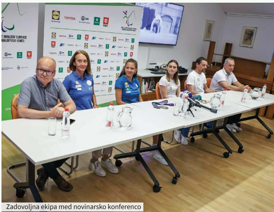
Zadovoljna ekipa med novinarsko konferenco

Slovenska reprezentanca je predstavila dosežke s štiriindvajsete poletne olimpijade gluhih, ki je maja potekala v Braziliji. Po zaslugi dveh zlatih in dveh bronastih medalj je bila to za Slovenijo najuspešnejša olimpijada. Novinarske konference ob vrnitvi v domovino so se udeležili številni predstavniki slovenskih medijev.