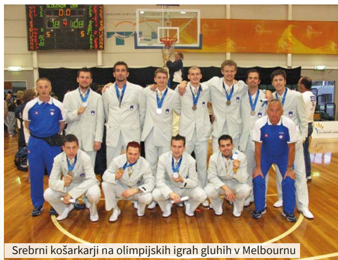
Srebrni košarkarji na olimpijskih igrah gluhih v Melbournu

Slovenija se je na največjem tekmovanju za gluhe športnike, olimpijskih igrah gluhih, v košarki uvrščala visoko, dvakrat tudi na stopničke. Na olimpijskih