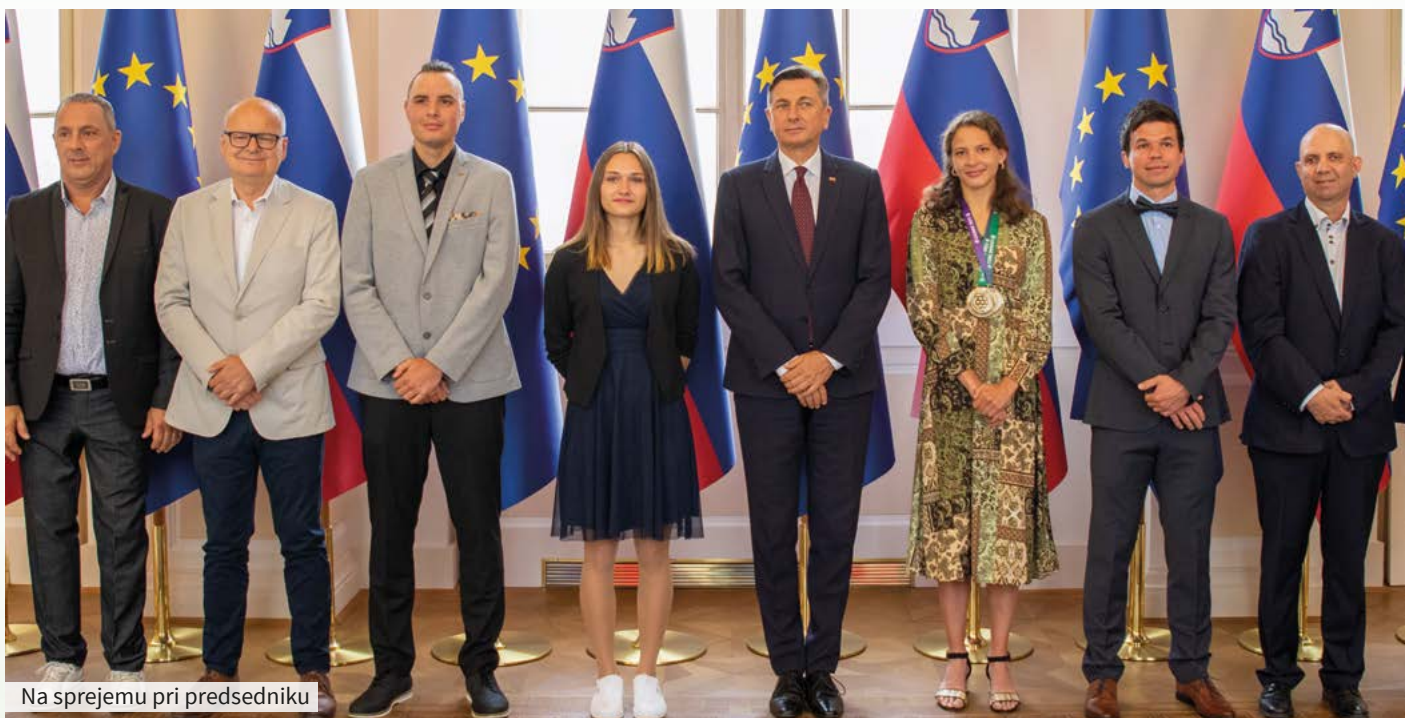
Na sprejemu pri predsedniku

Udeležence štiriindvajsete poletne olimpijade gluhih je ob povratku iz Brazilijske sprejel predsednik republike Borut Pahor. Slovenijo so na olimpijskih igrah zastopali trije atleti in tenisač, ki so dosegli izjemne olimpijske rezultate ter se v domovino vrnili s štirimi odličji.