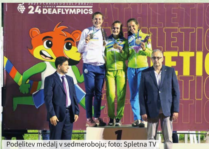
Podelitev medalj v sedmerboju