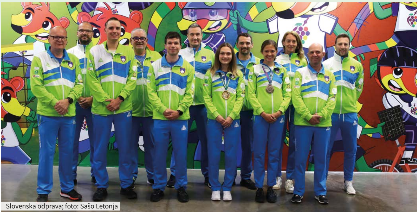
Slovenska odprava

temperaturami in takrat so treninge lahko izpeljali na prostem.