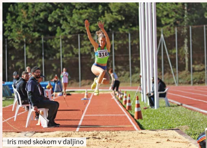
Iris med skokom v daljino

Brez finala v teku na 400 metrov je ostal Tadej Enci, ki so mu v drugi polovici nastopa pošle moči. Vidno razočaran je s tem pridobil dodaten dan za regeneracijo in pripravo na kvalifikacije v teku na 400 metrov z ovirami.