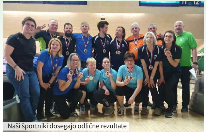
Naši športniki dosegajo odlične rezultate