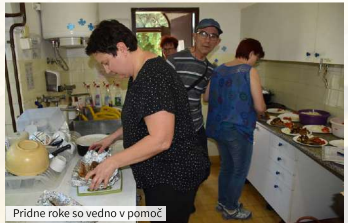
Pridne roke so vedno v pomoč