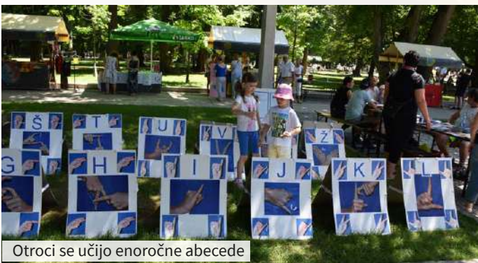
Otroci se učijo enoročne abecede