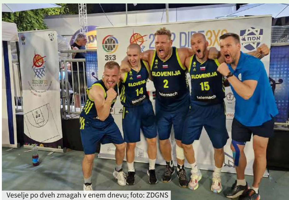
Veselje po dveh zmagah v enem dnevu; foto: ZDGNS

Drugi tekmovalni dan je slovenska reprezentanca igrala tri tekme. Pomerili so se z Estonijo, s Tajvanom in z Mongolijo. Začetek tekme z Estonijo je bil izenačen, v nadaljevanju pa so bili Slovenci močnejši ter povedli z umirjeno, taktično in odločno igro. Z njo