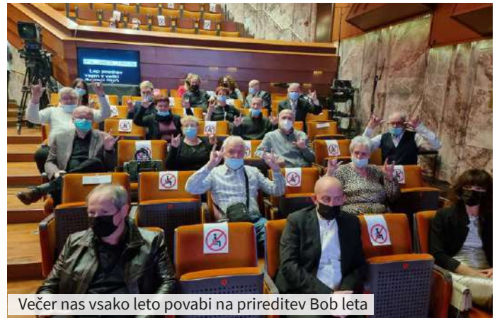
Večer nas vsako leto povabi na prireditev Bob leta