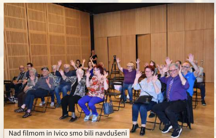
Nad filmom in Ivico smo bili navdušeni

bila stara devet let je hudo zbolela za meningitisom in popolnoma oglušela. Življenje se ji je postavilo na glavo. Spominja se zvokov reke, ki je tekla skozi mesto, v glavi ji še vedno ropotajo odmevi škornjev nemških vojakov, ki so korakali mimo njene hiše, ter se spominja časov, ki jih je preživela v gluhonemnici v Gradcu, kjer je ugotovila, da z gluhoto lahko živi, spoznala moža, predvsem pa našla prijateljico, s katero sta ostali povezani vse življenje. Oma je zgodba