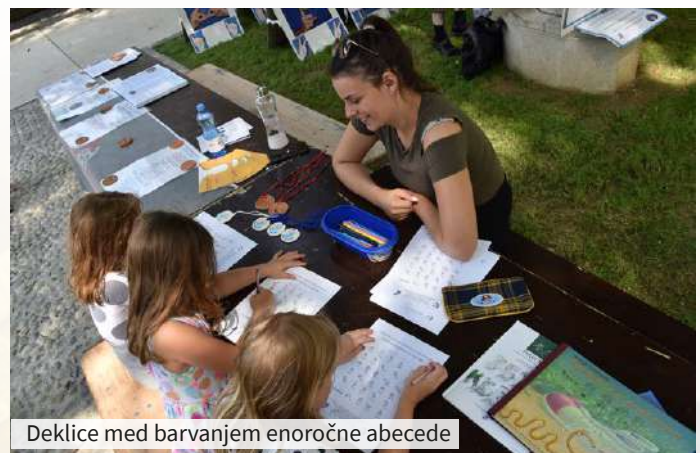
Deklice med barvanjem enoročne abecede

Člani društva vedno radi sodelujemo na različnih dogodkih in izkoristimo vsako priložnost, da svoje delovanje na področju izgube sluha predstavimo širšemu krogu ljudi. Ena od takih priložnosti je Art kamp, velika družina ustvarjalnih prostovoljcev, mentorjev in animatorjev, kjer otroke spodbujajo, da rastejo v ustvarjalne odrasle.