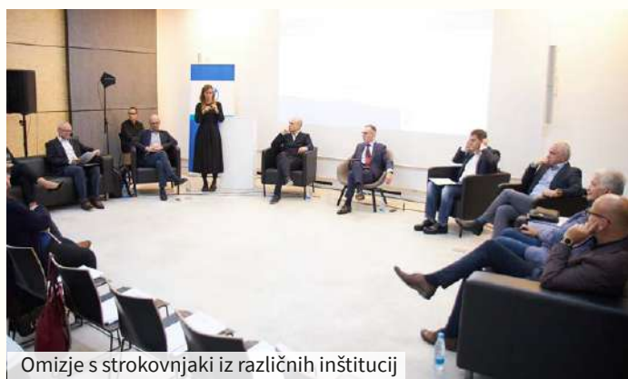
Omizje s strokovnjaki iz različnih inštitucij

Strokovnjaki opozarjajo, da si mora Slovenija prizadevati za boljšo dostopnost avdiovizualnih medijskih storitev, saj so v današnji informacijski družbi zanjo prikrajšani predvsem gluhi, naglušni in slabovidni. Zato potrebujemo ustrezno integrativno telo, ki bi sledilo tehnologijam za omogočanje boljše dostopnosti in pretoka informacij.