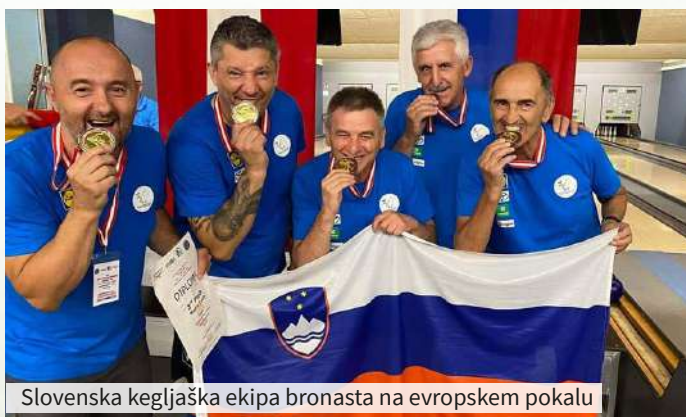
Slovenska kegljaška ekipa bronasta na evropskem pokalu

Pred pokalnim tekmovanjem smo trenirali na različnih kegljiščih in izvedli tekmo z izpadanjem, da sem lahko na podlagi najboljših rezultatov in izkušenj s tekmovanj v različnih ligah sestavil ekipo petih tekmovalcev, ki nas je zastopala v Avstriji.