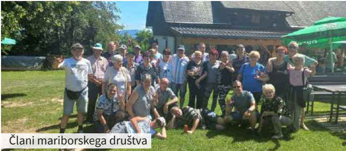
Člani mariborskega društva

Sredi junija je Društvo oseb z okvaro sluha celjske regije pripravilo tradicionalno srečanje društev savinjske in štajerske regije. Zanimanje naših članov zanj je bilo veliko. S polnim avtobusom smo se odpeljali proti Laškemu, kjer je potekalo. Pot nas je vodila do planinskega doma Šmohor nad Laškim. Med vožnjo smo uživali v čudovitem razgledu, ob prihodu na cilj pa smo bili navdušeni nad čarobno naravo in urejeno okolico.