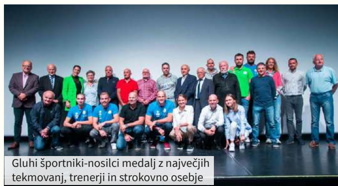
Gluhi športniki-nosilci medalj z največjih tekmovanj, trenerji in strokovno osebje

Matej Pušnik , fotograf: »Najbolj so se me dotaknile solze športnikov in izrazi sreče ob zmagi, hkrati pa tudi razočaranje nad tem, da država še ni pristopila k temu zelo pomembnemu delu slovenskega športa, športu gluhih.«