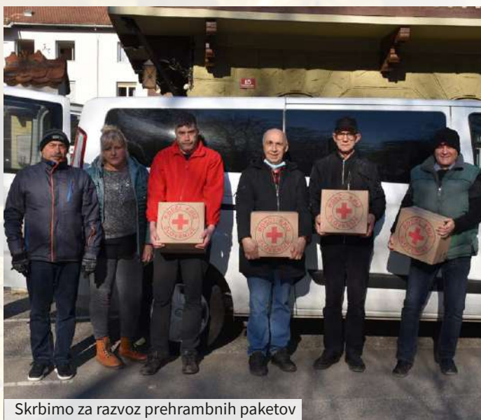
Skrbimo za razvoz prehrabnih paketov