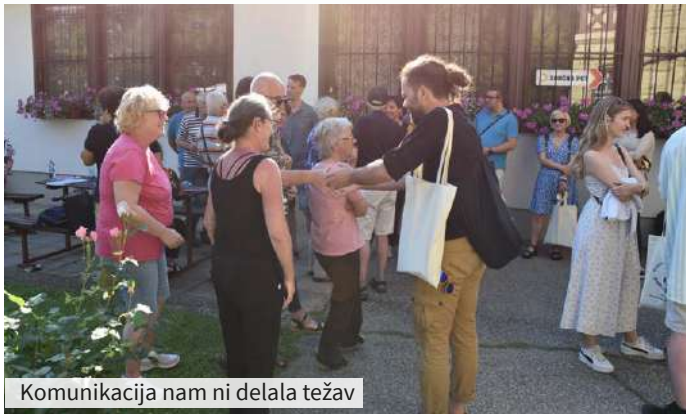
Komunikacija nam ni delala težav