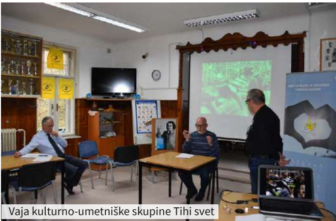
Vaja kulturno-umetniške skupine Tihi svet