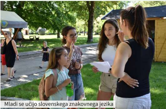
Mladi se učijo slovenskega znakovnega jezika

jezik ter tako kot vsa leta doslej poskrbeli za vzdušje v parku.