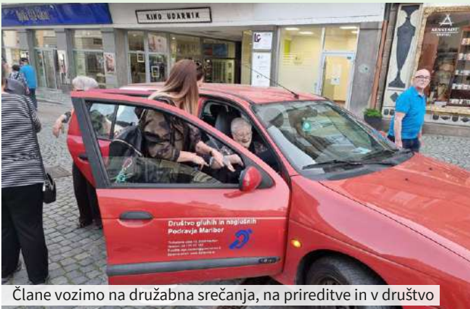
Člane vozimo na družabna srečanja, na prireditve in v društvo