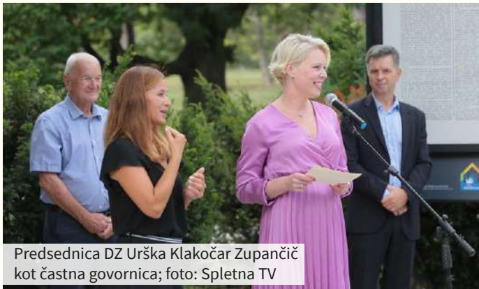
Predsednica DZ Urška Klakočar Zupančič kot častna govornica