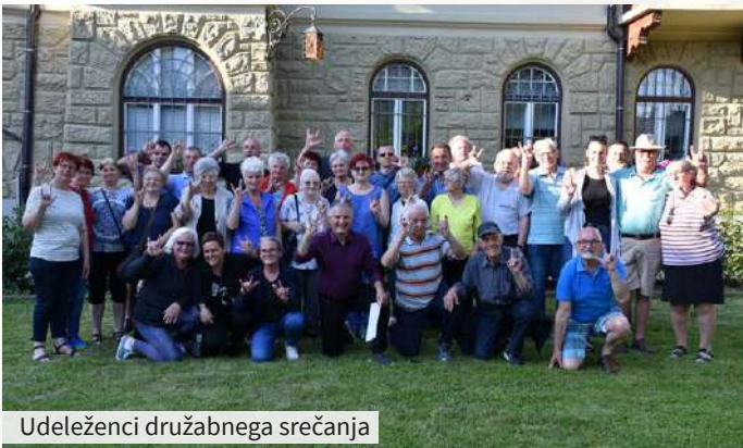
Udeleženci družabnega srečanja

V prijetni senci za mizami se je zbralo mnogo članov. Veselo smo kramljali ob pijači in piškotih. Vedno je lepo, ko smo skupaj. Ob dišavah, ki so se širile z žara, smo še bolj navdušeno tekmovali v šaljivih igrah, najboljše tekmovalce pa so čakala sladka darila. Čas je prehitro minil. Na koncu smo naredili še gasilsko fotografijo. Piknik moramo čimprej ponoviti. ●