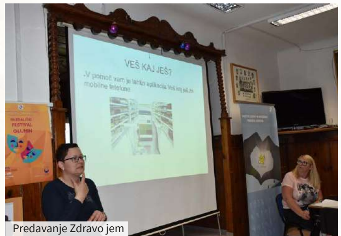
Predavanje Zdravo jem

Konec maja je sledil tretji del predavanja in tudi tokrat se ga je udeležilo veliko članov društva. Rdeča nit je bilo vprašanje, kako stres vpliva na prehra-