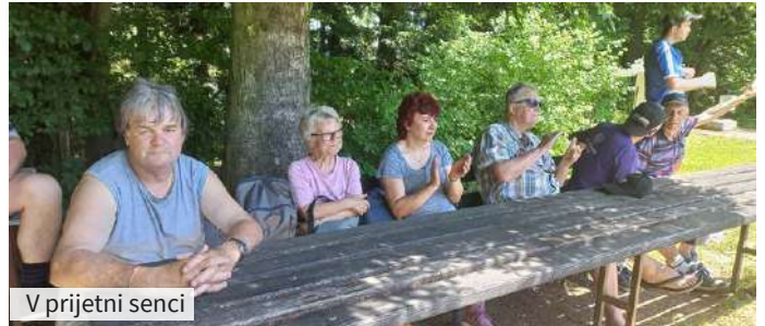
V prijetni senci

že dobro poznamo, saj se srečujemo vsako leto. Radostni obrazi, pozdravi in objemi so se kar vrstili. Vedno, ko se srečamo, smo zelo veseli. Najprej so nas pozdravili predsedniki društev ter nam zaželeli prijetno druženje in veliko zabave.