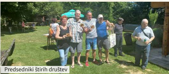
Predsedniki štirih društev

Na srečanju se je zbralo več sto članov iz različnih društev, tako mlajših kot starejših, na kar smo zelo ponosni. Veseli smo bili vsakega. Med seboj se