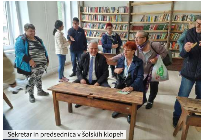
Sekretar in predsednica v šolskih klopeh