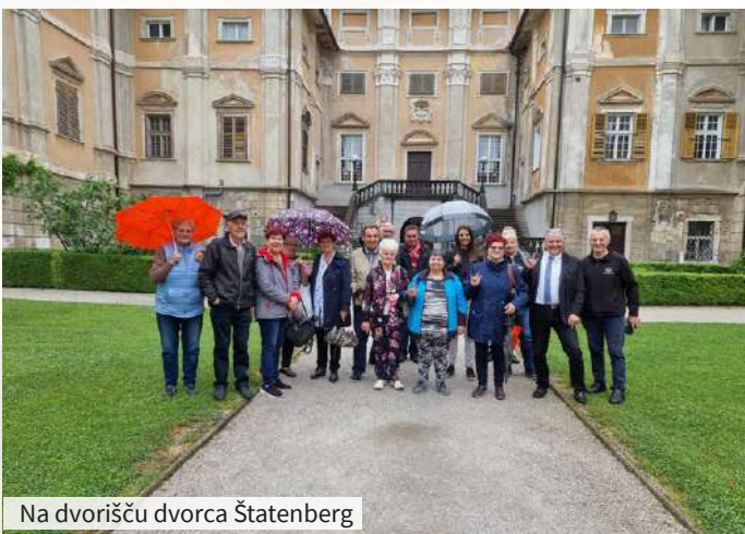
Na dvorišču dvorca Štatenberg