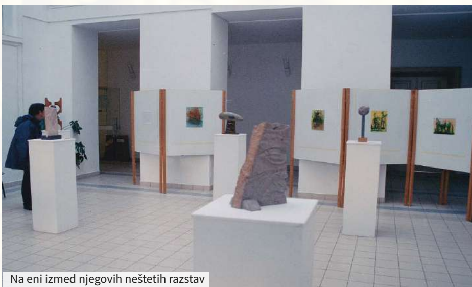
Na eni izmed njegovih nešteti razstav

Albuma z risbami, ki ju skrbno hrani, pričata o nadarjenosti mladega umetnika. Nastajala sta v letih 1963–1966, ko je še obiskoval srednjo grafično šolo, precej prostega časa pa je namenil likovnemu ustvarjanju in izobraževanju na tem področju. Preizkušal se je v različnih slikarskih tehnikah – akvarelu, tušu, temperi ipd. Vadil se je tudi v risanju človeškega telesa. Pri trinajstih letih je iz mavca in žic izdelal kip mačke ter ga pobarval z bronzo. Ustvarjal je tudi linoreze. Za bralce glasila Iz sveta tišine smo izbrali nekaj risb, ki so nastale na začetku plodne in dolge ustvarjalčeve poti. ●