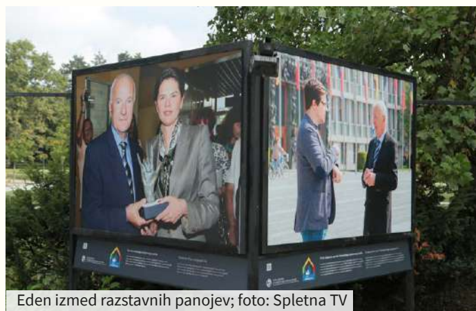
Eden izmed razstavnih panojev