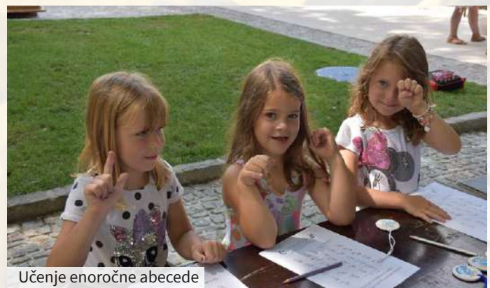
Učenje enoročne abecede

Vreme nam je bilo naklonjeno ves čas prireditve, prijetno druženje pa se je prehitro končalo. Sodelujoči člani društva, prostovoljci in zaposleni so s svojim delom pripomogli k večji prepoznavnosti v širši skupnosti, za kar smo jim iskreno hvaležni. ●