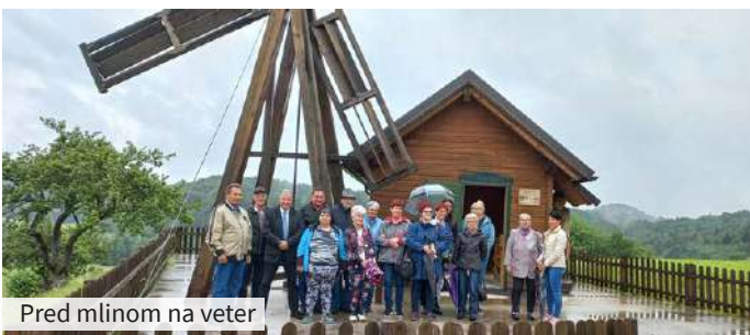
Pred mlinom na veter