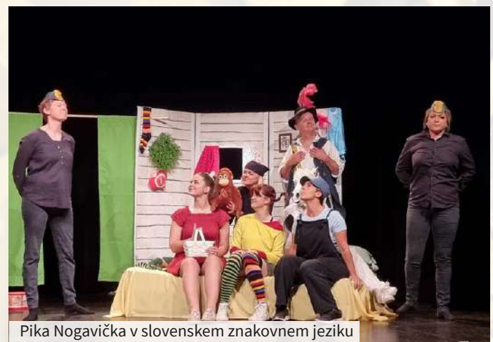
Pika Nogavička v slovenskem znakovnem jeziku

Orešnik. Predstava v slovenskem znakovnem jeziku s sporočilom staršem, naj več časa preživijo s svojimi otroki, je bila tolmačena v govornem jeziku ter je navdušila staro in mlado. ●