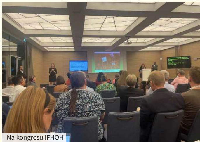
Na kongresu IFHOH

Predstavili so tudi največjo primerjalno študijo s področja izgube sluha in uporabe slušnih aparatov EuroTrak, v kateri je sodelovalo več držav, obrav-