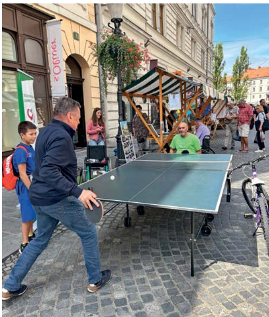
Ljubljanski župan Zoran Jankovič pri igri namiznega tenisa