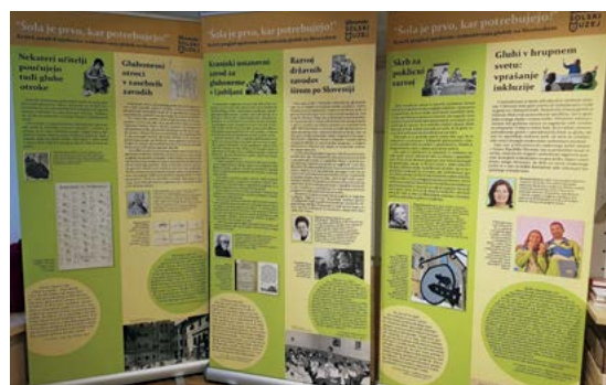
Razstava »Šola je prvo, kar potrebujejo« je nastala leta 2022 ob enajsti mednarodni konferenci o zgodovini gluhih.

V začetku 20. stoletja je gluhonemnica nastala tudi v Ljubljani. Najprej je delovala kot zasebni zavod, leta 1905 pa je postala državni zavod in pod svojim okriljem združila tudi druge, manjše zavode. Trije glavni cilji so bili: vzgajati in izobraževati gluhe otroke, jim ponuditi poklicno izobrazbo in izobraziti šolske