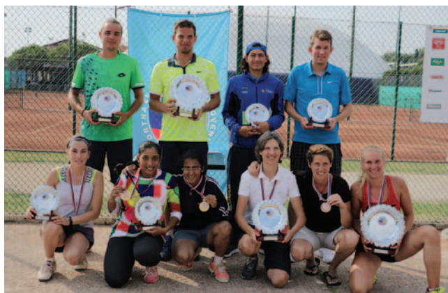
Slovenia Deaf Open 2016