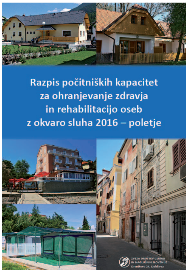
Posebna publikacija ob lanskoletnem razpisu

ni, prav tako je bil v glasilu predstavljen postopek pridobitve tehničnih pripomočkov, ki jih sofinancira država; predstavili smo, kako nove tehnologije vplivajo na komunikacijo med uporabniki znakovnega jezika, in objavili tudi razpis za uporabo počitniških kapacitet za ohranjanje zdravja in rehabilitacijo oseb z okvaro sluha v letu 2016 ter razpis za brezplačno letovanje socialno ogroženih gluhih in naglušnih uporabnikov.