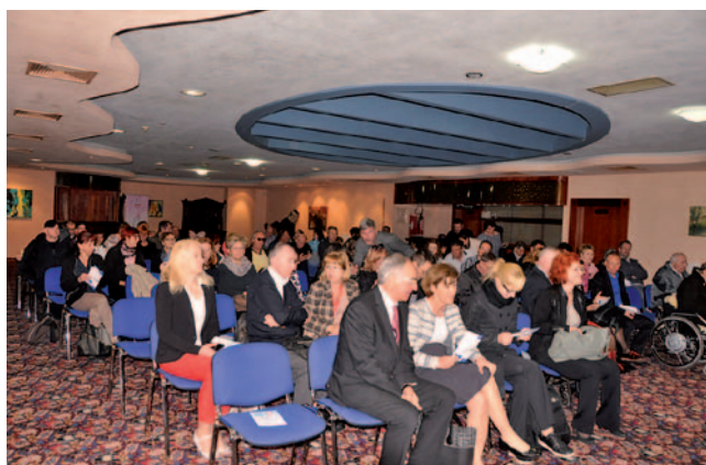
Obiskovalci okrogle mize