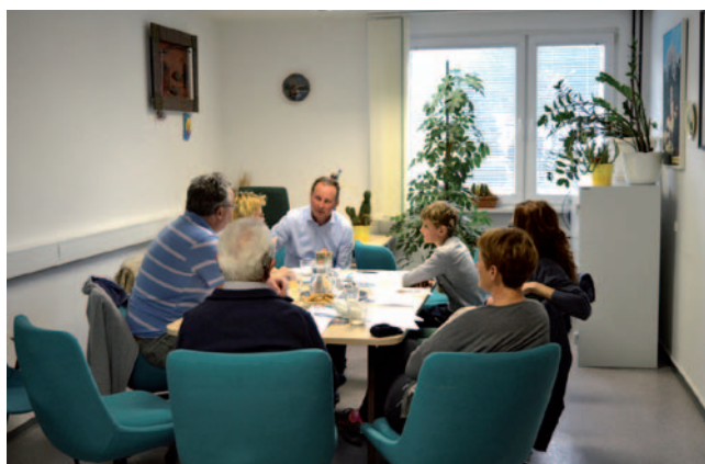
Skupina za samopomoč oseb s polžkovim vsadkom

o imenu skupine. Po kratki debati so se vsi strinjali, da je najprimernejše ime »Kohlearji«.