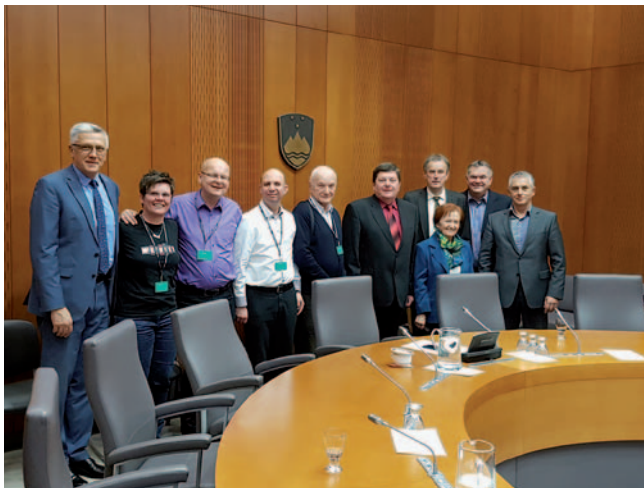
Obisk poslanske skupine DeSUS

ru in številni neformalni pogovori so nujno potrebni, da se ta zakon sprejme. Poleg tega smo sprožili postopke za sprejem še dveh amandmajev. Če bo zakon sprejet, bo to za športnike invalide in šport velika pridobitev.