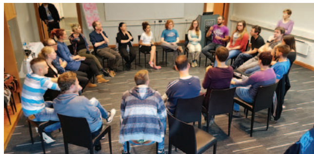
EUDY – delavnica 2016

14. in 15. maja je v Ljubljani potekalo srečanje Evropske zveze gluhe mladine, EUDY. Na tokratni delavnici, ki jo je pripravila Zveza društev gluhih in naglušnih, so predstavniki organizacije Evropske zveze gluhih mladih predstavili svoje delovanje in organizacijo EUDY.