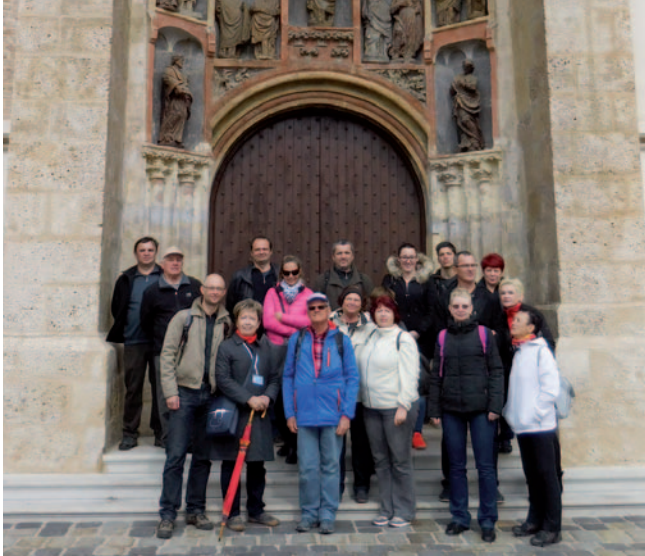
Pred zagrebško katedralo