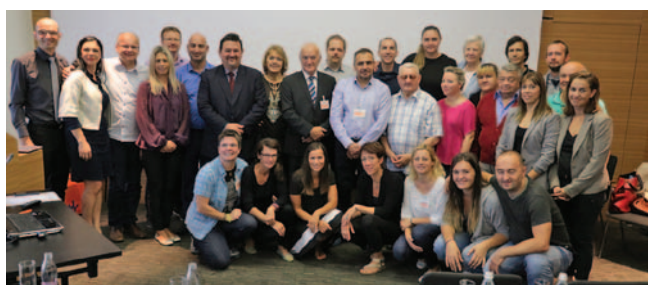
Jadranska konferenca 2016

ZDGNS je organizirala kulturni večer, ki je popestril vsebino Jadranske konference. Po slavnostnem