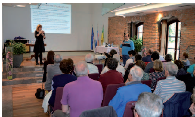
Predavanja o tehničnih pripomočkih

V letu 2016 smo skupaj s člani odbora in zunanjimi sodelavci izvedli šest predstavitev tehničnih pripomočkov (TP), dve predstavitvi potrjenega Pravilnika o tehničnih pripomočkih, okroglo mizo za osebe s polževim vsadkom, opravljenih je bilo 350 ur prostovoljnega dela, 262 individualnih predstavitev in preizkusov različnih TP, 91 telefonskih razgovorov in e-poštnih informiranj o pridobitvi, ustreznosti in delovanju TP, 750 razdeljenih brošur