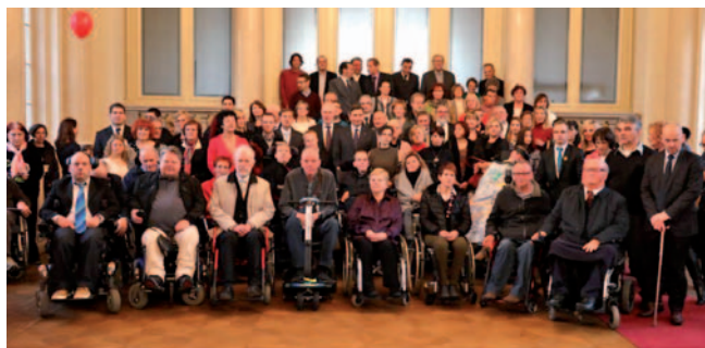
Cilj ZOA je zagotoviti invalidom, da lahko živijo v skupnosti in enako kot drugi odločajo o svojem življenju.

Zakon o osebni asistenci kot pogoj za uveljavljanje pravice do osebne asistencije tudi navaja, da bi moral invalid osebno asistenco potrebovati najmanj 30 ur na teden, da je star med 18 in 65 let ter da ni institucionaliziran. O pravici do osebne asistencije bodo odločali centri za socialno delo. Zakon predvideva še, da se tistim gluhim, slepim ali gluhoslepim uporabnikom, ki ne potrebujejo 30 ur storitev osebne asistencije na teden, ampak samo pomoč pri komunikaciji in spremstvu, odobri osebna asistenca v obsegu 30 ur na mesec.