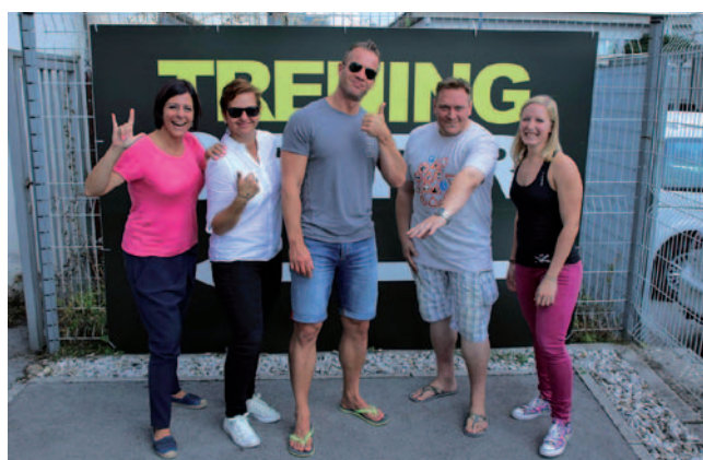
Protagonisti serije Preobrazba življenjskega stila

Od leta 2008 si prizadevamo za čim večjo dostopnost programskih vsebin TVS. Leto zatem sem kot urednica predstavila sistem informiranja gluhih s Spletno TV v Las Vegasu, kjer so se predstavljali podjetniki in ponudniki storitev za osebe z okvaro sluha z vsega sveta. Spletna TV je bila leta 2010 začetnica zagotavljanja dostopnih spletišč osebam z okvaro sluha, k čemur je šele pet let pozneje pozvala tudi Evropska komisija. Avstrijska fundacija za financiranje socialnih projektov je 2012 Spletno TV izpostavila kot najboljši medij za osebe z okvaro sluha v EU. Prvič smo v živo prenašali nastope slovenskih športnikov na olimpijskih igrah gluhih v Bolgariji. Spomladi 2016 smo ekskluzivno pokrivali ligo prvakov gluhih v dvoranskem nogometu v Španiji. Jeseni smo začeli predvajati prvo samostojno serijo z naslovom Preobrazba življenjskega stila, ki je gledalce v petnajstih delih nagovarjala k bolj zdravemu življenjskemu slogu. Neposredno smo vključili gluho osebo in postavili nov mejnik ter temelje za vse nadaljnje tovrstne šove.