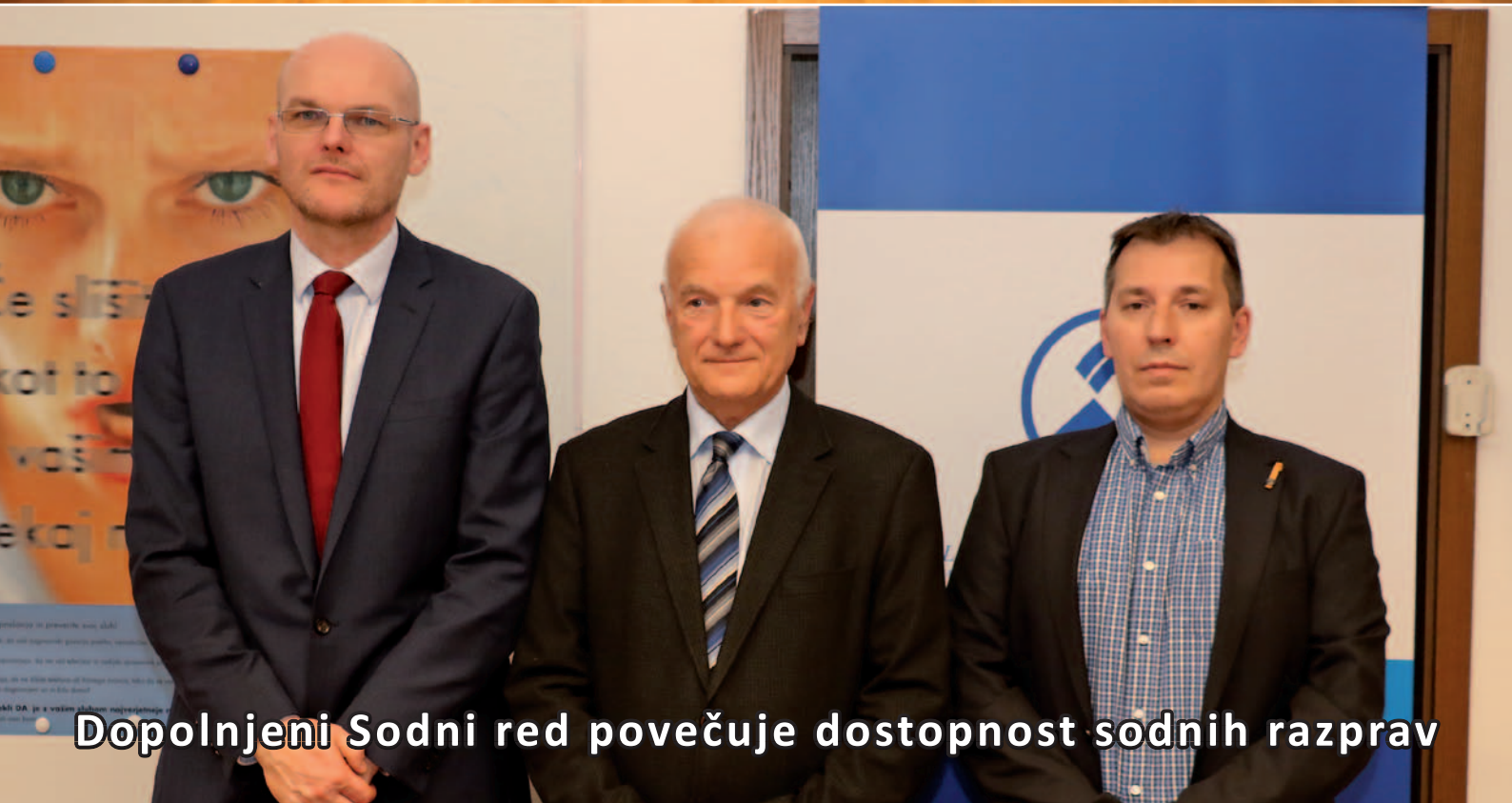
Dopolnjeni Sodni red povečuje dostopnost sodnih razprav