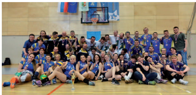
Skupinska slika dobitnikov pokalov in medalj

Zadnji marčni konec tedna je v odličnem vzdušju in športnem tekmovalnem duhu potekalo državno prvenstvo gluhih v odbojki. V moški konkurenci je tekmovalo pet ekip, pri ženskah pa štiri, vsaka ekipa se je pomerila z vsako. Naslov državnih prvakov so osvojili igralci DGN Ljubljana, pri ženskah pa tekmovalke DGN Podravja Maribor.