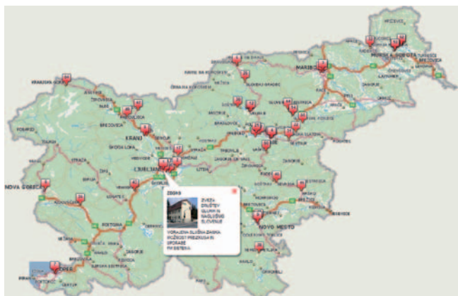
Slušne zanke po Sloveniji

V Centru možnosti so tehnični pripomočki, ki osebam z okvaro sluha s slušnim aparatom ali brez njega in uporabnikom polžvega vsadka pomagajo razumeti in razločevati glasovni govor. V centru imajo uporabniki možnost preizkusa tehničnega pripomočka pred nakupom, svetovanje, informiranje in pomoč pri izboru in uporabi slušnih aparatov, informiranje o pravicah iz obveznega zdravstvenega zavarovanja itd.