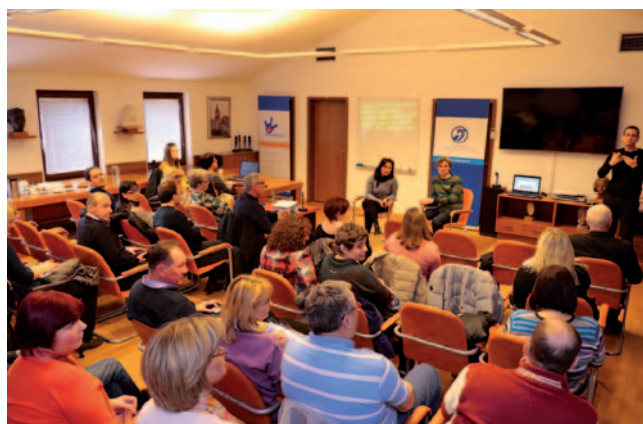
Okrogla miza o polževem vsadku

Program se je izvajal vse leto. V letu 2016 smo skupaj z nekaterimi člani odbora naglušnih izvedli šest predavanj o uporabi in načinu pridobitve slušnega aparata (SA), kamor so nas povabili predstavniki društev, domovi upokojencev in lokalna skupnost. Na predavanjih smo slušatelje seznanili s pravicami do slušnega aparata, postopki pridobitve SA, pravice iz obveznega zdravstvenega zavarovanja, predvsem pa smo jih opozarjali, na kaj morajo biti pozorni pri menjavi, preizkusu in testiranju SA. Te informacije lahko osebe sicer dobijo tudi na zvezi, v naši tehnično-informacijski pisarni, ker pa mnogi ne morejo priti v Ljubljano med uradnimi urami, smo ta predavanja približali uporabnikom. Pripravili smo posebno zloženko za vse javne objekte in prostore ter vozila v potniškem prometu glede tehničnih prilagoditev za osebe z okvaro sluha. Vse aktivnosti sledijo usmeritvam aktov in predpisov glede dostopnosti prostorov, informacij in komunikacij za gluhe, naglušne, gluhoslepe in osebe s polževim vsadkom.