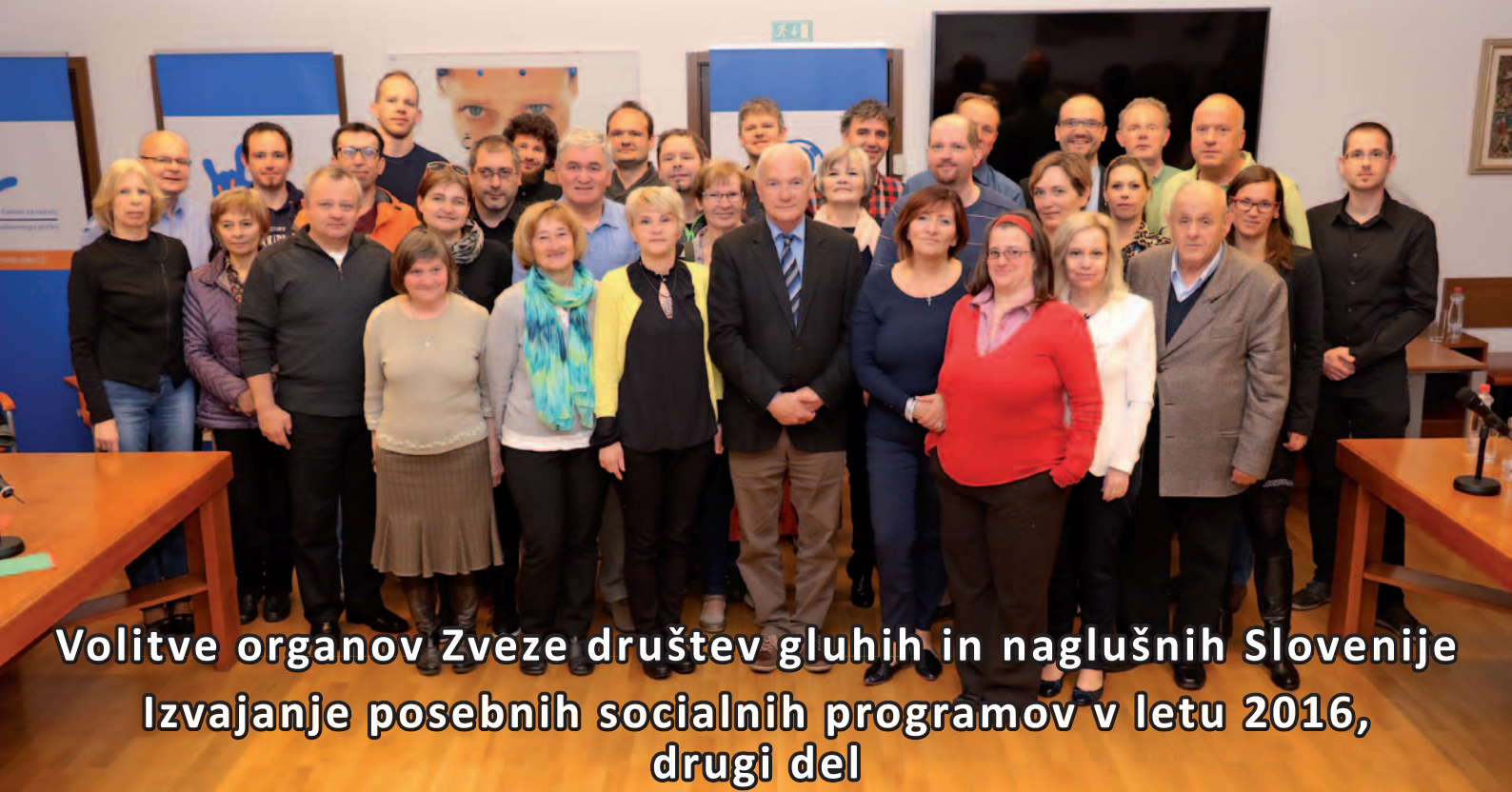
Volitve organov Zveze društev gluhih in naglušnih Slovenije Izvajanje posebnih socialnih programov v letu 2016, drugi del

Letnik XXXVIII, št. 4, april 2017 | ISSN 1318-139