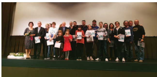
Filmski festival gluhih 2016

V soboto, 15. oktobra 2016, so gluhi in naglušni ustvarjalci filmov predstavili svoje delo na dese-