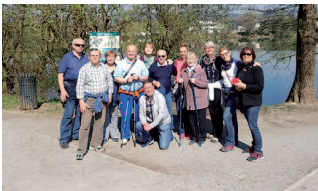
Dnevni center na sprehodu

Starejši gluhi, naglušni in gluhoslepi se lahko vključijo v program Dnevni center, kjer s sodelovanjem v različnih aktivnostih ohranjajo svojo psihosocialno vitalnost, se družijo s sebi enakimi in aktivno preživljajo prosti čas. V društvu izvajamo program od ponedeljka do petka od 8. do 14. ure. Ob ponedeljkih, torkih in sredah aktivnosti potekajo v društvu (praktične delavnice, npr. origami, velikonočna delavnica, izdelovanje okraskov, kuharski tečaj, bralne urice), ob četrtek in petkih pa po navadi organiziramo krajši sprehod (npr. na Rožnik ali po Ljubljani) oziroma si ogledamo kakšno zanimivo razstavo. Tako smo si letos že ogledali razsta-