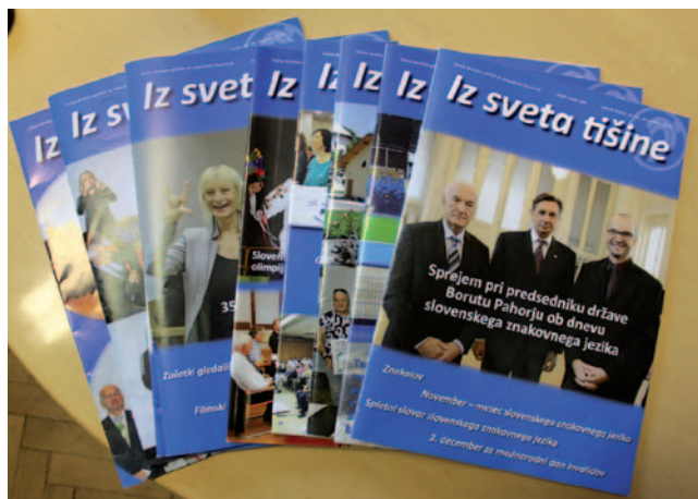
Glasiilo Iz sveta tišine

V glasilu vsebino in težavnost teksta prilagajamo gluhim bralcem, prilagajamo pa tudi informacije javnega značaja s področja zakonodaje, ki se nanaša na življenje in delo uporabnikov. V glasilu smo prav tako objavljali aktualne mednarodne dogodke iz sveta gluhih in naglušnih, kot so: udeležba na skupščini Evropske zveze naglušnih: Pariz 2016, konferenca o evropskem aktu o dostopnosti, stališče organizacije Evropski forum tolmačev znakovnega jezika glede usposabljanj za mednarodno krettnjo, evropski dogodek v Bruslju Večjezičnost in enake pravice v EU – vloga znakovnih jezikov, mednarodni teden gluhih, Jadranska konferenca gluhih in nekatere druge.