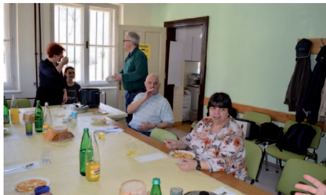
Hrana je bila res okusna.