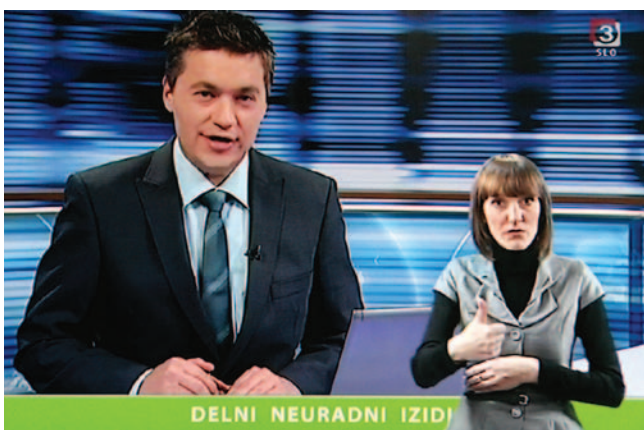
Tolmačka za slovenski znakovni jezik na RTV Slovenija

ZDGNS je aktivno sodelovala pri pripravi predloga za izboljšanje dostopnosti, ki ga je prejel minister za kulturo. Ob tem smo podali predlog za spremembo 7. člena Direktive o avdiovizualnih medijskih storitvah. Vse te aktivnosti vodijo k večjim spremembam pri dostopnosti medijev za vse naše uporabnike.