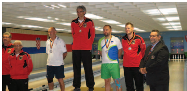
Evropski pokal v kegljanju, sprint, 3. mesto