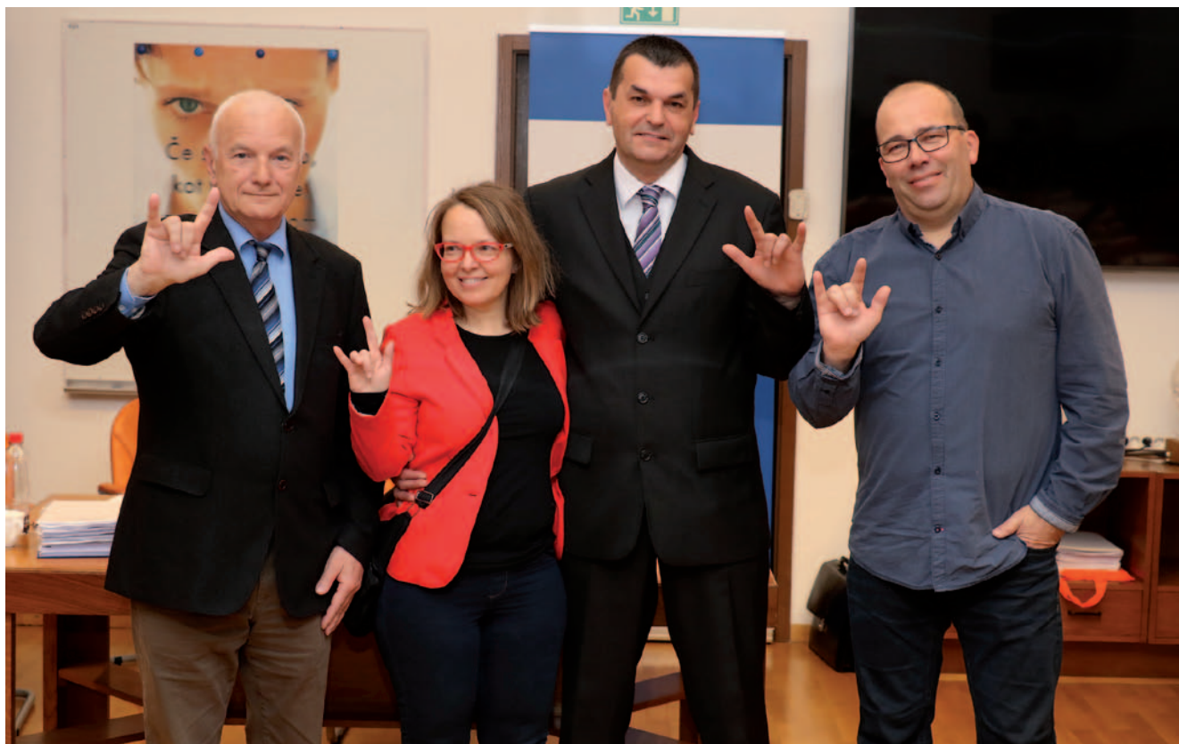
Predsedniški kandidati na volilni skupščini