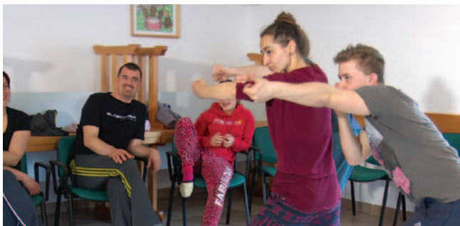
Gledališka delavnica v Kranjski Gori

Zveza društev gluhih in naglušnih Slovenije je v okviru izvedbenega načrta programa Kultura gluhih, ki je bil potrjen na sestanku vodij Kulturne sekcije društev gluhih in naglušnih 4. februarja 2016, izvedla projekt Filmska delavnica gluhih, ki je potekal od petka, 30. septembra, do nedelje, 2. oktobra, v počitniškem domu ZDGNS v Kranjski Gori.