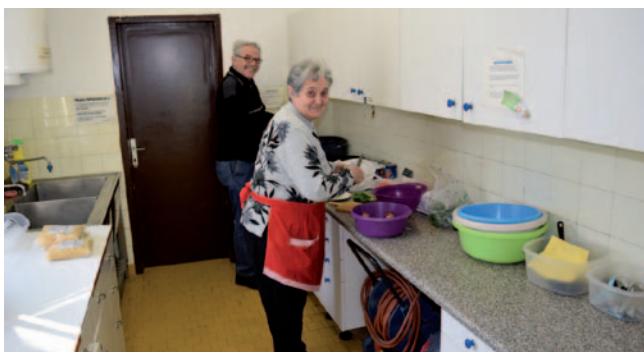
V kuhinji ni bilo gneče.

V Društvu smo opazili čedalje večjo socialno problematiko številnih članov, od upokojencev do mladih z najnižjimi osebnimi dohodki in brezposelnih članov. Zato že več let organiziramo kuharske delavnice, ki jih vodijo naši prostovoljci, člani društva. Tudi letos si bomo prizadevali za nadaljevanje delavnic kuhanja, saj tako člane naučimo, kako se pripravijo številne poceni in okusne jedi, ki jih na koncu tudi vsi pokusimo. Obenem pa ob prijetnem druženju ob torkih poskrbimo še za druge dejavnosti in ob druženju še za izmenjavo medsebojnih izkušenj. Med seboj si izmenjujemo recepte, ki jih objavimo tudi v društvenih medijih (spletna stran, e-pošta, Facebook, Naš glas, info okrogle mize). Člani so izjemno zadovoljni z izvedbo kuharskih delavnic. Vsem prostovoljcem se iskreno zahvaljujemo za vso pomoč pri pripravi, organizaciji in izvedbi teh delavnic. Pri njihovi izvedbi nam občasno pomaga tudi Rdeči križ Maribor s