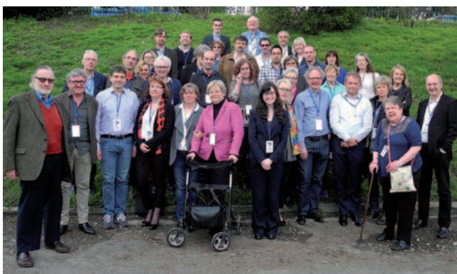
Delegati EFHOH na skupščini v Parizu

V letu 2016 je odbor naglušnih potrdil načrt dela, opozoril na probleme, s katerimi se srečujejo naglušne osebe v društvih, pregledal poročilo dela v prejšnjem letu, predlagal udeležbo na skupščini Evropske zveze naglušnih (EFHOH), podal predloge in smernice za nadaljnje izvajanje aktivnosti za potrebe naglušnih in oseb s polževim vsadkom.