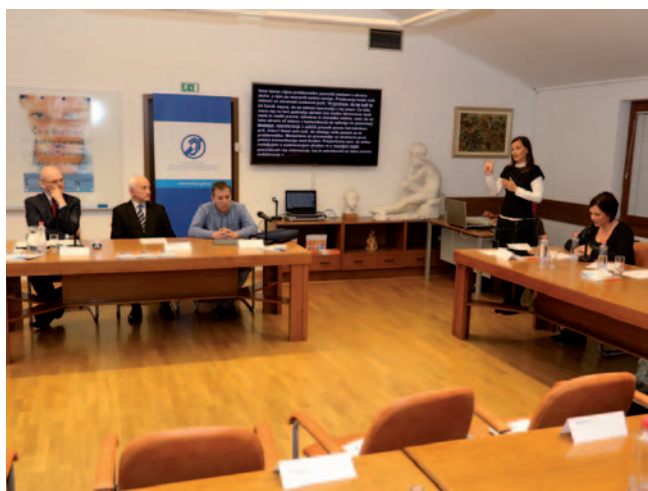
Minister mag. Goran Klemenčič, Mladen Veršič in Goran Kustura

Ministrstvo za pravosodje je na pobudo Zveze društev gluhih in naglušnih Slovenije in Združenja tolmačev za SZJ proučilo problematiko dostopnosti sodnih obravnav za osebe z okvaro sluha. Tako je v Sodnem redu, ki je začel veljati s 1. 1. 2017, v 3. točki 223. člena omogočil dostopnost in možnost do enakopravnega sodelovanja v postopku na sodiščih vsem invalidom in drugim osebam s posebnimi potrebami, med katere štejemo tudi osebe z okvaro sluha (gluhe, naglušne, gluhoslepe in osebe s polževim vsadkom). Počaščeni smo bili, da sta se na povabilo ZDGNS odzvala minister za pravosodje, mag. Goran Klemenčič, in sekretar Nacionalnega sveta invalidskih organizacij Slovenije, Goran Kustura.