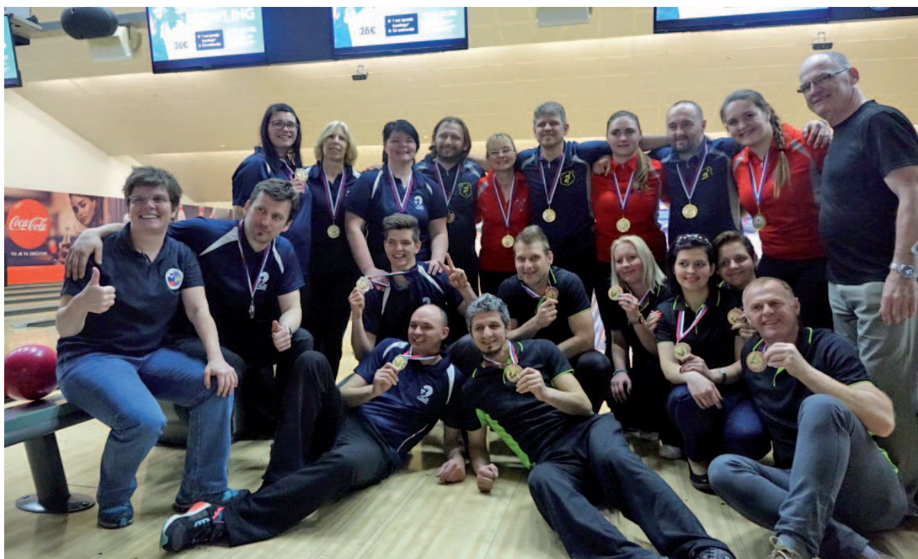
Dobitnice in dobitniki medalj