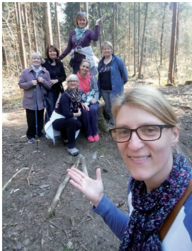
Šopek sredi gozda

vo o čipkah v Slovenskem etnografskem muzeju, prenovljeno Plečnikovo hišo v Trnovem, Ledeno deželo (skulpture iz ledu), Ljubljanski grad, sejem Dom in Avtomobilski salon. Ker radi tudi vrtnarimo, bomo v teh pomladnih mesecih poskrbeli, da bo okolica društva lepo urejena in bodo člane in druge obiskovalce pozdravile cvetlice, na našem