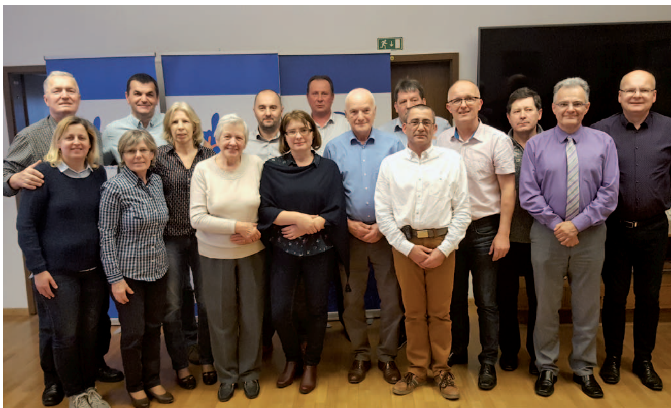
Člani upravnega odbora