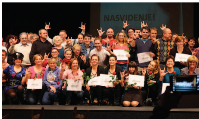
12. gledališki festival gluhih

26. novembra 2016 je v kulturnem domu v Slovenskih Konjicah v organizaciji Medobčinskega društva gluhih in naglušnih Slovenske Konjice, Vitanje in Zreče ter Zveze društev gluhih in naglušnih Slove-