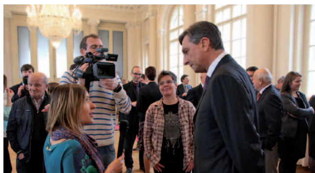
Ekipe Spletne TV med intervjujem z Borutom Pahorjem, predsednikom RS

in oseb z okvaro sluha, s čimer se ne more pohvaliti nobena druga televizija. Naše vsebine redno objavlja tudi 12 lokalnih televizij, s čimer je zagotovljena regijska pokritost.