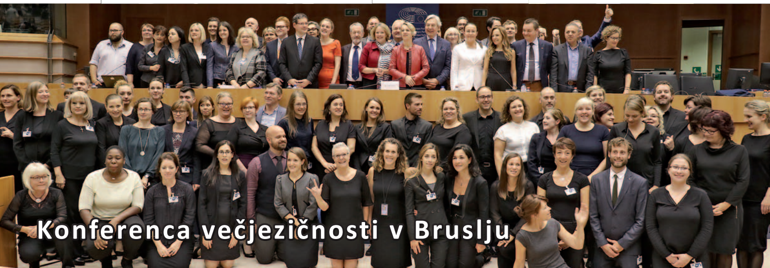
Konferenca večjezičnosti v Bruslju