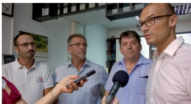
Krvodajalska akcija v Murski Soboti

Na pobudo DGN Pomurja Murska Sobota smo se z vsemi društvi dogovorili, da bomo v sklopu Mednarodnega tedna gluhih tudi gluhi in naglušni naredili nekaj dobrega za družbo. Potekale so številne krvodajalske akcije po vsej Sloveniji, v katerih so člani društev darovali kri in s tem pokazali, da invalidi niso samo prejemniki državnih pomoči, temveč tudi srčni darovalci, te tako pomembne življenjske tekočine.