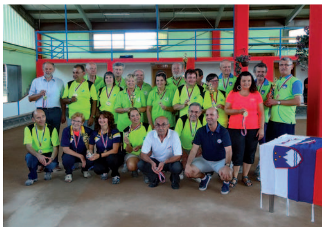
Udeleženci državnega prvenstva

V soboto, 4. septembra 2016, je na balinišču baliinarskega društva Lokateks Trata v Škofji Loki potekalo državno prvenstvo gluhih v ekipnem balinanju.