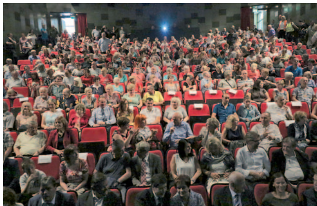
Polna kulturna dvorana Park

kovnega jezika za sporazumevanje in zagotavljanje tolmačev pomeni, da imajo gluhe osebe enake možnosti zaposlovanja. Gluhe osebe potrebujejo dostop do javnih informacij in storitev s tolmačenjem v znakovnem jeziku, s podnaslavljanjem in drugimi ustreznimi tehničnimi rešitvami. Če se gluhih osebam odvzame osnovna pravica do uporabe lastnega jezika, so njihove pravice močno okrnjene.