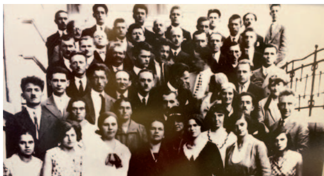
Ustanovni člani prvega društva na Slovenskem

Člani Društva gluhih in naglušnih Ljubljana so 6. septembra 2016 praznovali 85. obletnico svojega društva, ki jim pomeni drugi dom. Ob častitljivem jubileju so se spomnili ustanoviteljev prvega društva gluhih v tedanji Dravski banovini in se povese-lili skupaj s predstavniki drugih društev.