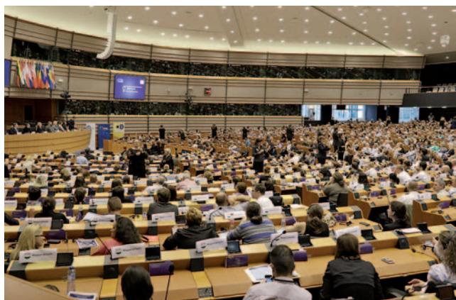
Konference se je udeležilo tisoč uporabnikov.

zapolniti vse sedeže poslancev v evropskem parlamentu z gluhih iz vse Evrope. Številni tolmači, prevajanje v različne jezike in mnogo različnih zna-