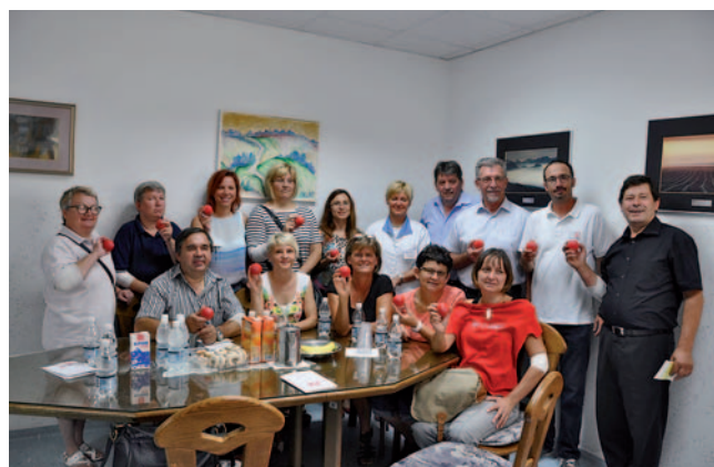
Med člani DGN Pomurja je veliko krvodajalcev.