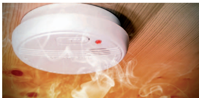
Javljalnik požara (slika je simbolična)

Tehnični pripomočki, ki so namenjeni zaznavanju ogljikovega monoksida, so res skrajni ukrep. Zato da se ob katerikoli nepravilnosti uporabnika pravočasno opozori na to nevarnost, pojasnjuje Gašper Golob.