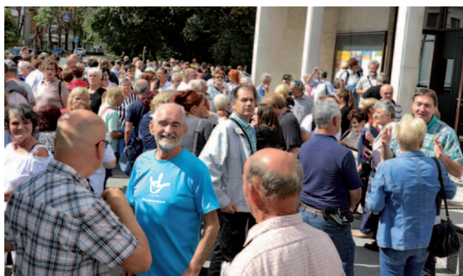
Udeleženci mednarodnega dneva

Svetovna zveza gluhih je leta 1958 v Rimu v Italiji sprejela svetovno manifestacijo »Mednarodni teden gluhih«, ki jo povsod po svetu praznujemo zadnji teden v septembru, v počastitev prvega svetovnega kongresa gluhih, ki je bil organiziran septembra leta 1951. Tokratni 58. mednarodni dan gluhih pa je bil v Murski Soboti in je sovpadal s 60-letnico delovanja Društva gluhih in naglušnih Pomurja Murska Sobota. Tokratno praznovanje se je ujemalo tudi s 65. obletnico ustanovitve Svetovne zveze gluhih v Rimu v Italiji ter 10. obletnico sprejema Konvencije Združenih narodov o pravicah invalidov. Tema mednarodnega tedna gluhih Svetovne zveze gluhih je bila »Z znakovnim jezikom sem enakopraven«, tema mednarodnega dneva gluhih v Sloveniji pa »Naredimo gluhoto vidno«. Na ta dan oz. teden smo opozorili javnost na nevidno invalidnost – gluhoto – in na svoje težave, s katerimi se srečujemo v vsakodnevem življenju.