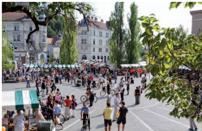
ZDGNS je na stojnici predstavila svoje delo.

ZDGNS je predstavila svoje delovanje, storitve in izdelke na LUPI. Veliko mimoidočih se je zanimalo za različne publikacije, in veseli nas, da smo lahko svoje delo predstavili tudi na Radiu Slovenija.