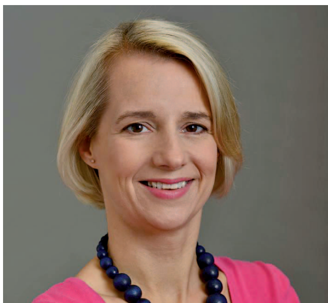
Helga Stevens, evropska poslanka

»Mednarodni teden gluhih je edini teden v letu, ki je deležen velike globalne pozornosti in intenzivnega ozaveščanja javnosti o skupnosti gluhih na različnih ravneh. Namenjen je združevanju in povezovanju gluhih, zato da našo enotnost pokažemo tudi preostalemu svetu. Mednarodni teden gluhih je namenjen tudi promociji, izboljšanju človekovih pravic gluhih,« je dejal Allen Collin.