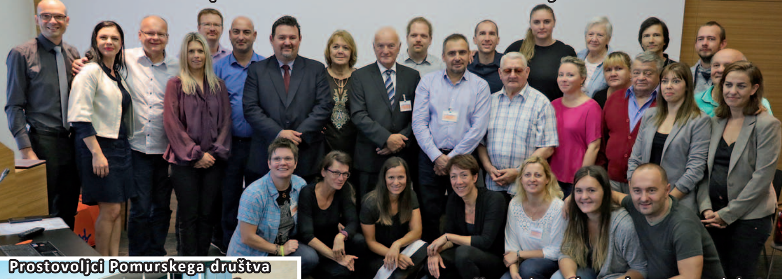
Prostovoljci Pomurskega društva