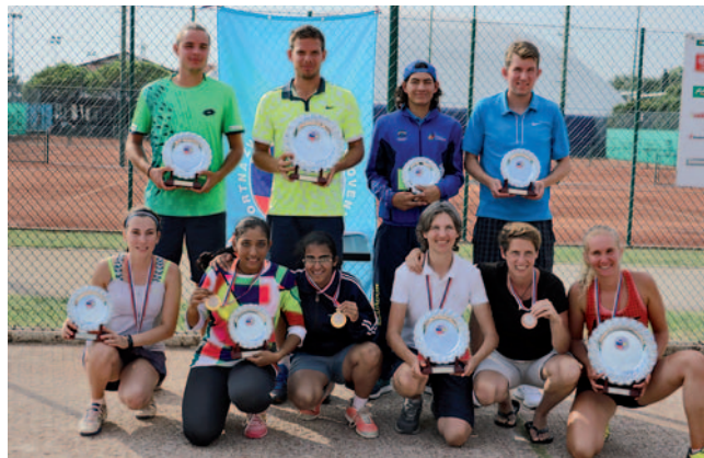
Najboljši tenisači mednarodnega turnirja 2016

že kar nekaj izkušenj in znanja, vendar se razlika vseeno pozna. Star sem 21 let, Mathe pa je precej starejši. Mislim, da bom prihodnje leto na Deaflympics 2016 v Samsunu dobro igral,« je optimističen Kegl.