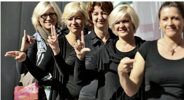
Z znakovnim jezikom lahko komuniciraš tudi ti!

ZDGNS že vrsto let izvaja številna izobraževanja, usposabljanja, okrogle mize in predstavitve s področja našega dela. V jesenskem času smo orga-