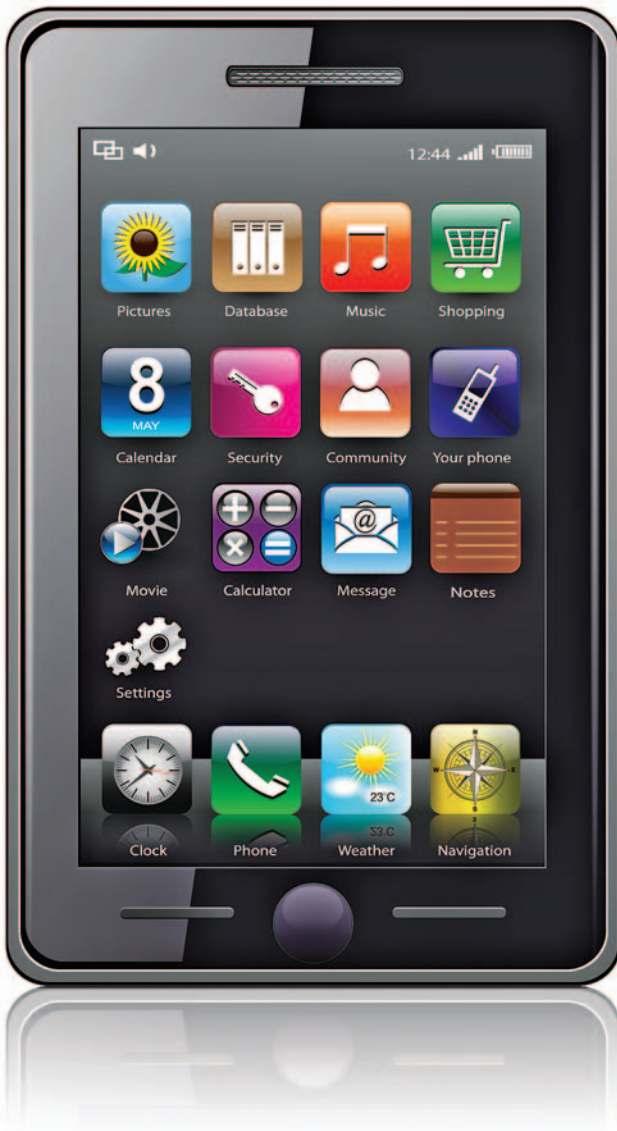
Pametni telefon (slika je simbolična)

evrov. Slabost pri večini ponudnikov je, da lahko kupiš telefon samo v prosti prodaji s polno ceno in v enkratnem znesku. Te cene pametnih telefonov pa se gibljejo od 60 EUR navzgor.