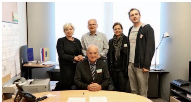
Predstavniki ZDGNS z Romano Tomc, evropsko poslanko

Štirje predstavniki ZDGNS so se s finančno pomočjo treh slovenskih evropskih poslancev udeležili konference v evropskem parlamentu. Namen je bil