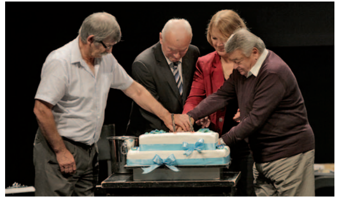
Nekdanji predsedniki ZDGNS pri razrezu torte

ZDGNS je organizirala kulturni večer, ki je popestril vsebino Jadranske konference. Po slavnostnem kulturnem večeru smo večer končali z razrezom torte in zdravico v počastitev visoke obletnice organiziranega delovanja. Kulturni večer so poleg vseh slovenskih nastopajočih popestrili prijatelji iz hrvaške gledališke skupine Dlan, ki so zaigrali igro Ostržek.