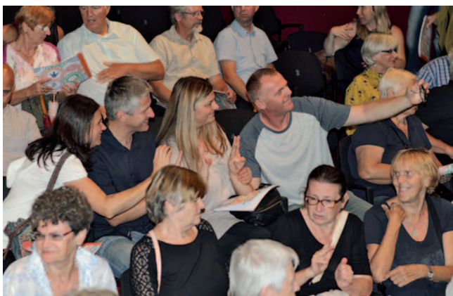
Navdušeni udeleženci kulturnega večera v SiTi teatru