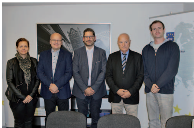
Predstavniki ZDGNS z Markom Wheatleyem, direktorjem Evropske zveze gluhih

zapolniti vse sedeže poslancev v evropskem parlamentu z gluhih iz vse Evrope. Številni tolmači, prevajanje v različne jezike in mnogo različnih zna-