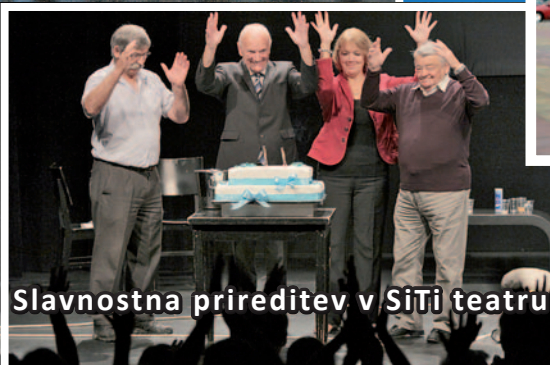
Slavna prireditev v SiTi teatru