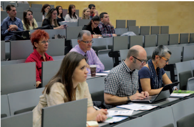
Predstavitve projekta na FERi

Udeležili smo se predstavitve rezultatov evropskega projekta TRANS2WORK na mariborski fakulteti FERi. Projekt omogoča študentom invalidom študij z manj ovir in lažji prehod na trg dela. FERi je med prvimi v evropskem univerzitetnem okolju prilagodila spletne strani študentom invalidom, saj so nekatere vsebine dostopne tudi v slovenskem znakovnem jeziku.