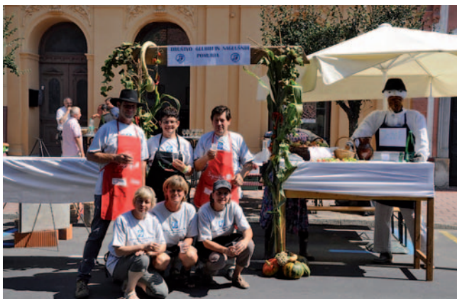
DGN Pomurja na Bogračfestu v Lendavi

Med skoraj 500 člani društva, ki prihajajo iz 27 pomurskih in tudi sosednjih občin, sta zelo priljubljena programa kultura in šport gluhih.