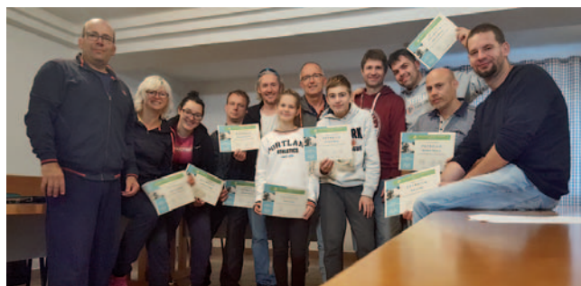
Udeleženci filmske delavnice