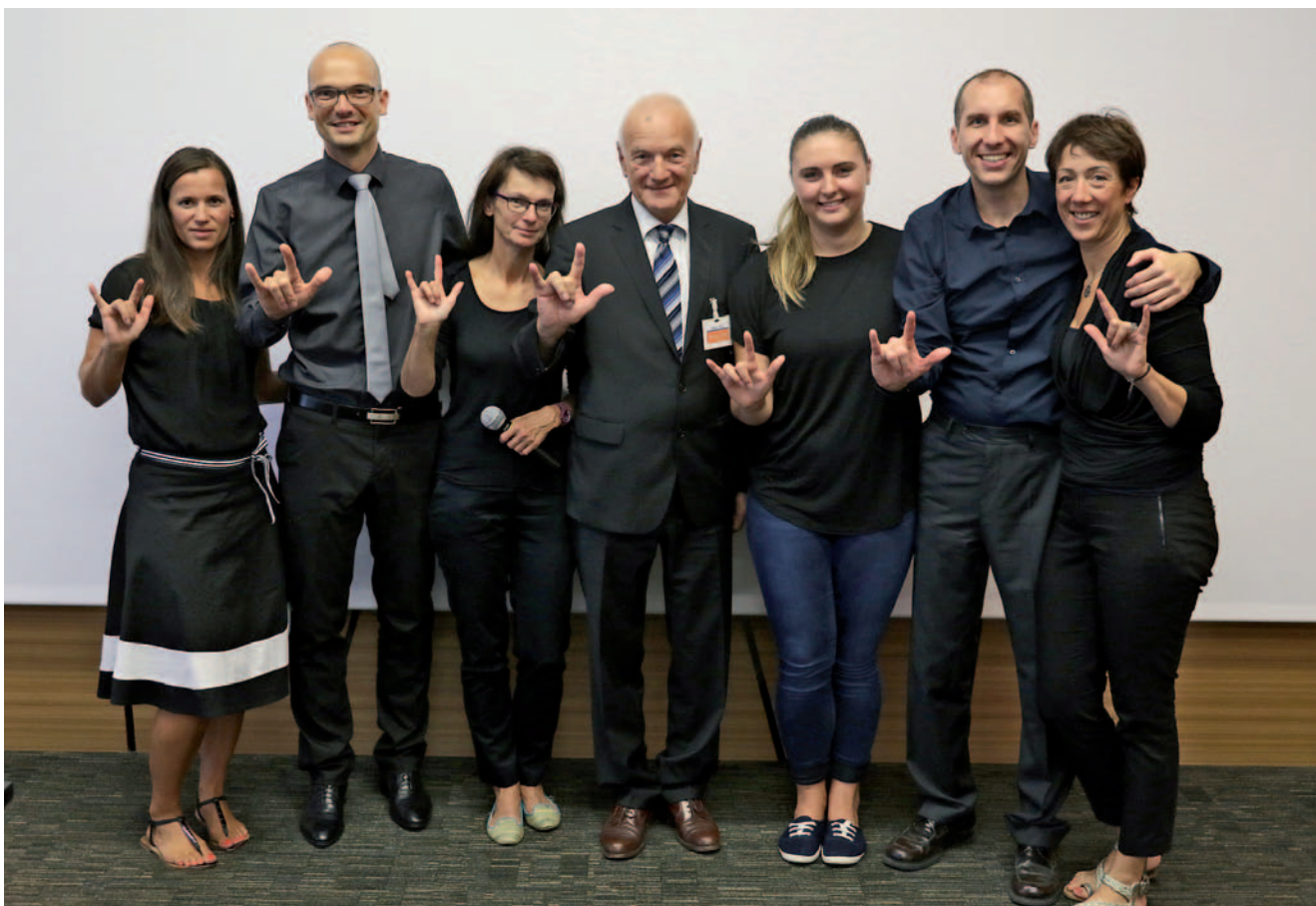
Vodstvo ZDGNS z gluhi in slišječimi tolmači SZJ

Več kot 70 milijonov gluhih po vsem svetu je tretjo septembrsko soboto že tradicionalno praznovalo mednarodni dan gluhih. Svetovna zveza gluhih je mednarodni dan gluhih razglasila leta 1958 kot spomin na prvi kongres gluhih, ki je potekal septembra 1951 v Rimu. Z vsakoletno manifestacijo želi gluha skupnost širšo javnost opozoriti na svojo nevidno invalidnost in z njo povezano diskriminacijo. Obenem pa s ponosom dokazuje obstoj lastne kulture in znakovnega jezika. Letošnji mednarodni dan gluhih je potekal v soboto, 17. septembra, pod sloganom »Naredimo gluhoto vidno«. V mestu ob Muri se je v organizaciji tamkajšnjega Društva gluhih in naglušnih Pomurja Murska Sobota in Zveze društev gluhih in naglušnih Slovenije zbralo več kot 500 gluhih. To je skoraj tretjina od približno 1800 gluhih, ki živijo pri nas. Mednarodni dan gluhim pomeni priložnost za druženje ter sporočanje svojih potreb in zahtev.