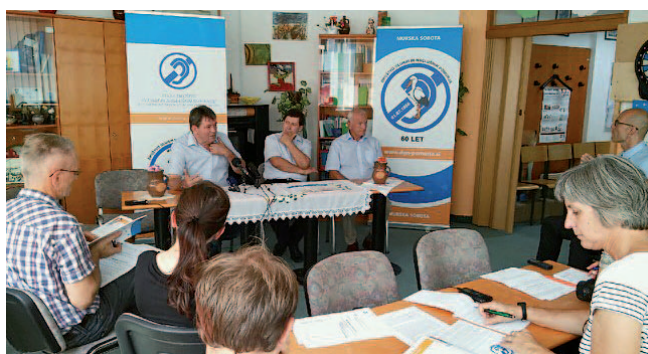
Tiskovna konferenca, DGN Pomurja Murska Sobota

Prvič smo praznovali mednarodni teden gluhih, in sicer pod geslom Z znakovnim jezikom smo enakovrni. Aktivnosti so potekale ves teden, medijski odziv pa je bil izredno pozitiven.