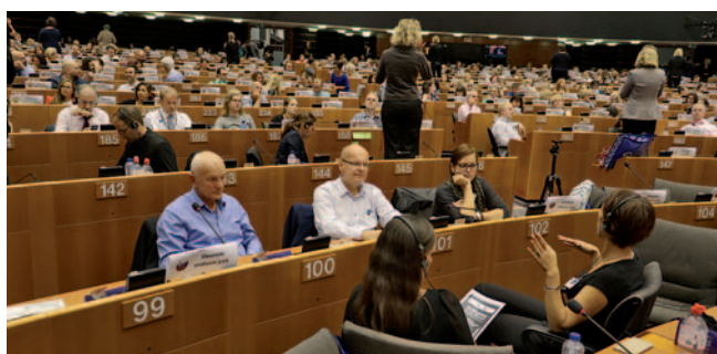
Tisoč gluhih v evropskem parlamentu