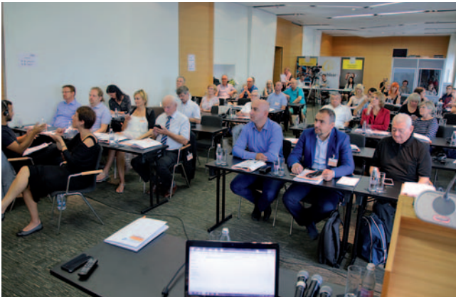
Jadranska konferenca

pravic v posameznih državah, izmenjava dobrih praks ter povezovanja pri medsebojni pomoči ob uveljavljanju teh pravic. Konference so se udeležili predstavniki Makedonije, Hrvaške, Madžarske,