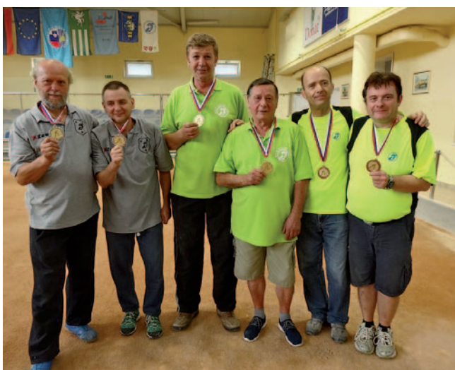
Najboljši balinarski dvojici

MDGN Slovenske Konjice, Vitanje in Zreče je v sodelovanju s Športno zvezo gluhih Slovenije, ki jo je zastopala tehnična delegatka Sabina Hmelina, v soboto 10. septembra 2016 izvedlo prvo državno prvenstvo gluhih v balinanju. Na njem so se pomerile moške dvojice.