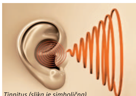
Tinnitus (slika je simbolična)

zvok, ki ne nastaja nikjer drugje, razen v notranjem ušesu. Notranje uho z gibanjem zunanjih dlačnic namreč proizvaja zvok. Okvara v notranjem ušesu sprva povzroči to, da zaznamo le glasnejše zvoke in da uho zazna zvok, ki ga proizvaja samo. Kajti dobro delujoče uho – možganske poti in možganska skorja – zvok, ki ga proizvaja uho, samo po sebi zbríše. To so negativne povratne zanke: čeprav zvok nastaja, možgani vedo, da je to zvok, ki nastaja v notranjem ušesu, toda: ne, ne, tega mi ne bomo slišali.«