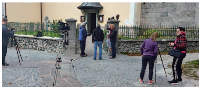
Nastajanje filma Vera

cerkvijo ter druge kadre v bližnji okolici. V prvi skupini so bili udeleženci kot igralci, v drugi pa kot snemalci in tehniki. Snemanje filma so opravili v dveh urah. Drugi skupini sta šli v gozd in snemali v naravi pa tudi v domu v Kranjski Gori. V pozno-popoldanskem delu drugega dneva delavnice so udeleženci delavnice spoznavali programsko aplikacijo Canopus Edius za montažo videoposnetkov v visoko ločljivi (HD) resoluciji. Učili so se tehnike montaže: pripravo videozapisov za montažo, izrez sekvenc, montiranje več sekvenc v določena zaporedja, grafično obdelavo videozapisov, finalizacijo celotne montaže ter opremljanje filma s špico in podatki. Učenje je trajalo do polnoči.