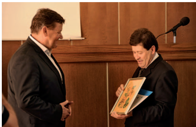
Predsednik DGN Pomurja Murska Sobota je županu podelil simbolno darilo.

vedno premalo, to nam je v MO jasno. Zato pomagamo tudi na druge načine. Današnjo 60-letnico smo pomagati soorganizirati tudi mi,« še dodaja Jevšek.