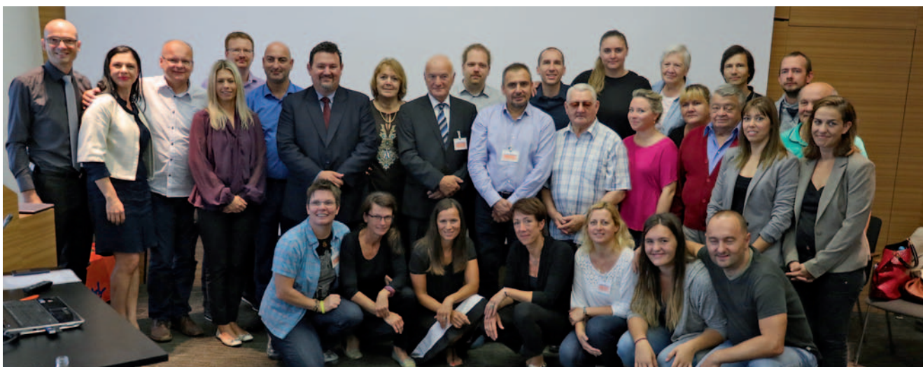
Udeleženci Jadranske konference gluhih

Največ zanimanja je vzbudila razprava o priznanju 100-odstotne telesne okvare in s tem pravice do dodatka za pomoč in nego, do katerega so z novim Zakonom o socialnem varstvu upravičeni gluhi na Hrvaškem.