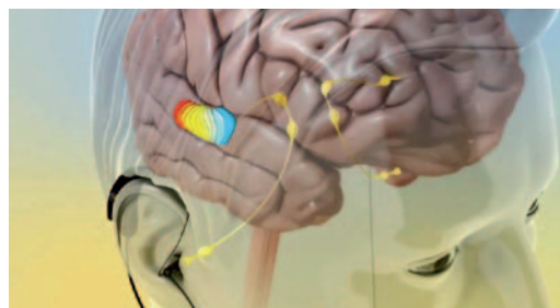
Tinitus (slika je simbolična)

sluha. Šumi so bili večji, močnejši. Šla sem na urgenco in dobila diagnozo tinitus. Zame je bil to šok. Bila sem v skrbeh, nevedna, kaj to pomeni. Prej nisem niti vedela, da to obstaja. Porajala so se mi različna vprašanja: kako se bom s tem sprijaznila, ali bo izginilo, kako bom preglasila šumenje. Eno leto sem hodila na preiskave in iskala vzrok. Še danes ni natančnega vzroka, zakaj se je tinitus pojavil. Zdravniki so mi rekli, da je glavni krivec stres, da je ta povzročil šumenje v ušesih.«