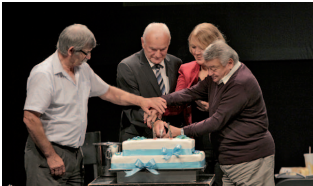
Nekdanji predsedniki ZDGNS pri razrezu torte

V okviru mednarodnega tedna gluhih je bila organizirana tudi proslava v čast 85-letnice organiziranega delovanja gluhih na Slovenskem. Zveza društev gluhih in naglušnih Slovenije je v četrtek, 15. septembra, pripravila sijajen kulturni večer v ljubljanskem SiTi teatru. Poleg številnih predstavnikov slovenskih društev gluhih in naglušnih so se večera udeležili tudi ugledni gostje iz nekdanjih jugoslovanskih republik in nekaterih sosednjih držav.