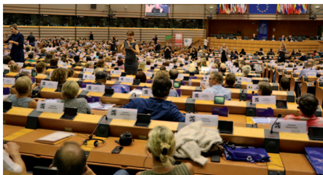
Gluhi so zasedli vse sedeže v evropskem parlamentu

vanja tolmačev-prevajalcev znakovnega jezika ter zagotovi dostopnost vseh programov EU gluhim osebam, uporabnikom znakovnega jezika.