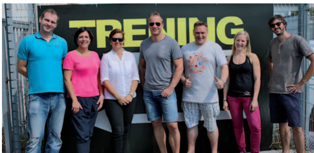
Preobrazba življenjskega stila od 30. septembra na Spletni TV