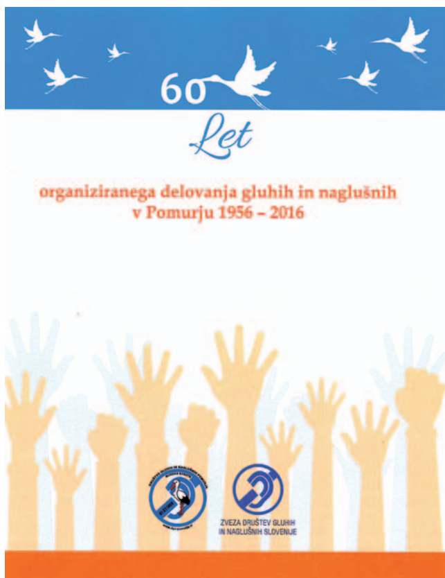
Zbornik DGN Pomurja Murska Sobota

DGN Pomurja je ob mednarodnem dnevu gluhih izdalo obsežen zbornik, ki je ne samo zgodovinski pregled dela in življenja društva, temveč tudi kakovosten vpogled v pravice in potrebe gluhih in