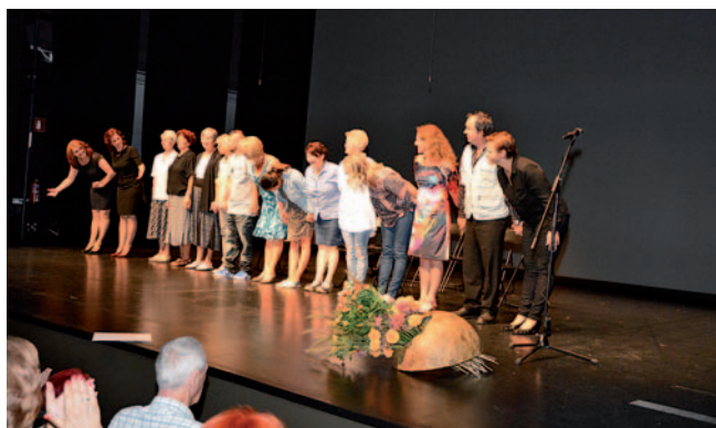
Nastopajoči na osrednji kulturni prireditvi