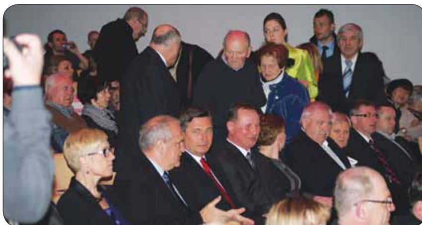
Udeleženci slavnostne prireditve in častni gostje