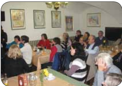
Na praznovanje dneva žena je prišlo veliko ljudi

Dan žena je mednarodni praznik posebnega pomena, ki ga naše matere in žene skupaj z ženskami iz približno stotih držav že skoraj celo stoletje (od leta 1917) praznujejo osmega marca. Osmi marec upravičeno in ponosno praznujejo kot najpomembnejši praznik, saj so se v preteklosti dolga leta težko borile za ekonomsko, politično in socialno enakopravnost ter zlasti za priznanje volilne pravice, ki je še pred dobrega pol stoletja niso imele. Zato je pravično in pošteno, da se na tako pomemben praznik skupaj poveselimo.