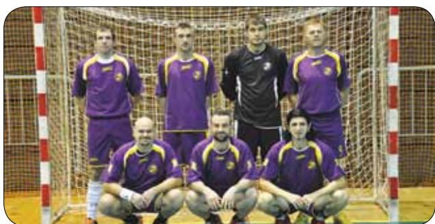
Slovenska futsal ekipa

Konec januarja smo člani športne sekcije Društva gluhih in naglušnih Podravja Maribor organizirali osmi mednarodni turnir gluhih v futsalu in tretji mednarodni turnir gluhih v odbojki.