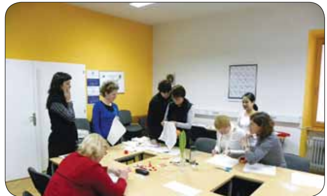
Nasveti so nam prišli prav