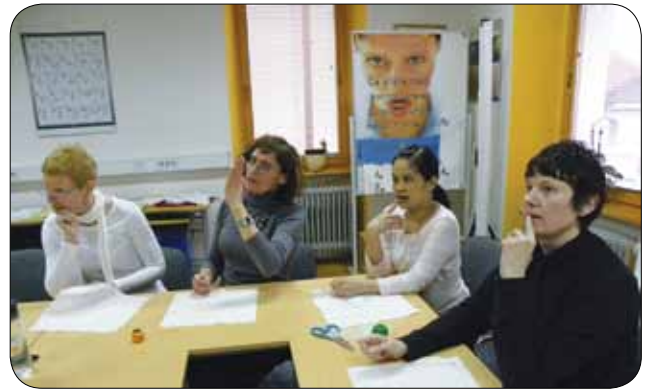
Pozorno smo poslušali navodila