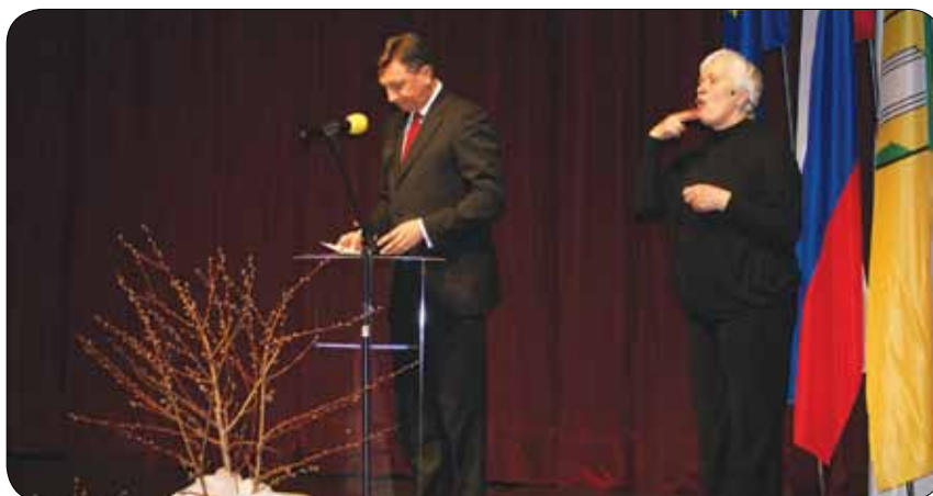
Predsednik Republike Slovenije Borut Pahor