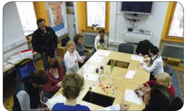
Najprej smo vse pripravili