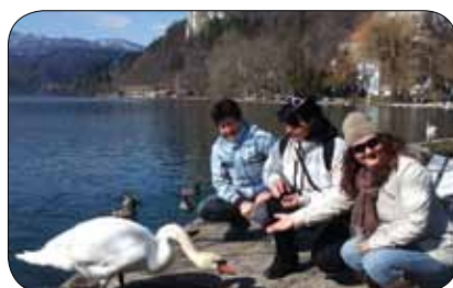
Hranile smo labode