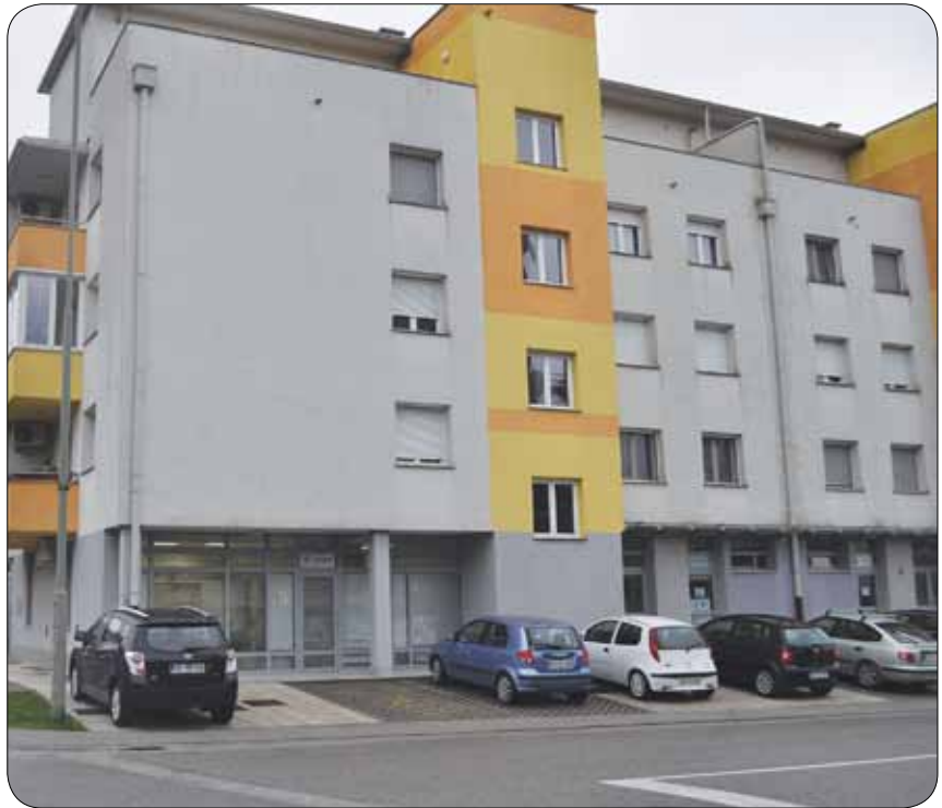
Društvo gluhih in naglušnih Severne Primorske