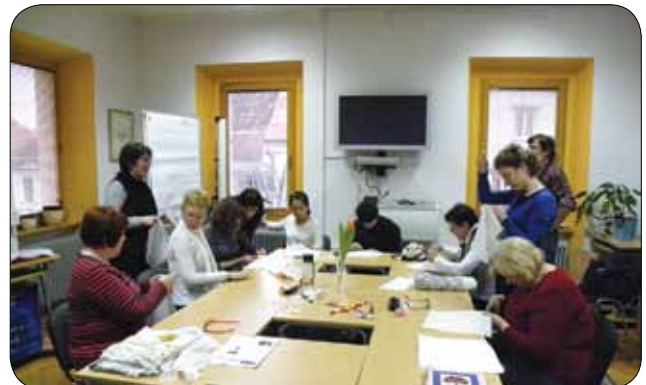
Vsaka je vezla svoj prtiček