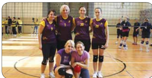
Slovenska odbojkarska ekipa

Na osnovni šoli Bojana Iliča v Mariboru je istočasno potekal tre-