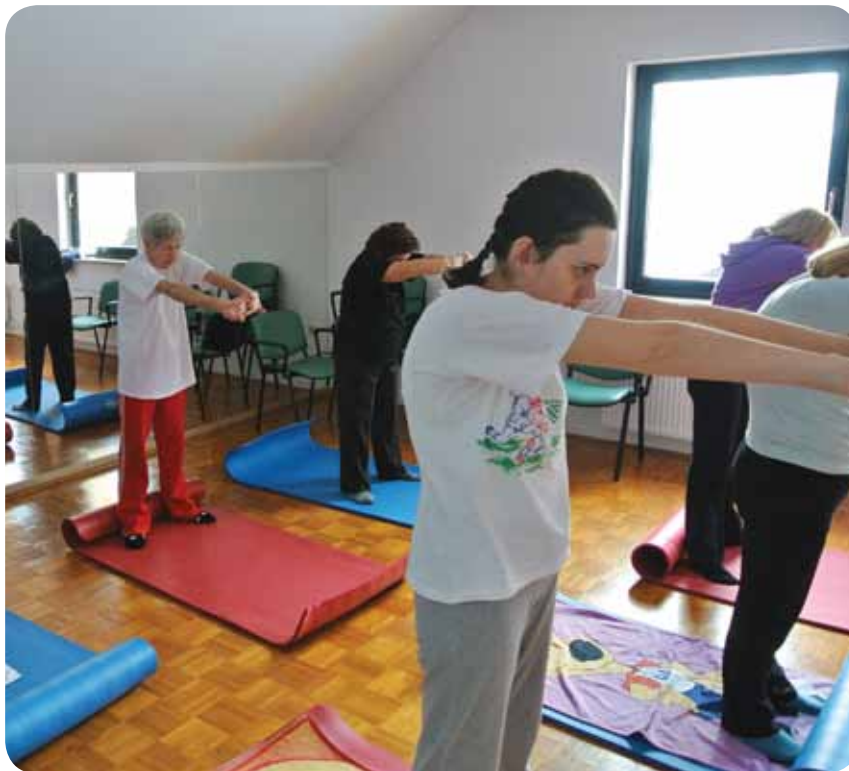
Telovadba v društvu

nju člankov, napredek v razumevanju vsebine in jezika pa je že opazen. Prav tako je opaziti veliko spremembo v načinu razmišljanja vseh udeležencev, ki je postal zelo pozitiven.