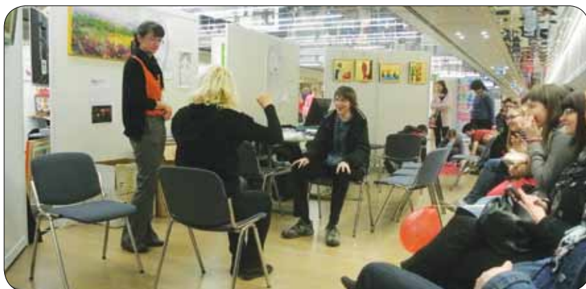
Delavnica gledališke improvizacije

Sama sem vodila delavnico gledališke improvizacije, na kateri so sodelovali dijaki gimnazije Murska Sobota. Predstavili smo jim svet gluhotе in tišine ter jim pokazali geste, mimiko in neverbalno komunikacijo. Izražali smo se brez besed ter za komunikacijo med gluhih in slišičimi uporabljali govorico telesa. Pokazali smo jim, da moramo osebe z okvaro sluha mnogo bolj uporabljati svoj vid. Dijaki so z nami dobro sodelovali ter spoznali svet tišine in komunikacijo z gluhih.