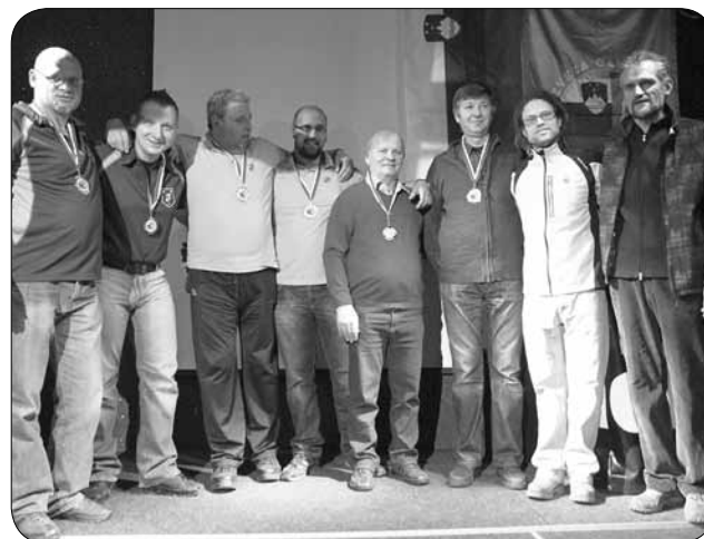
Dobitniki medalj - dvojice