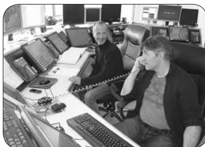
Center za obveščanje