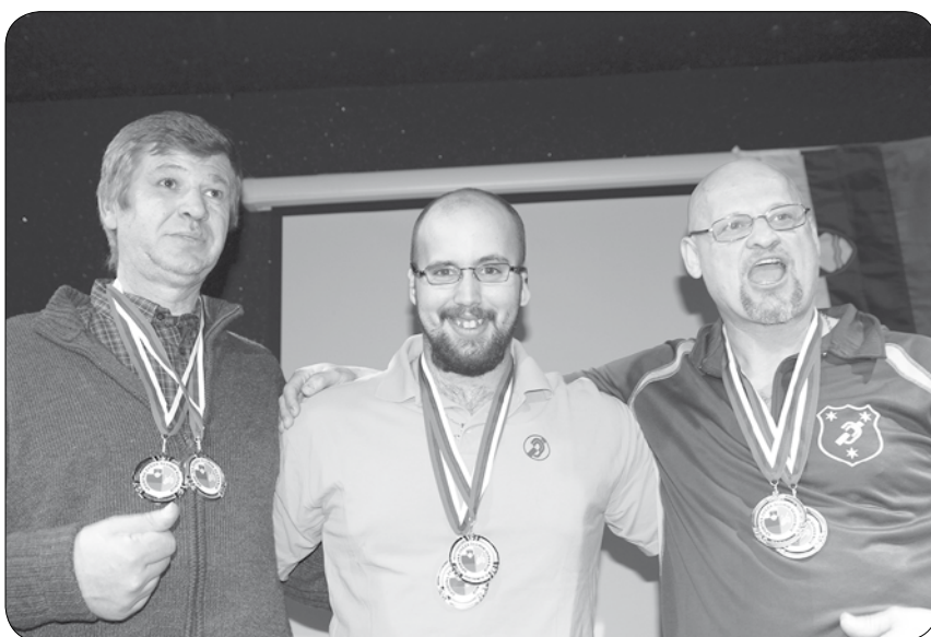
Dobitniki medalj posamično

Konec februarja je Društvo gluhih in naglušnih Severne Primorske v sodelovanju s Športno zvezo gluhih Slovenije v novogoriškem bowling centru Magma X organiziralo državno prvenstvo gluhih v bowlingu. Prvenstva se je udeležilo petdeset navdušencev iz osmih društev. Med seboj se je pomerilo sedemnajst žensk in triintrideset moških. Tekmovanje je potekalo posamično in v parih. Ženskih parov je bilo sedem, moških pa štirinajst.