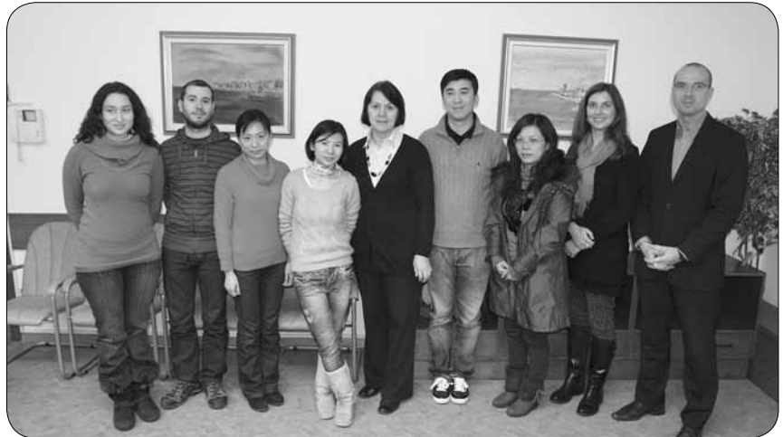
Kitajska delegacija na Zvezi