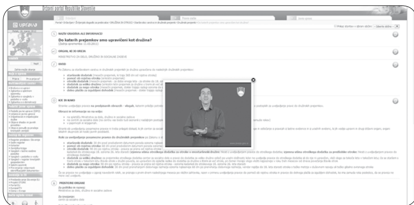
E-uprava v znakovnem jeziku

Spletna TV je bila med dobre prakse uvrščena, ker s svojo dejavnostjo neposredno udejanja 21. člen Konvencije o pravicah invalidov,