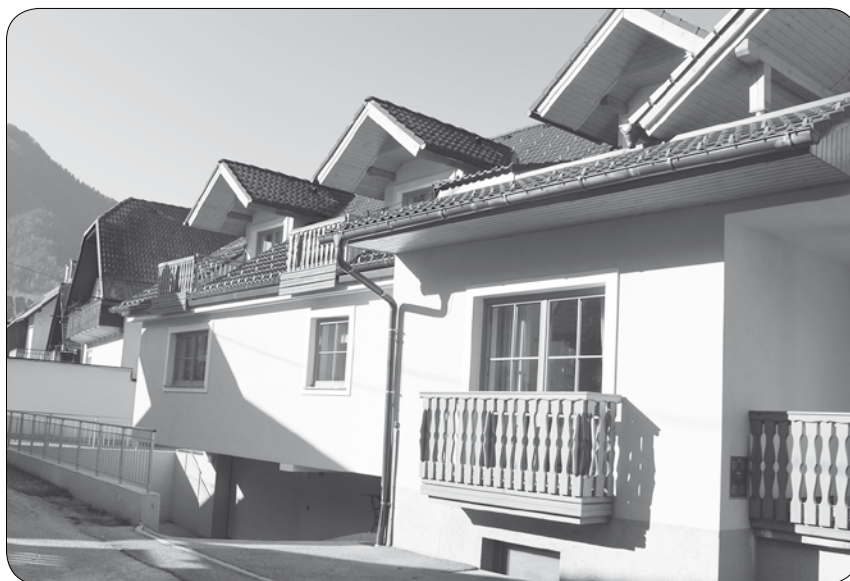
Počitniški dom v Kranjski Gori