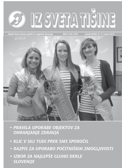
Fotografija na naslovnici: Mis gluhih Slovenije 2012

IZDAJATELJ: Zveza društev gluhih in naglušnih Slovenije, Drenikova 24, Ljubljana, telefon: 01/500 15 00, telefaks: 01/500 15 22 SPLETNA STRAN: www.zveza-gns.si GLASILO UREJA: Adem Jahjefendić, uredništvo.ist@zveza-gns.si UREDNIŠKI ODBOR: Zdenko Tomc, Franci Mulej, Boris Horvat, Nina Janžekovič, Aleksandra Rijavec Škerl, Nataša Kordiš LEKTORICA: Barbara Perc OBLIKOVANJE: Franc Planinc TISK: Farba, grafične storitve d. o. o. Uredništvo si pridržuje pravico do objave, neobjave, krajšanja ali delnega objavljanja nenaročenih prispevkov v skladu s poslanstvom in prostorskimi možnostmi glasila. V posameznih primerih mnenja posameznikov ne izražajo obvezno tudi mnenja ZDGNS. Nenaročenih besedil in fotografij ne vračamo. Ponatis celote ali posameznih delov je dovoljen le s pisnim privoljenjem. Anonimnih prispevkov oziroma prispevkov, ki žalijo čast drugih, ne objavljamo. Glasilo je brezplačno in v javnem interesu, zaradi česar na podlagi 8. točke 26. člena Zakona o davku na dodano vrednost (UL RS št. 89/98) ni zavezano k plačilu DDV-ja. Izhaja v nakladi 3.700 izvodov.