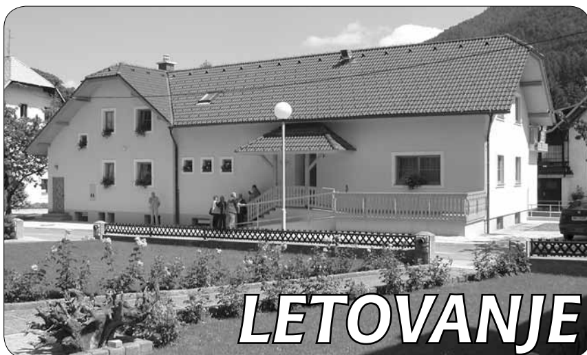
Počitniški dom v Kranjski Gori

V okviru posebnega socialnega programa za ohranjanje zdravja, ki je namenjen rehabilitaciji oseb z okvaro sluha, bo Zveza tudi v letu 2012 organizirala brezplačno letovanje socialno ogroženih članov društev in njihovih družin.