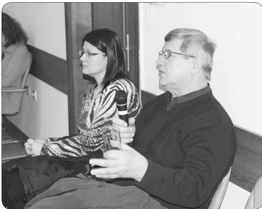
Oče gluhoslepih otrok