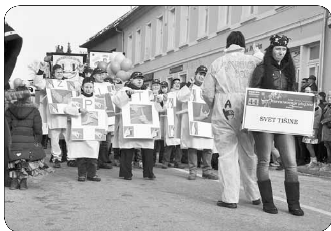
Člani društva na karnevalu