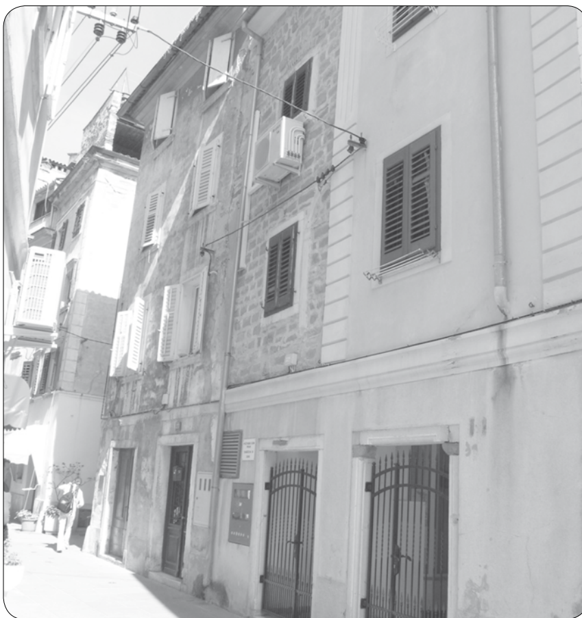
Počitniški dom Piran