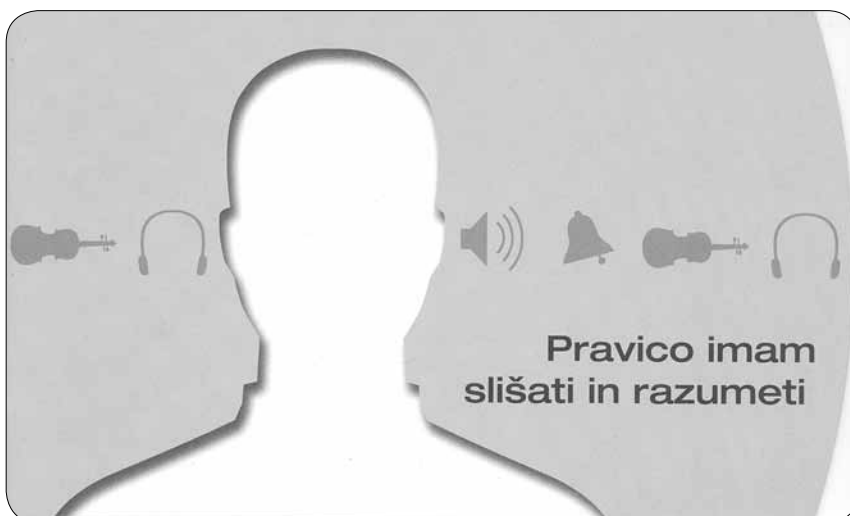
Zloženska Pravico imam slišati in razumeti

Kot gost oddaje na Radiu Ptuj sem v enourni oddaji pojasnil največje izzive, s katerimi se srečujejo osebe z okvaro sluha, ter predstavil delo mariborskega društva in ptujske podružnice. Oddajo je poslušalo 38.000 poslušalcev.