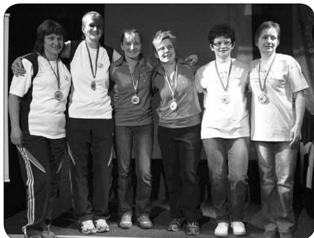
Dobitnice medalj - dvojice