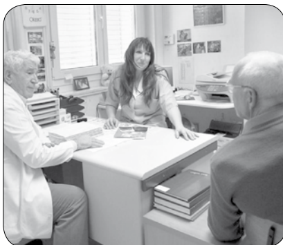
Pro bono ambulanta

V ljubljanski zdravstveni posvetovalnici za nezavarovane osebe je redno prijavljenih okrog 900 ljudi, med katerimi je 50 otrok. Poleg tega približno 600 pacientov ambulanto obišče le enkrat na leto. Prvotno je bilo med uporabniki pro bono storitev 98 odstotkov brezdomcev in le 2 odstotka ostalih. To razmerje se je v zadnjem času dobesedno obrnilo na račun ljudi, ki so ostali brez službe, ali tistih, ki jim delodajalci niso plačevali prispevkov za obvezno zdravstveno zavarovanje. V zadnjih mesecih so v ambulanti opazili velik priliv propadlih obrtnikov, ki jih je na kolena spravila finančna nedisciplinacija. Samostojnih podjetnikov, ki ne morejo uporabljati zdravstvenega zavarovanja, je po podatkih iz leta 2011 že prek 9.000. Uradno so ti ljudje in njihove družine sicer zavarovani, vendar imajo zamrznjene pravice.