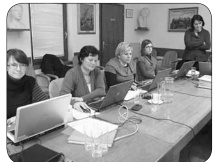
Usposabljanje za uporabo programa za evidentiranje članstva