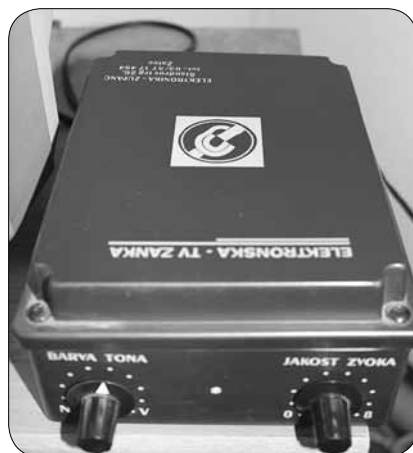
Indukcijska TV zanka