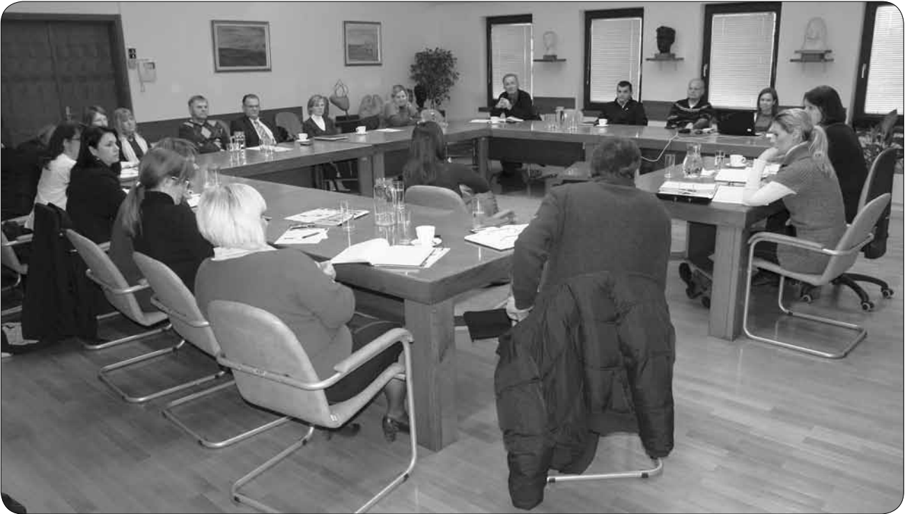
Sestanek predsednikov in tajnikov